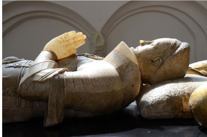
Karel van Gelre in de Eusebiuskerk te Arnhem

Na de dood van Karel van Gelre in 1538 kwam het hertogdom aan hertog Willem van Kleef. Deze werd echter in 1543 bij het Traktaat van Venlo gedwongen het hertogdom af te staan aan Karel V. Dat was tegen de afspraak; maar met het wegvallen van Karel van Gelre en diens bekwaamheid in politieke en militaire aangelegenheden restte Willem V van Kleef niet veel meer dan zich terug te trekken naar Gulik en Kleef.