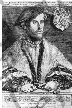
Willem V van Kleef

Na de dood van Karel van Gelre in 1538 kwam het hertogdom aan hertog Willem van Kleef. Deze werd echter in 1543 bij het Traktaat van Venlo gedwongen het hertogdom af te staan aan Karel V. Dat was tegen de afspraak; maar met het wegvallen van Karel van Gelre en diens bekwaamheid in politieke en militaire aangelegenheden restte Willem V van Kleef niet veel meer dan zich terug te trekken naar Gulik en Kleef.