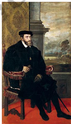
Keizer Karel V

Tijdens zijn regering werd de zelfstandigheid van Gelre bedreigd door de Habsburgers in de persoon van keizer Karel V.