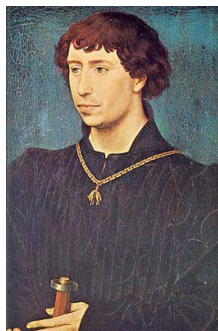
Karel de Stoute

Hij werd geboren in Grave en vanaf 1473 opgevoed onder voogdij van Karel de Stoute en later van keizer Maximiliaan I.