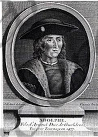
Adolf van Egmond

Karel van Gelre was de zoon van Adolf van Egmond, hertog van Gelre en graaf van Zutphen, en Catharina van Bourbon.