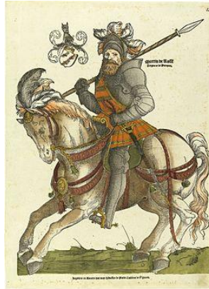
Maarten van Rossum

Karel van Gelre wist zich gesteund door zijn veldheer Maarten van Rossum en kon de ongelijke strijd, die bekendstaat onder de naam Gelderse Oorlogen, nog enige tijd volhouden, maar moest uiteindelijk het hoofd buigen.