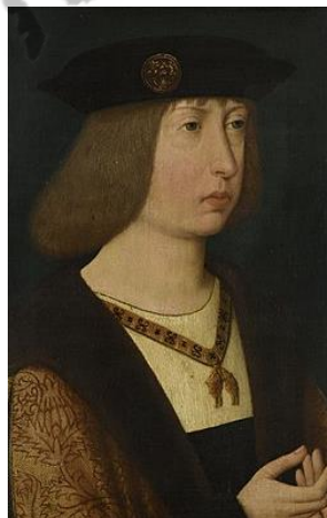
Filips de Schone

In 1504 kon Karel niets anders doen dan zich overgeven en vrede sluiten met de Habsburgers in de persoon van de Filips de Schone.