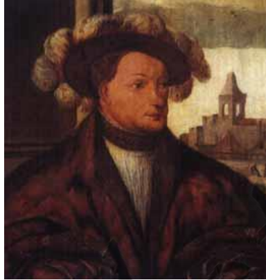
Hertog van Gelre

Karel van Gelre of Karel van Egmond, uit het huis Egmond, was van 1492 tot aan zijn dood in 1538 hertog van Gelre en graaf van Zutphen.