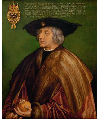
Keizer Maximiliaan I

Karel was zes jaar oud toen Bourgondische troepen onder leiding van Karel de Stoute Nijmegen onder de voet liepen. Hij werd als gijzelaar meegevoerd en grootgebracht aan het Bourgondische hof. Als jonge ridder vocht hij in het leger van Maximiliaan van Oostenrijk tegen de opstandige Vlaamse steden en tegen de Fransen. Die maakten hem krijgsgevangen en in de jaren aan het Franse hof werd hij omgevormd tot bondgenoot tegen de Bourgondiërs.