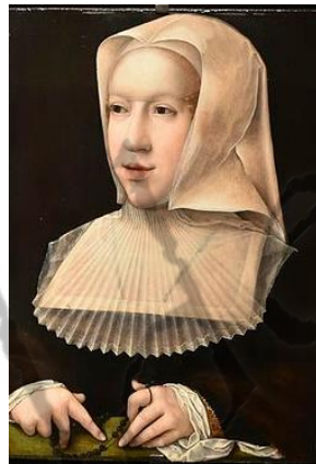
Margaretha van Oostenrijk

Hij reisde naar Antwerpen om zich in te schepen maar toen de kust in 1505 weer veilig was, omdat Filips naar Spanje was vertrokken, keerde hij weer naar Gelre terug om zijn regering als hertog voort te zetten. Toen Filips in 1506 in Spanje overleed, werd het pokerspel van Karel beloond. In de daaropvolgende jaren wist hij de troepen van Margaretha van Oostenrijk, die door haar vader Maximiliaan van Oostenrijk als landvoogdes was aangesteld, te verslaan en Gelre stukje voor stukje terug te veroveren.