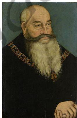
George met de Baard

In 1539 volgde hij zijn broer George met de Baard op als hertog van Saksen.