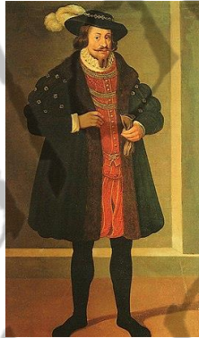
Magnus II van Mecklenburg