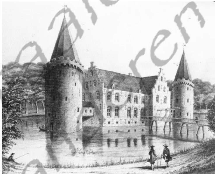
Afbeelding van Sjaerdemaslot uit de 18e eeuw

Hendriks vader Albrecht de Kloekmoedige werd in 1498 heerser van Friesland. Tot dit gebied behoorden ook de eilanden Terschelling, Griend (toen nog bewoond en omringd door stadsmuren), Ameland en de buitendijkse kweldergronden, het tegenwoordige Bildt. Hertog Hendrik zetelde zich daarop in stad Franeker en oefende daar de feitelijke macht uit namens zijn vader. Omdat Hendrik met open armen werd ontvangen door de Franekers en hem direct het Sjaerdemaslot werd gegeven schonk Hendrik de Franekers vele privileges en stelde hen vrij van een aantal belastingen.