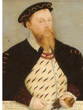
Maurits van Saksen

Onderdanen die zich niet wensten te bekeren liet hij verbannen of gevangenzetten. Na zijn dood op 18 augustus 1541 werd hij opgevolgd door zijn zoon Maurits.