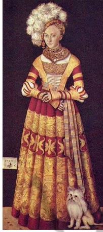
Catharina van Mecklenburg