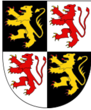
Het wapenschild van de hertogen van Brabant en Limburg.