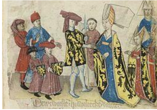
Het huwelijk van Margaretha van Vlaanderen met hertog Jan I van Brabant

Jan I van Brabant had ook talrijke erkende bastaarden: