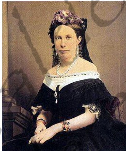
Louise van Oranje-Nassau

Op 19 juni 1850 trouwde Karel met de Nederlandse prinses Louise (1828-1871), dochter van prins Frederik.