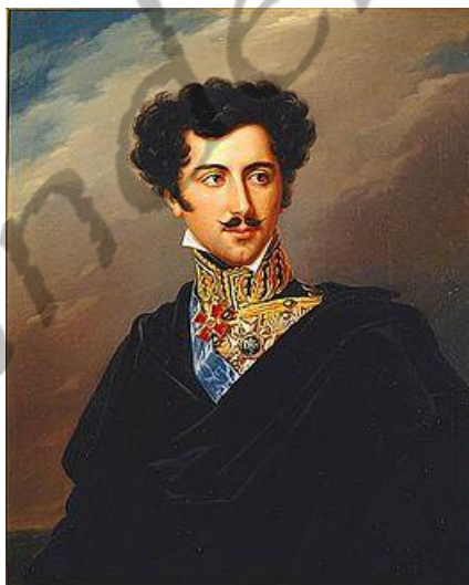
Oscar I van Zweden