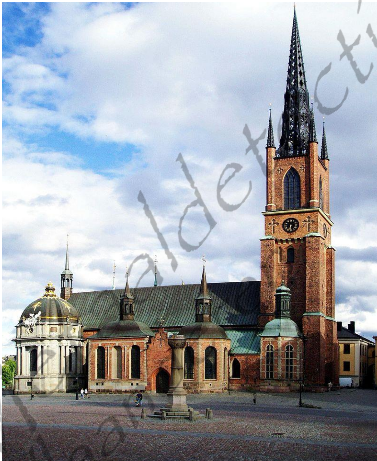
Kerk van Riddarholmen

Het lichaam van Karel XV en zijn vrouw Louise van Oranje-Nassau liggen begraven in de kerk van Riddarholmen in Stockholm.