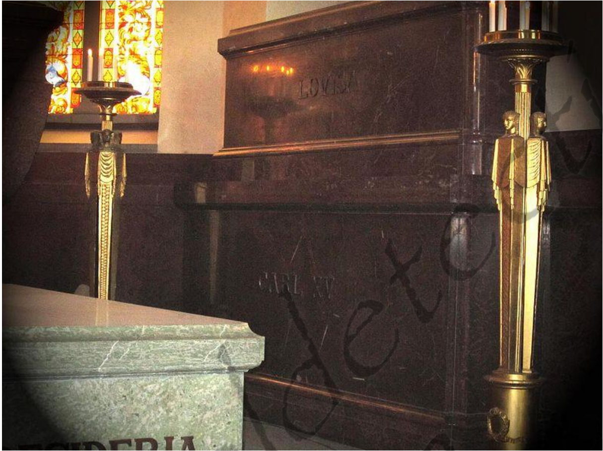
Tombes van Karel XV en Louise van Oranje-Nassau