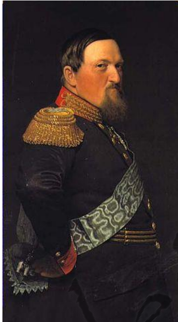
Frederik VII van Denemarken