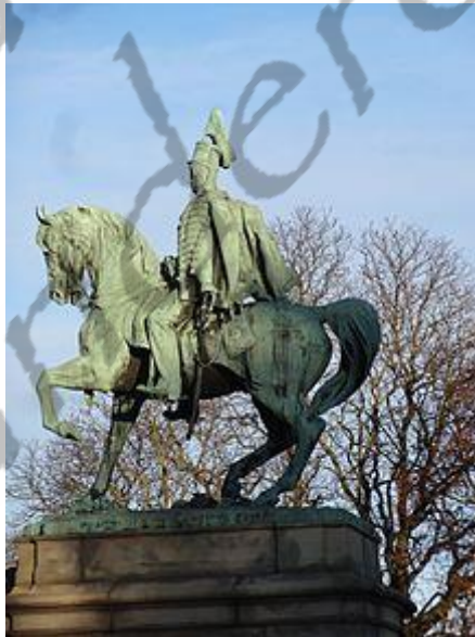
Standbeeld Karel XV in Stockholm

Karel overleed in september 1872, 46 jaar oud. Omdat hij geen (overlevende) zoon meer had, werd hij opgevolgd door zijn broer Oscar.