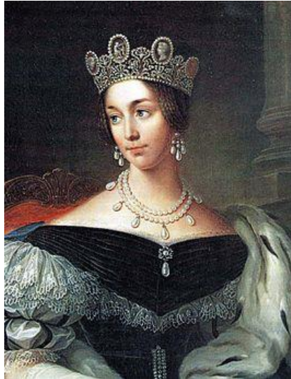
Josephine van Leuchtenberg

Op 19 juni 1850 trouwde Karel met de Nederlandse prinses Louise (1828-1871), dochter van prins Frederik.