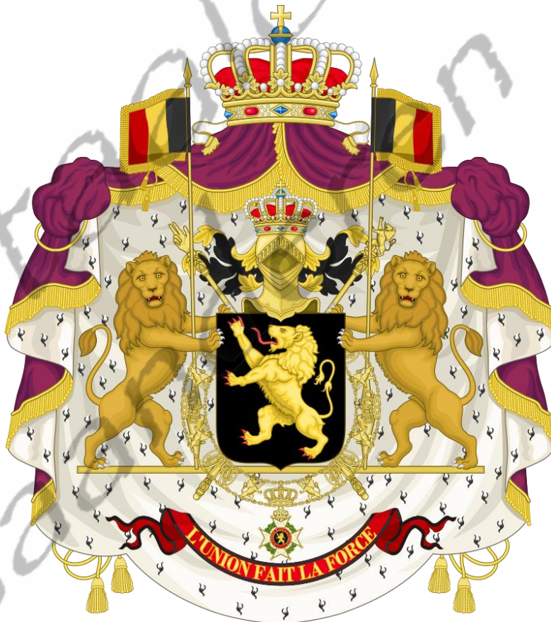
Wapen als koning van België