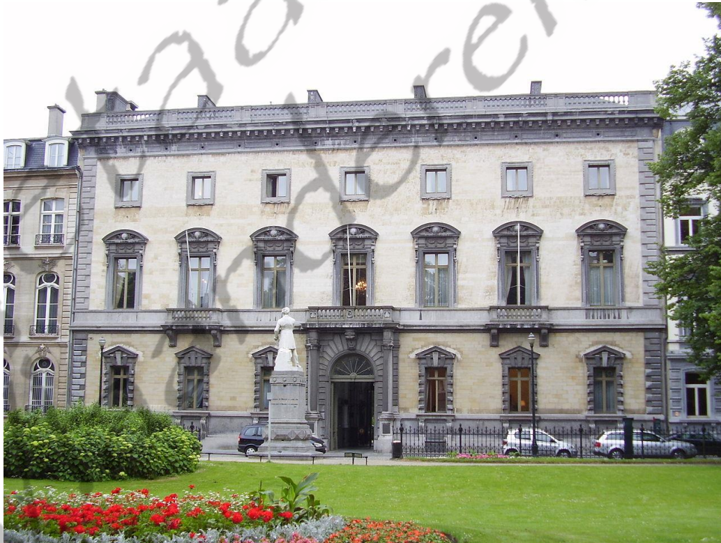
Het Paleis Van der Noot d'Assche

Leopold III werd geboren in Brussel in het in het Paleis Van der Noot d'Assche in de Wetenschapsstraat in de Wetenschapsstraat