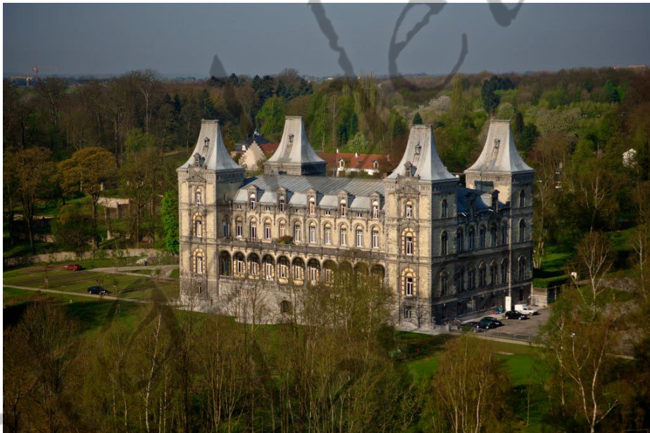
Het kasteel van Argenteuil

Leopold III en prinses Lilian bleven, met hun gezin inclusief koning Boudewijn, na zijn aftreden wonen op het kasteel van Laken. Pas na het huwelijk van Boudewijn met Fabiola in december 1960 verhuisden ze naar het domein Argenteuil in Waterloo. Enkel tijdens de begrafenis van koningin Elisabeth in 1965 verschenen Leopold en Boudewijn nog samen in het openbaar.