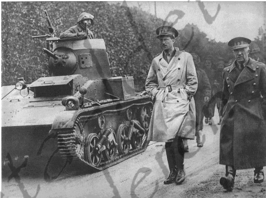
Leopold III op 18 mei 1940 met minister van landsverdediging generaal Denis

In mei 1940, bij de inval van België door nazi-Duitsland, stond Leopold erop om persoonlijk het opperbevel over het Belgische leger te voeren in de Achttiendaagse Veldtocht, zoals zijn vader, die zijn grote voorbeeld was, het leger in de Eerste Wereldoorlog had aangevoerd. Hij gaf een letterlijke betekenis aan het artikel van de grondwet dat aan de koning het opperbevel over het leger gaf. De regering hield het echter bij de stelling dat, net als alle andere koninklijke prerogatieven, het bevel over het leger ondergeschikt was aan het akkoord van de regering, minstens van de minister van Defensie. Zolang er gestreden werd wilde de regering-Pierlot het ongecontroleerde bevelhebberschap aanvaarden, maar stelde de voorwaarde dat zodra de gevechten zouden eindigen en het land onder de bezetting van de Duitse overwinnaar zou komen, de koning mee met de regering het land moest verlaten en vanuit het buitenland de strijd voort moest zetten. Omdat hij dit weigerde en het zijn plicht achtte bij zijn volk te blijven kwam het tot een breuk met de regering van Hubert Pierlot. Dit gegeven vormde de kiem van de latere koningskwestie. Het laatste en dramatische gesprek tussen de koning en zijn ministers Pierlot, Spaak, Vanderpoorten en Denis vond plaats in Wijnendale op 25 mei. Na de slag aan de Leie capituleerde Leopold.