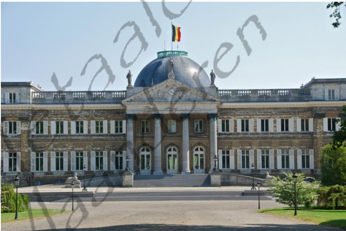
Kasteel van Laken

Nu de koning in handen was gevallen van de vijand en onder huisarrest in het kasteel van Laken verbleef ontnam de ministerraad hem zijn grondwettelijke bevoegdheden, op basis van artikel 82 van de Grondwet: de koning "verkeerde in de onmogelijkheid om te regeren". De grondwet voorzag in dit geval de bijeenroeping van de verenigde kamers, die een regent moesten aanduiden. Aangezien ook dit onmogelijk was besliste de regering dat zij de volheid van de grondwettelijke bevoegdheden op zich nam.