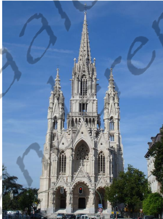
O.L. Vrouwenkerk van Laken