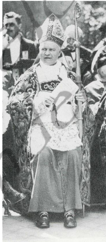
Kardinaal Van Roey

Het burgerlijk huwelijk werd op 7 december via een kerkelijke brief van kardinaal Van Roey bekendgemaakt. Daarin maakte deze ook melding van hun kerkelijk huwelijk dat reeds op 11 september door hem zou ingezegend zijn.