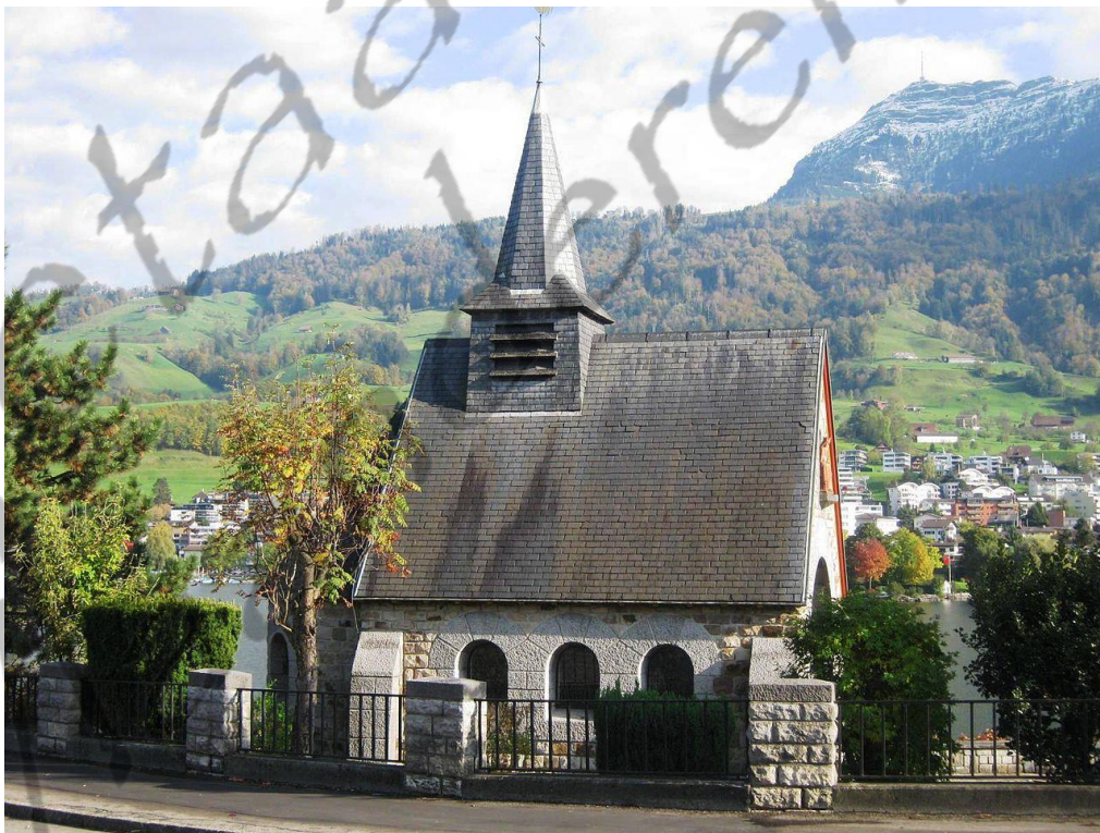
Astrid Kapelle in Küsnacht 1935

Op 29 augustus 1935 in het Zwitserse Küsnacht verloor Leopold III als chauffeur de controle over het stuur van de wagen en koningin Astrid werd uit de wagen geslingerd met haar hoofd tegen een perenboom, waarbij zij overleed. Leopold was licht gekwetst. Hij liet op de plaats van het ongeval een kapel bouwen.