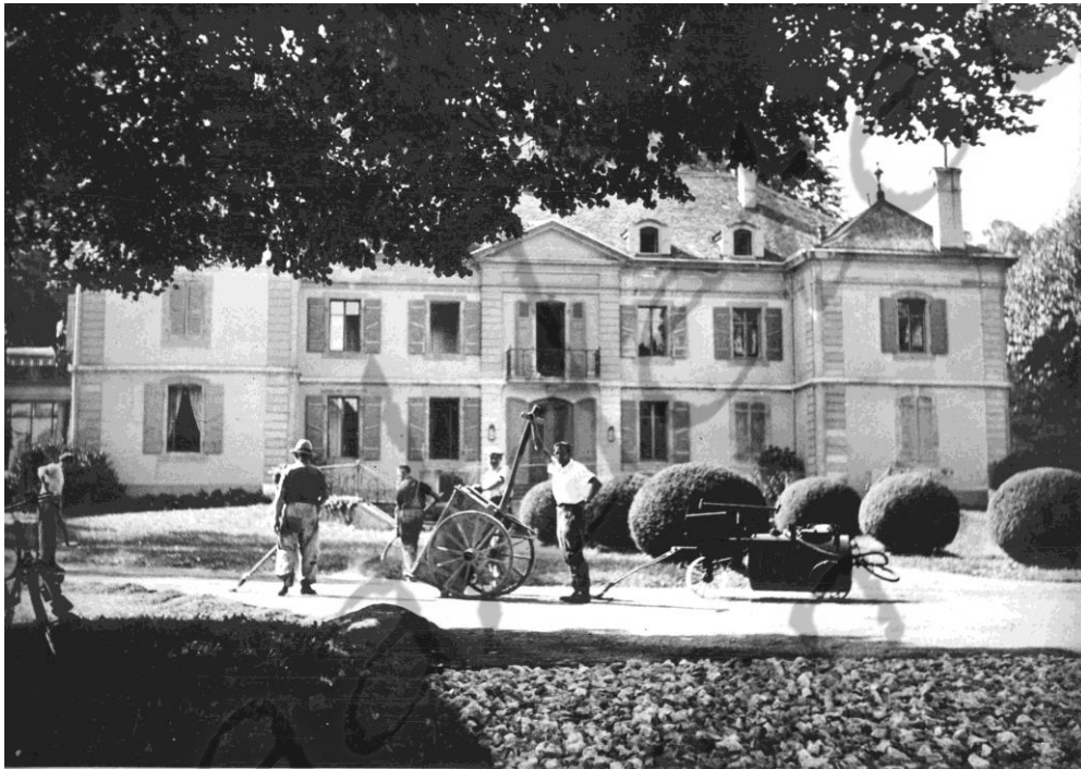
villa Le Reposoir in Pregny-Chambésy