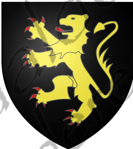
Wapenschild van het hertogdom Brabant

Nadat een jaar lang het gerucht ging dat Leopold zich met de Italiaanse prinses Mafalda zou verloven[3], trouwde hij op 4 november 1926 in Stockholm met de Zweedse prinses Astrid. Uit dit huwelijk werden drie kinderen geboren: