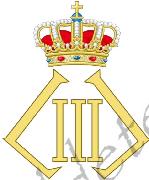
Koninklijk monogram van koning Leopold III