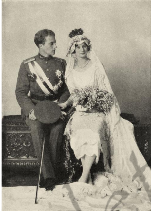
Huwelijk van Leopold III met Astrid

Leopold legde op 23 februari 1934 de eed af, nadat koning Albert I op 17 februari in Marche-les-Dames het leven liet bij een rotsbeklimming.