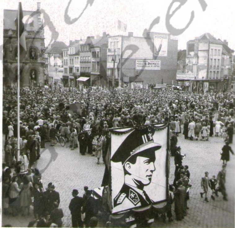
Kortrijk tijdens de koningskwestie

De Belgische verkiezingen 1950 van 4 juni leverden de CVP een absolute meerderheid, waarmee ze een homogene CVP-regering-Duvieusart I vormde. Op 20 juli 1950 stelde het parlement het einde vast van de onmogelijkheid tot regeren van Leopold III. Dit betekende het einde van het regentschap, en twee dagen later landde de koning in België, met de bedoeling zijn koninklijke functies weer op te nemen. Dit leidde bijna tot een burgeroorlog, met betogingen, stakingen en geweld. Te Grâce-Berleur schoot de rijkswacht drie betogers dood en een vierde stierf nadien. De tegenstanders van Leopold kondigden een mars op Brussel aan voor 1 en 2 augustus.