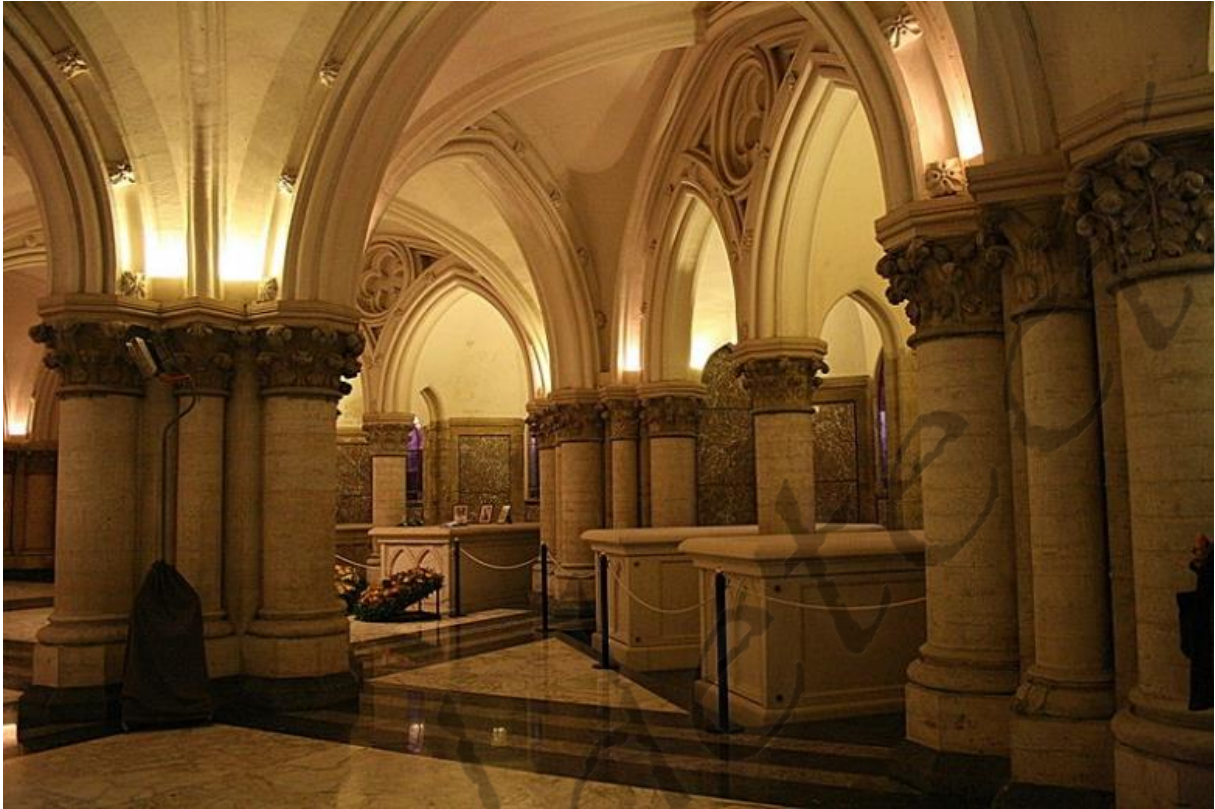
Koninklijke crypte O.L. Vrouwenkerk van Laken