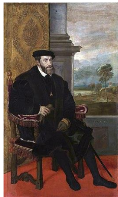
Keizer Karel V

Ondertussen stonden de geopolitieke ontwikkelingen in Europa ook niet stil. Sinds 1494 woedden de Italiaanse Oorlogen, waarin in 1527 Rome geplunderd werd (Sacco di Roma) door de troepen van keizer Karel V.