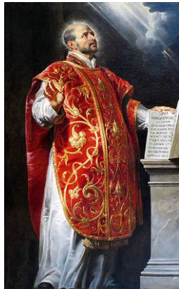
Ignatius van Loyola

Niet lang hiervoor, in 1539, had de ascetische Spaanse priester Ignatius van Loyola een bezoek aan Rome gebracht waar hij grote indruk maakte met zijn geloofsijver.