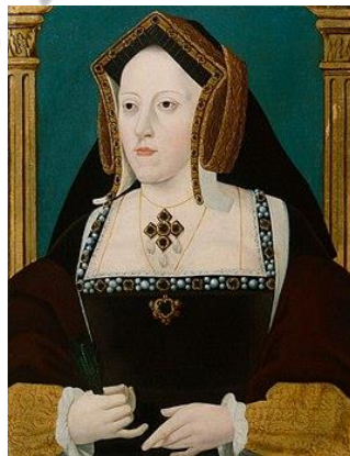
Catharina van Aragon