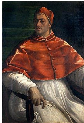
Paus Clemens VII

Na de dood van Clemens VII werd hij verkozen tot paus.