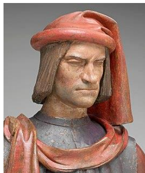
Lorenzo I de' Medici

Reeds op 25-jarige leeftijd, in 1493, werd hij benoemd tot kardinaal alhoewel hij nog leek was en 16 jaar later, in 1509, had hij het al tot bisschop van Parma gebracht. In die periode nam hij ook een maîtresse, die hem vier kinderen schonk.