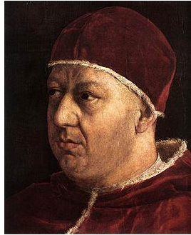
Paus Leo X

Hierin sprak hij zich uit voor grondige hervormingen in het kerkwezen. Als reactie hierop had paus Leo X hem in 1521 geëxcommuniceerd.