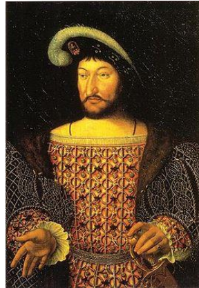
Frans I van Frankrijk

In 1529 ondertekenden de betrokken partijen de Damesvrede van Kamerijk. Frans I van Frankrijk liet daarmee zijn claim op Italië vallen (eerder had Karel V Frans I in 1525 beslissend verslagen bij de slag bij Pavia).