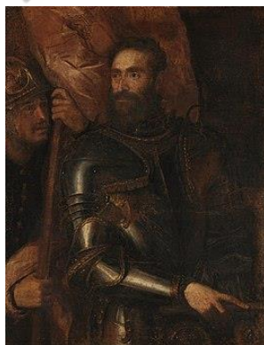
Pier Luigi Farnese

Pier Luigi Farnese, de zoon van de paus, was hertog van Parma en Piacenza.