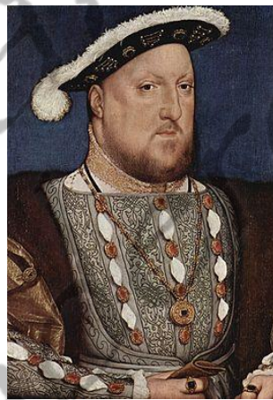
Hendrik VIII van Engeland

De grootste bedreiging voor de stabiliteit van Karels rijk waren de godsdienstoorlogen. De macht van de katholieke kerk leek tanende. Engeland was onder Hendrik VIII in 1534 anglicaans geworden nadat de paus hem in de ban had gedaan vanwege Hendriks scheiding van Catharina van Aragon.