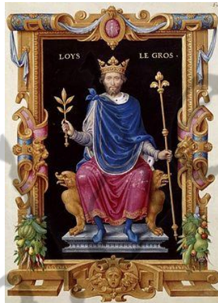
Lodewijk VI van Frankrijk

Koning Lodewijk VI van Frankrijk had echter Willem Clito, eveneens in de moederlijke lijn afstammend van de Vlaamse graven, als graaf benoemd.