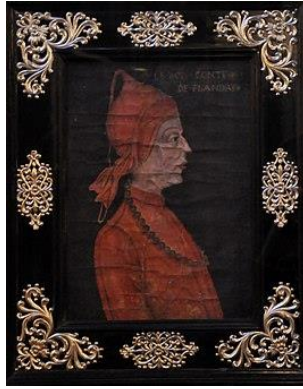
Portret op papier van Karel de Goede in de Sint-Salvatorskathedraal ( Brugge )

Koning Lodewijk VI van Frankrijk had echter Willem Clito, eveneens in de moederlijke lijn afstammend van de Vlaamse graven, als graaf benoemd.