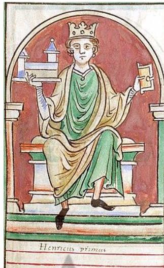
Hendrik I van Engeland

Diederik excommuniceren en belegerde hem in Rijsel. De Franse koning moest zich echter terugtrekken toen bleek dat Diederik de steun van Hendrik I van Engeland had.