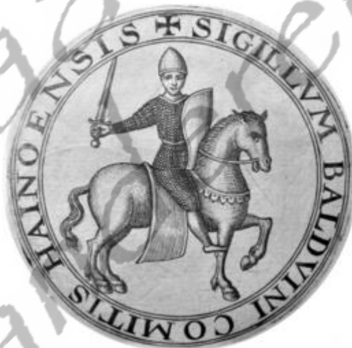
Zegel van Boudewijn IV van Henegouwen

In 1128 leed Diederik nederlagen bij Ruiselede (Slag bij Axpoele) en Oostkamp en moest hij vluchten, eerst naar Brugge en daarna naar Aalst. Willem belegerde de stad maar werd op 27 juli dood in zijn tent aangetroffen. Dit werd door beide partijen als een teken gezien dat Diederik de rechtmatige graaf was, en er werd vrede gesloten. Diederik stond in 1128 verheffingsrechten op al zijn persoonlijke lenen in het hele graafschap af aan de Tempeliers. Dit was een grote schenking: een enorme bron van geldelijke inkomsten voor de nieuwe tempelorde. In 1157 vaardigde hij een akte uit, dat er voortaan een tempelier aan het grafelijk hof zou verblijven om de verheffingsrechten te innen. In 1132 huldigde Diederik Lodewijk als zijn koning, in ruil voor zijn steun tegen de aanspraken van Boudewijn IV van Henegouwen.