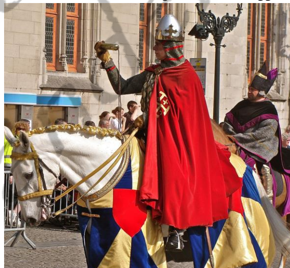
Diederik van de Elzas brengt het Heilig Bloed naar Vlaanderen. Nagespeeld in de Heilig Bloedprocessie.

Hij werd begraven in de Abdij van Waten.