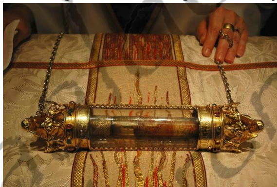
De relikwie van het Heilig Bloed van Brugge

Diederik zou het relikwie van het Heilig Bloed hebben meegenomen van zijn reizen.