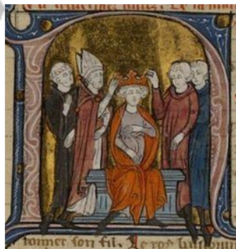
Boudewijn III van Jeruzalem

Diederik nam deel aan de Tweede Kruistocht. Hij gaf leiding aan de oversteek van de Meander en vocht mee in een veldslag bij Konya. Diederik nam deel aan het beraad waarin werd besloten om Damascus aan te vallen, tegen de zin van de lokale kruisvaarders die aanvoerden dat ze altijd in vrede met Damascus hadden geleefd. Diederik eiste de stad op als hoofdstad voor zijn eigen kruisvaardersstaat en werd daarin gesteund door zijn zwager Boudewijn III van Jeruzalem, Lodewijk VII van Frankrijk en Koenraad III van Hohenstaufen - zeer tegen de zin van de leiders van de kruisvaardersstaten.