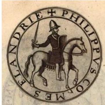
Het zegel van Filips van de Elzas

In 1156 trok Diederik voor de derde maal naar het Heilige Land. Ditmaal nam hij Sybille mee, en liet zijn zoon Filips van de Elzas achter als regent.