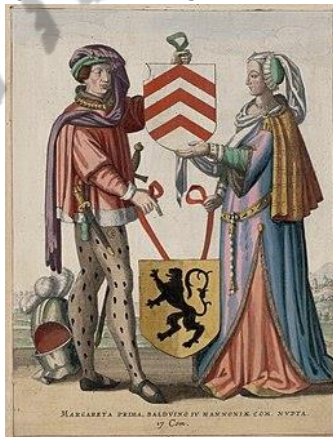
Gravin Margaretha met haar echtgenoot Boudewijn van Henegouwen (afbeelding uit Flandria illustrata, 1641)

Door onderlinge verdeeldheid van de kruisvaarders liep het beleg na vier dagen al uit op een mislukking en trokken de kruisvaarders zich terug op Jeruzalem. In 1150 keerde hij terug naar Vlaanderen. Boudewijn van Henegouwen probeerde namelijk om Vlaanderen te veroveren maar Sybille (die als regentes was achtergebleven) wist hem te weerstaan en liet ook plundertochten in Henegouwen uitvoeren. Het volgende jaar sloot Diederik vrede met Boudewijn, met de afspraak dat hun kinderen, Margaretha en Boudewijn V van Henegouwen zouden trouwen.