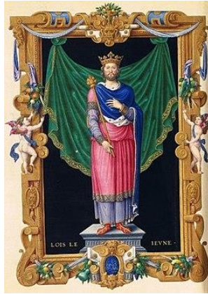
Lodewijk VII van Frankrijk