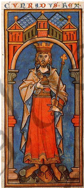
Koenraad III van Hohenstaufen

Door onderlinge verdeeldheid van de kruisvaarders liep het beleg na vier dagen al uit op een mislukking en trokken de kruisvaarders zich terug op Jeruzalem. In 1150 keerde hij terug naar Vlaanderen. Boudewijn van Henegouwen probeerde namelijk om Vlaanderen te veroveren maar Sybille (die als regentes was achtergebleven) wist hem te weerstaan en liet ook plundertochten in Henegouwen uitvoeren. Het volgende jaar sloot Diederik vrede met Boudewijn, met de afspraak dat hun kinderen, Margaretha en Boudewijn V van Henegouwen zouden trouwen.