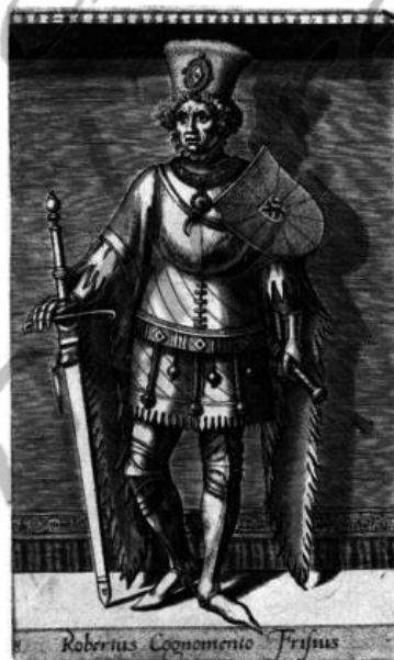
Robrecht I de Fries

Als kleinzoon van graaf Robrecht I de Fries kon hij na de moord op Karel de Goede in 1127 via zijn moeder Gertrudis rechten doen gelden op het graafschap Vlaanderen.