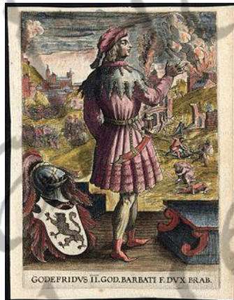
Godfried II van Leuven

Hij leidde een succesvolle expeditie naar Pnias en nam deel aan de invasie van Gilead (het gebied ten oosten van de Jordaan). In datzelfde jaar keerde hij terug naar huis om Godfried II van Leuven bij te staan in de Grimbergse Oorlogen.