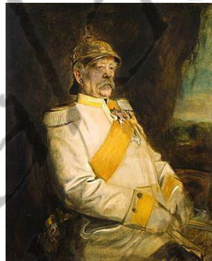
Otto von Bismarck

Op 17 februari 1871 koos de Nationale Vergadering in Versailles hem tot "hoofd van de uitvoerende macht van de Republiek". In die functie voerde hij vredesbesprekingen met de Duitse kanselier Otto von Bismarck.