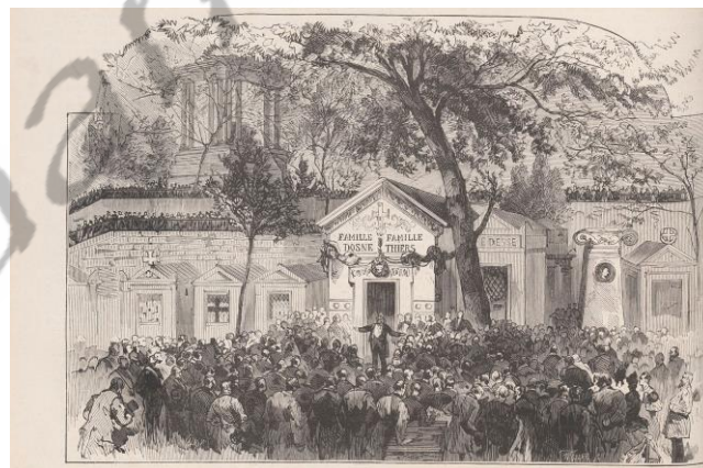
Begrafenis van Adolphe Thiers in de kapel Dosne-Thiers