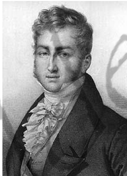
Jules de Polignac

Thiers studeerde rechten in Aix-en-Provence, maar zijn voorkeur ging eerder uit naar literatuur. In 1821 vertrok hij naar Parijs waar hij bijdragen leverde voor de krant Constitutionnel. Ondertussen werd hij bekend in liberale kringen. Van zijn hand verscheen tussen 1823 en 1827 het tiendelige Geschiedenis van de Franse Revolutie wat zijn populariteit vergrootte. Tijdens de regering van minister-president Jules de Polignac richtte Thiers met onder andere Armand Carrel Le National op; een nieuwe krant voor de oppositie.