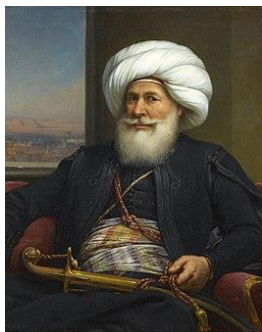
Mohammed Ali van Egypte

Na zijn afreden verbleef hij enige tijd in Italië. Vanaf 1838 zat hij in de oppositie. In 1840 kreeg hij een tweede termijn als voorzitter van de ministerraad en minister van buitenlandse zaken. Zijn politiek om Mohammed Ali van Egypte te steunen leidde bijna tot een oorlog met andere grootmachten in datzelfde jaar.