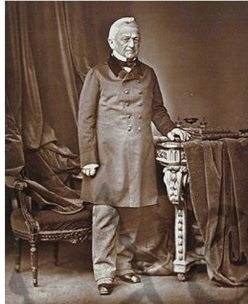
President van Frankrijk

Marie Joseph Louis Adolphe Thiers was een Franse politicus en geschiedkundige. Hij was een toonaangevende geschiedkundige van de Franse Revolutie, met een meerdelig boek dat stelde dat het republikanisme van de Revolutie het centrale thema van de moderne Franse geschiedenis was.