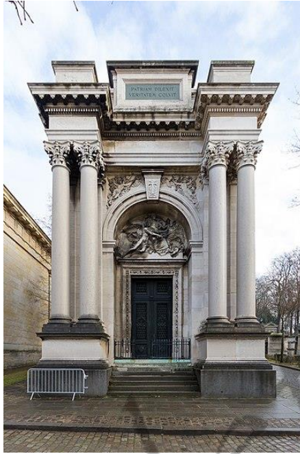
Westelijke gevel van het monument