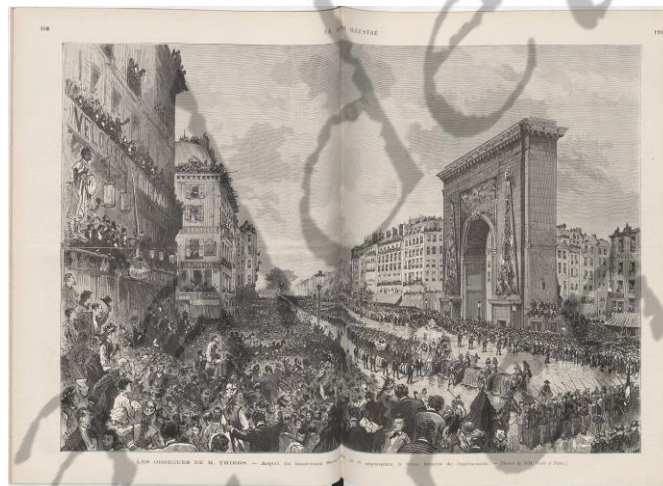
De processie die de boulevard Saint-Denis passeert