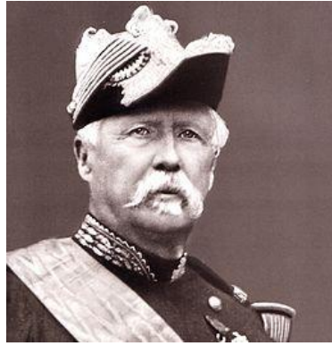
Patrice de Mac Mahon

Hij bleef nog tot zijn dood in 1877 in het parlement zitten.