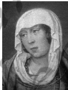
Johanna van Castilië

Na de expeditie richtte de koning zijn aandacht op Castilië. Alfons V trouwde in 1475 met Juana la Beltraneja, waarmee hij zich mengde in de strijd rondom de Castiliaanse troonopvolging.