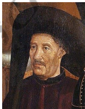
Hendrik de Zeevaarder

De koning steunde de tochten van Hendrik de Zeevaarder, maar na diens dood besteedde Alfons V de verdere ontdekking van Afrika uit aan Fernão Gomes.