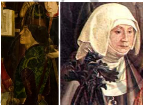
Eduard van Portugal en Eleonora van Aragón

Alfons was de oudste zoon van koning Eduard en Eleonora van Aragón. Hij was slechts zes jaar oud toen hij zijn vader in 1438 opvolgde.