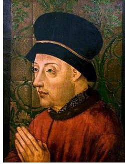
Johan I van Portugal

Dit project werd onder de regering van Alfons V voortgezet, en resulteerde in de publicatie van de "Ordenações do Senhor Rei Afonso V" in 1446. Hoewel dit werk geen systematische indeling kende naar onderwerp, maar ingedeeld was naar oorsprong van wetten en verordeningen, betekende dit toch een belangrijke vooruitgang in het Portugese rechtssysteem.