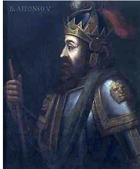
Koning van Portugal

Alfons V (Portugees: Afonso V) was koning van Portugal van 1438 tot 1481.