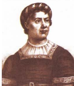
Peter van Portugal

Volgens het testament van zijn vader moest hij, totdat hij meerderjarig zou zijn, onder voogdij van zijn moeder regeren. Koningin Eleonora was niet populair aan het Portugese hof, mede door het feit dat zij uit Spanje afkomstig was. De Portugese edelen kwamen tegen haar in opstand en de koningin vond slechts steun bij Alfonso, de halfbroer van de voormalige koning. De Portugese hofraad besloot de koningin af te zetten en benoemde Peter, hertog van Coimbra, tot regent (van 1439 tot 1448).