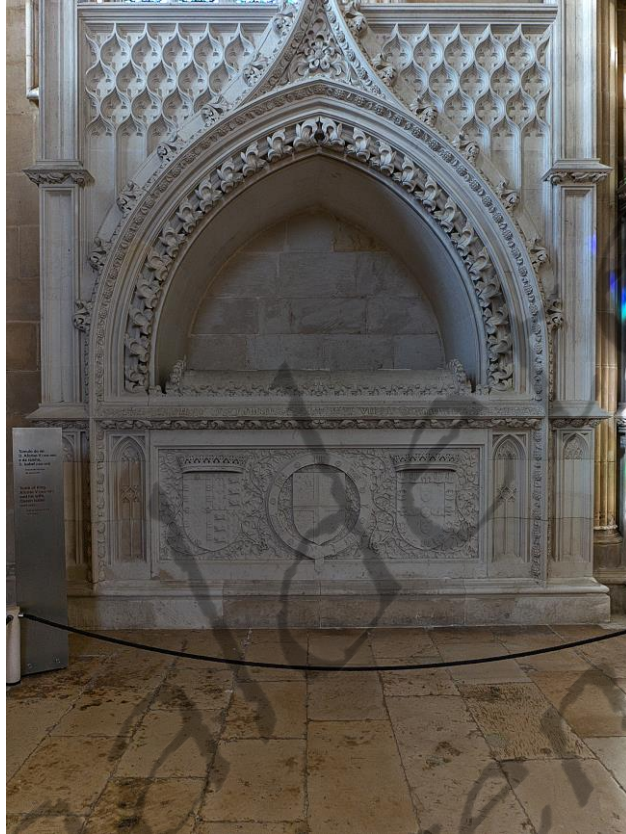
Graf van Alfons V en Isabella van Portugal in het Batalha-klooster