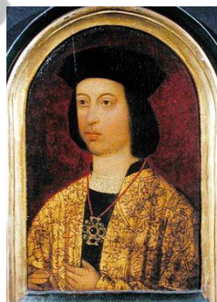
Ferdinand II van Aragon

Juana's moeder was een zus van Alfons. Toen Alfons echter met zijn troepen Spanje binnentrok, werd hij door de troepen van Ferdinand II van Aragón verslagen in de Slag bij Toro.