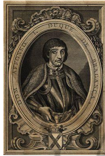
Alfons I van Bragança

In 1442 benoemde de koning zijn halfoom Alfons tot hertog van Bragança, waardoor deze de machtigste man van Portugal en een van de rijkste mannen van Europa werd. Om zijn positie te verstevigen huwelijkte Peter zijn dochter, Isabel van Coimbra, uit aan de koning.