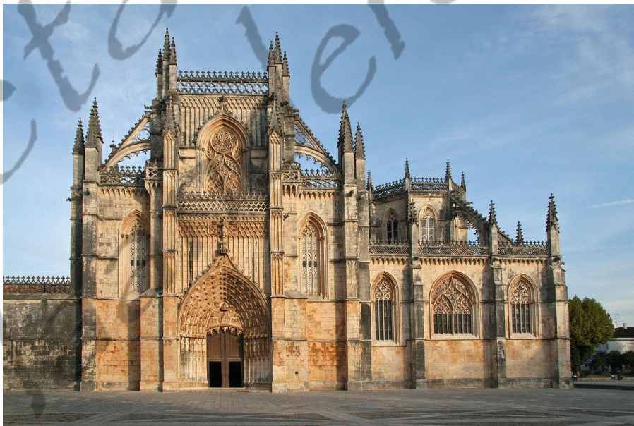
Klooster van Batalha