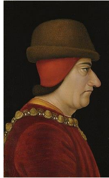
Lodewijk XI van Frankrijk

deed afstand van de troon ten gunste van zijn zoon João (Johan II) en trok zich terug in een klooster in Sintra waar hij in 1481 stierf.