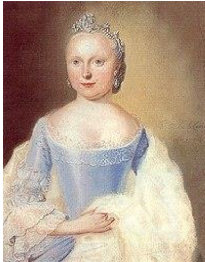
Carolina van Oranje-Nassau

Frederik Willem werd na het overlijden van zijn broer Lodewijk in 1770 erfprins. Hij volgde Lodewijk ook op als kolonel van het Overijsselse regiment cavalerie en werd tevens kapitein der grenadiers van het Staatse leger, tot 1784. Tot slot volgde hij Lodewijk op als proost van Sint-Jan te Utrecht, wat hij bleef tot de opheffing van deze functie in 1795. Hij werd ridder in de Orde van de Olifant.