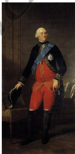
Karel Christiaan van Nassau-Weilburg

Frederik Willem was de vierde, maar oudst overlevende, zoon van vorst Karel Christiaan van Nassau-Weilburg en Carolina van Oranje-Nassau, dochter van prins Willem IV van Oranje-Nassau en Anna van Hannover.