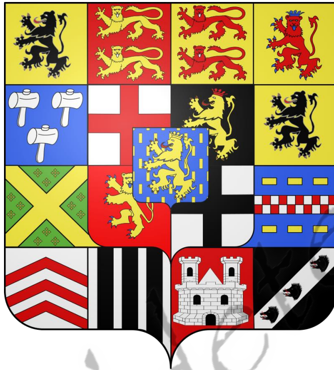
Het wapen van het hertogdom Nassau