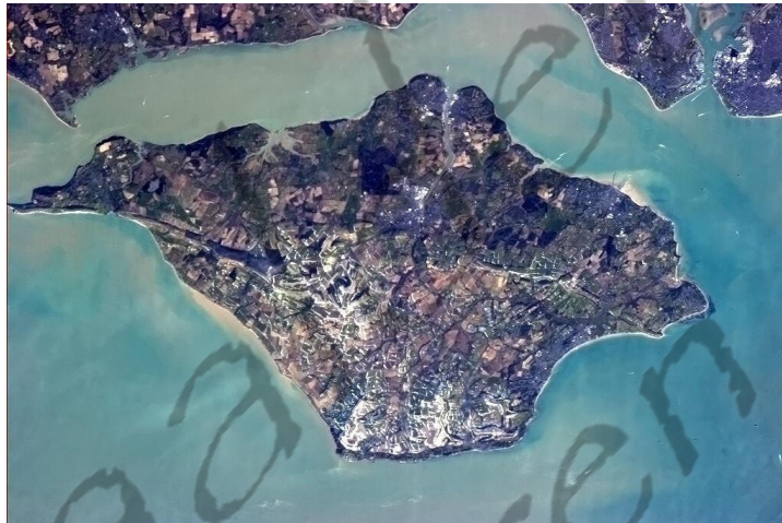
Het eiland Wight vanuit het ISS

Karel I werd overgebracht naar Oatlands Palace en vervolgens naar Hampton Court Palace. Onderhandelingen liepen op niets uit. Men probeerde hem over te halen naar het buitenland te vluchten of desnoods naar het eiland Wight.