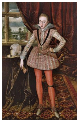
Hendrik Frederik Stuart

Karel I werd geboren in het paleis in het Schotse Dunfermline. Zijn vader was op dat moment koning van Schotland, maar nog niet van Engeland. De beoogde troonopvolger was zijn oudere broer Hendrik Frederik Stuart, de prins van Wales.