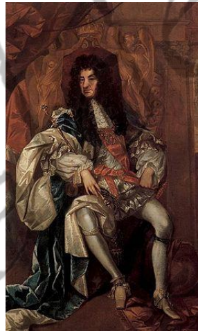
Karel II van Engeland

Aan deze situatie kwam een einde in 1660 toen met de troonsbestijging van Karels zoon als koning Karel II het koningschap werd hersteld.