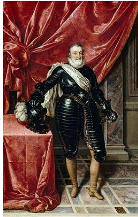
Hendrik IV van Frankrijk