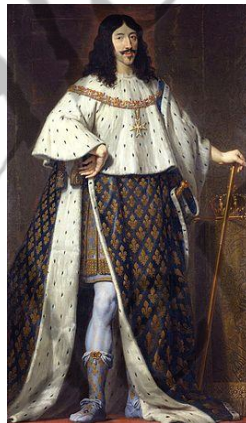
Lodewijk XIII van Frankrijk

In Karels tijd werd Europa voor een groot deel beheerst door vorsten die streefden naar absolute macht, zoals de Franse koning Lodewijk XIII.