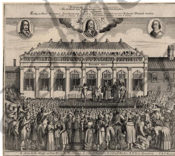
Hedendaagse prent van de onthoofding

Karel I werd onthoofd op 30 januari 1649. Tijdens de executie was er geen gejuich te horen, het verliep bijna in volledige stilte. Cromwell stond bij wijze van gebaar toe dat het hoofd werd teruggeplaatst op het lichaam, zodat de familie op gepaste wijze eer kon betuigen aan de ex-koning, die in Windsor Castle werd begraven.