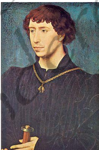
Karel de Stoute

Na vergeefs gepoogd te hebben een huwelijk te arrangeren tussen een van zijn zoons en Maria, dochter en erfgename van hertog Karel de Stoute van Bourgondië, liet Albrecht Achilles de regering van Brandenburg over aan Johan Cicero en keerde terug naar zijn Frankische bezittingen.