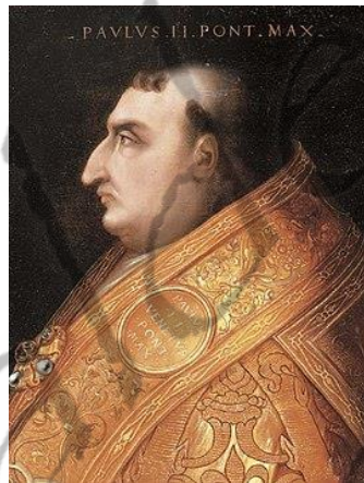
Paus Paulus II

Na de dood van zijn broer Johan in 1464 erfde Albrecht Achilles Bayreuth en na het aftreden van zijn andere broer Frederik II werd hij markgraaf van Brandenburg.