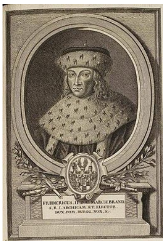
Frederik II van Brandenburg

Hij was al snel actief betrokken met het bestuur ervan en door het Verdrag van Prenzlau kreeg hij ook Pommeren in bezit. In 1473 deed Albrecht een wet over de erfopvolging uitgaan, de Dispositio Achillea. Daarin bepaalde hij dat niet meer dan drie Hohenzollerns tegelijk mochten regeren. De Frankische gebieden Ansbach en Bayreuth werden in twee markgraafschappen onder zijn zoons Frederik en Siegmund. De mark Brandenburg verklaarde hij voor ondeelbaar en de heerschappij daarover zou in zijn geheel overgaan op zijn oudste zoon Johan Cicero, hoewel hij nog veel meer kinderen had.