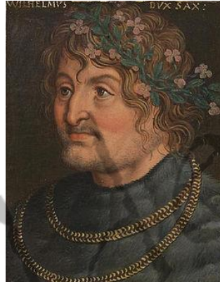
Willem III van Saksen

Zij maakte via haar moeder, een kleindochter van keizer Sigismund, aanspraak op de troon van Hongarije en Bohemen, maar Albrecht Achilles' poging deze tronen op zijn familie te doen overgaan mislukte. Zijn andere wens, hertog van Franken worden, ging ook niet in vervulling. Zijn voornaamste politieke doel was het vermeerderen van zijn bezit in Franken geweest, dat werd bekneld door eigendommen van de bisdommen Würzburg, Bamberg en Eichstät en de rijksstad Neurenberg, te vergroten zodat het te vergelijken zou zijn met het Beierse bezit van de Wittelsbachers. Uiteindelijk kwam er niets van terecht.