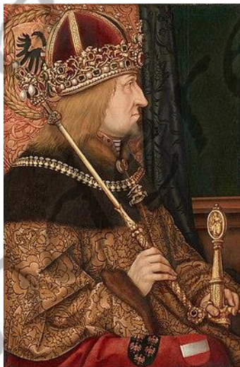
Keizer Frederik III

Albrecht Achilles steunde keizer Frederik III in zijn strijd tegen vorsten die in Duitsland hervormingen wensten en ontving in ruil hiervoor vele gunsten en rechten, tot grote irritatie van zijn buurlanden.