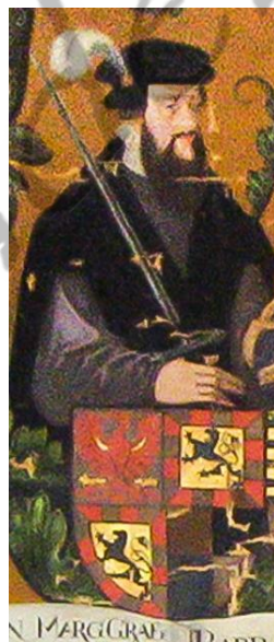
Johan van Brandenburg-Kulmbach

Na de dood van zijn broer Johan in 1464 erfde Albrecht Achilles Bayreuth en na het aftreden van zijn andere broer Frederik II werd hij markgraaf van Brandenburg.