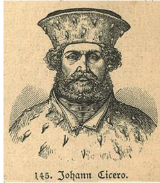
Johann Cicero van Brandenburg