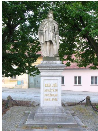
George van Podiebrad - standbeeld in Kunštát (Tsjechië).

Hij ging een alliantie aan met zijn voormalige vijand, de Hussiet George van Podiebrad. Paus Paulus II excommuniceerde hem hiervoor.