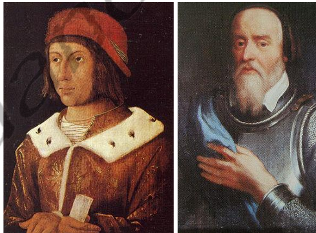
Frederik I van de Palts en Lodewijk IX van Beieren

De hervormingstwisten resulteerden in 1460 in een openlijke oorlog, de Zuid-Duitse Vorstenoorlog, en Albrecht zag tegenover zich een liga onder leiding van paltsgraaf Frederik I en hertog Lodewijk IX van Beieren.