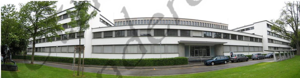
Gebouw van de Schweizerische Nationalbibliothek in 2008

Zijn initiatief ging uit voor de bouw van het Schweizerische Landesmuseum en de Schweizerische Landesbibliothek.