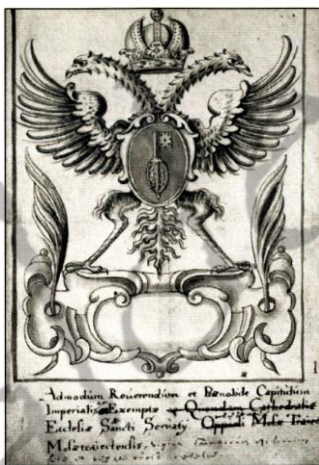
Kapittelwapen met sleutel van Sint-Servaas en dubbelkoppige adelaar (18e-eeuwse prent)