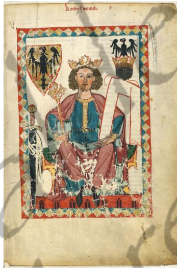
Keizer Hendrik VI

Ten tijde van zijn benoeming tot bisschop van Utrecht in 1197, verbleef hij aan het hof van keizer Hendrik VI in Palermo.