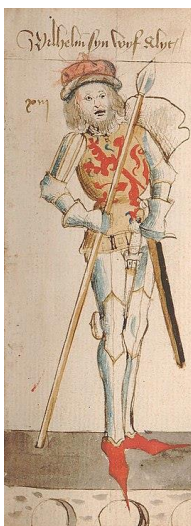
Willem I van Holland

Dirk sloot een ruilvereenkomst met het graafschap Holland, waardoor al zijn ministerialen en serveis die op Hollands grondgebied woonden aan Holland werden geschonken en alle ministerialen en serveis van de graaf van Holland die op Stichts grondgebied woonden aan de bisschop kwamen.