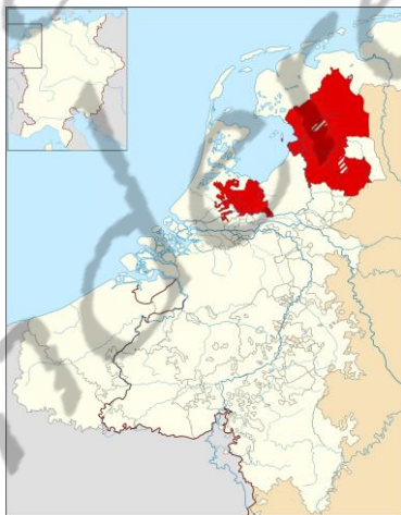
Het Sticht Utrecht omstreeks 1350

Dirk van Are stamde uit de Duitse adellijke familie Van Are Hochstaden. Hij was een neef van Lotharius van Hochstaden, die vóór hem onder andere proost in Maastricht en Deventer geweest was.