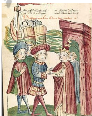
Otto IV en Paus Innocentius III reiken elkaar de hand. Uit de werkplaats van Diebold Lauber, 15e eeuw.

Ridders waren van de overeenkomst uitgesloten en bleven verbonden aan hun oorspronkelijke dienstheer. In de opvolgingsstrijd in Duitsland werd hij door de paus gedwongen tot steun aan Otto IV.