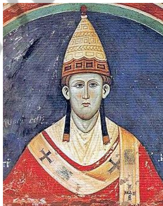
Paus Innocentius III

Omdat het bisdom Utrecht grote schulden had bij Romeinse bankiers, werd hij in 1204 door paus Innocentius III aangespoord deel te nemen aan de Loonse opvolgingsstrijd aan de zijde van Lodewijk II van Loon tegen Willem I van Holland, in de hoop dat dit geldelijke middelen zou opleveren.