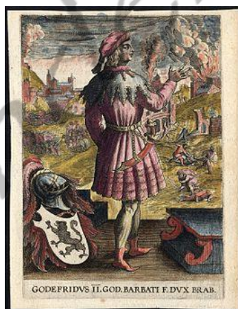
Godfried II van Leuven

Godfried volgde zijn vader Godfried II van Leuven op zeer jonge leeftijd op (vanwaar de bijnaam Dux in cunis, "de hertog in de wieg"), onder regentschap van zijn moeder Lutgardis van Sulzbach.