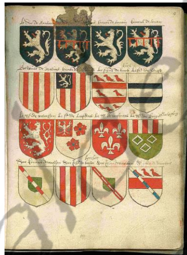
Wapenschild van Godfried van Brabant op het Wapenboek Beyeren

Na zijn dood trad zijn weduwe Imagina in het klooster. Zij werd nog vóór 1203 abdis van de abdij van Munsterbilzen.