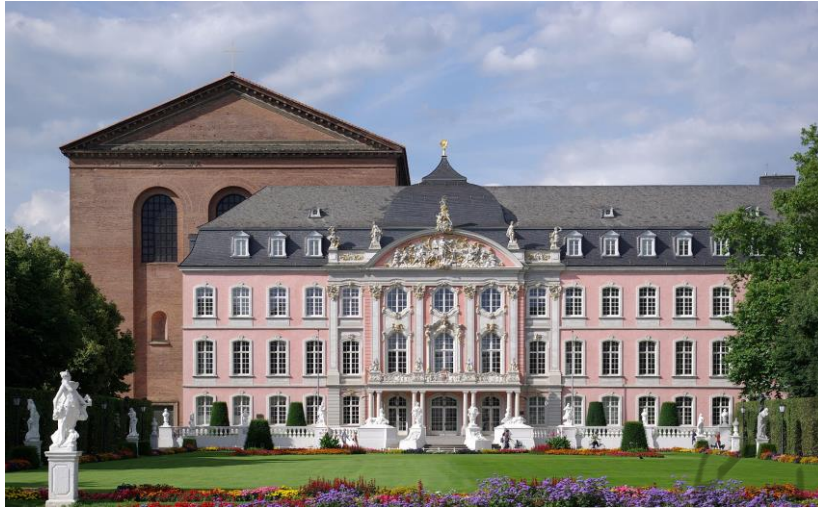
Kiespaleis in Trier , gedeeltelijk gebouwd door Johann Philipp von Walderdorff