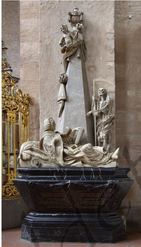
Grafmonument van Johann Philipp von Walderdorff in de kathedraal van Trier