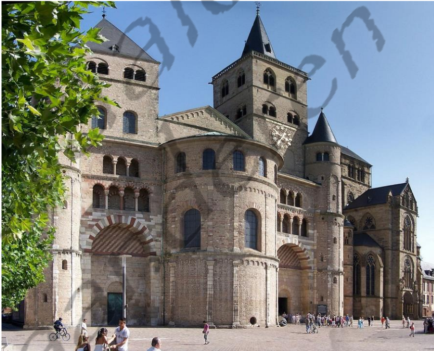
Kathedraal van Trier