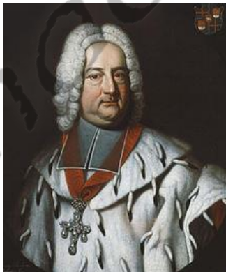
Franz Georg von Schönborn

Johann Philipp werd geboren in kasteel Molsberg bij Montabaur als zoon van de keizerlijke kolonel, keizerlijke baron Carl Lothar von Walderdorff zu Molsberg en Isenberg († 1722) en zijn vrouw Anna Katharina Elisabeth Freiin von Kesselstatt († 1733). Hij werd de algemene vicaris van het Aartsbisdom Trier en in 1742 werd hij gouverneur. Met Franse steun werd hij in 1754 gepromoveerd tot coadjutor en aangewezen opvolger van aartsbisschop-keurvorst Franz Georg von Schönborn-Buchheim .