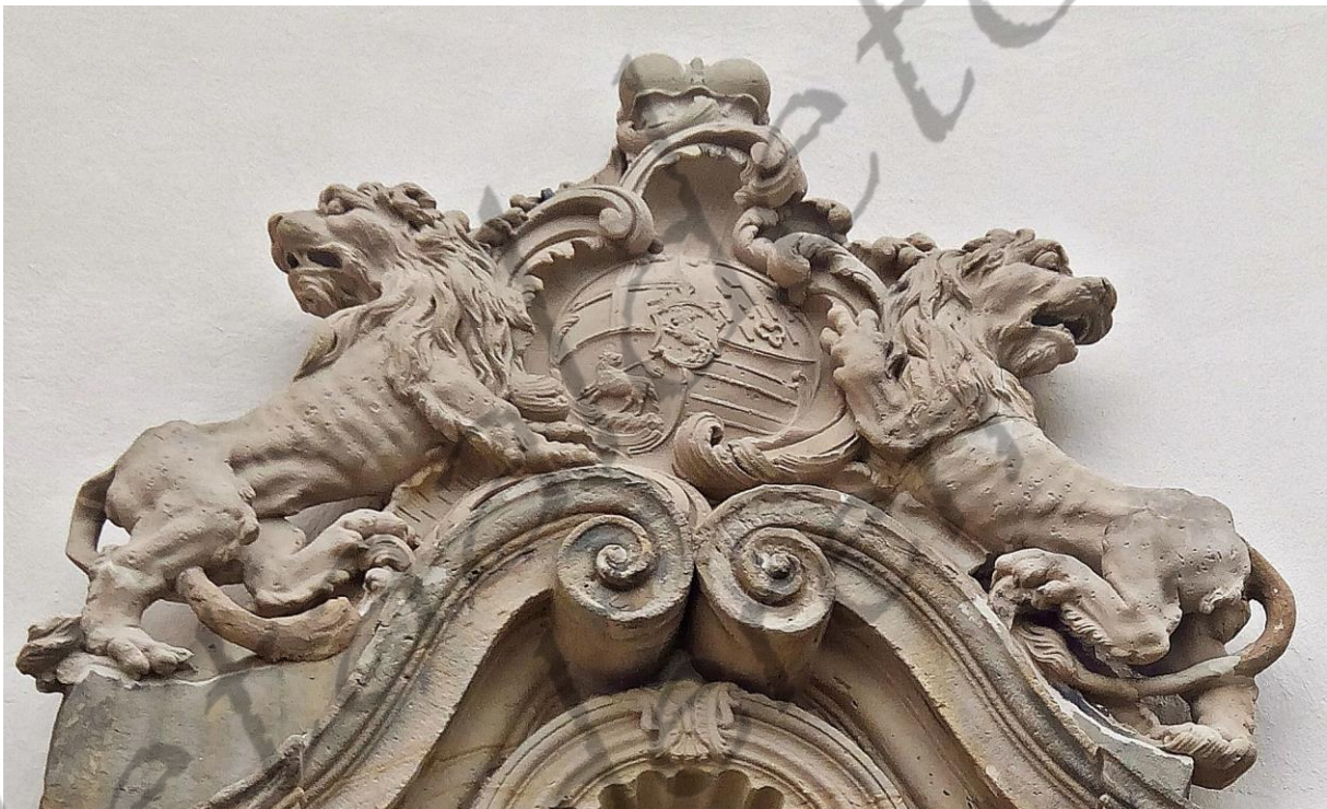
Wapenschild van de bisschop op de kerk van St. Cyriakus (Frankenthal-Eppstein)