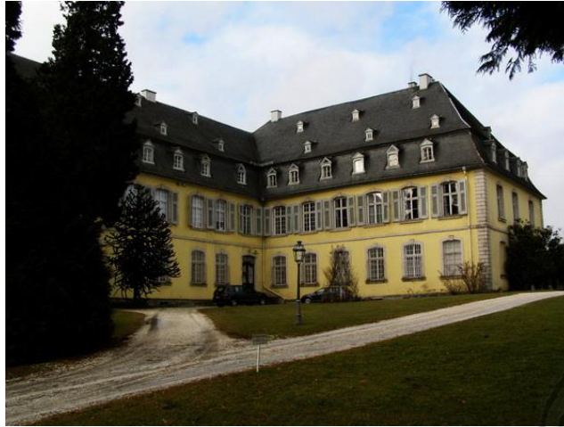
familiekasteel Molsberg in Westerwald