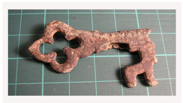
Sleutel 14/15e eeuw Calvus