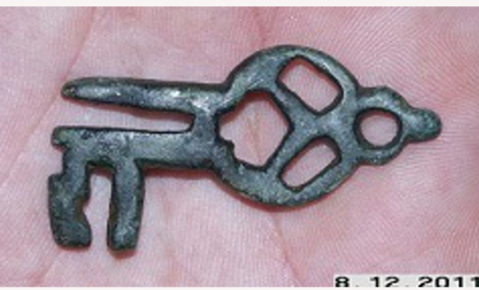
Sleutel 9/10e eeuw Trac