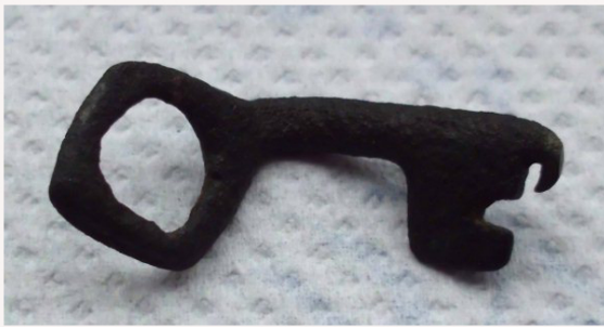
Sleutel 15e eeuw Tejen