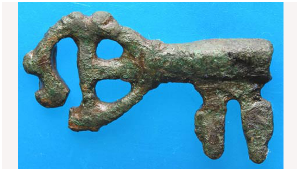
Sleutel 12/13e eeuw Stingray