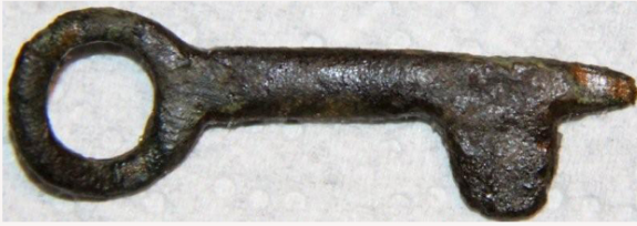
Sleutel 11 – 15e eeuw Edd