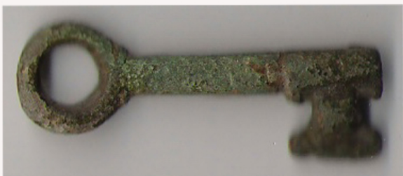
Sleutel 13 – 15e eeuw Christophe