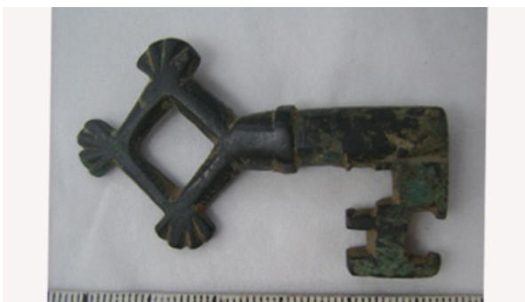
Sleutel 15e eeuw Hadrianus