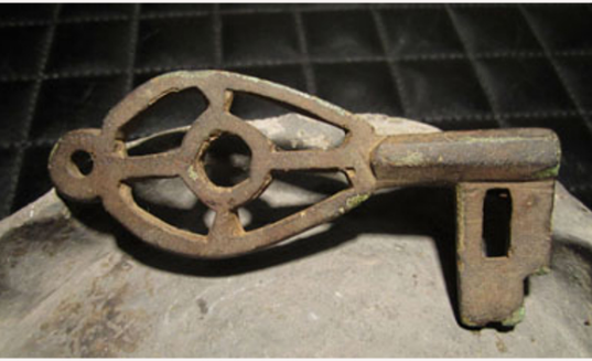
Sleutel 10e eeuw Geveressen