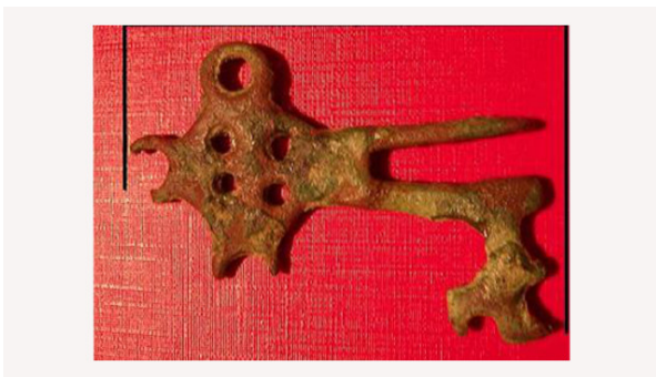
Sleutel 14/15e eeuw Benjamino