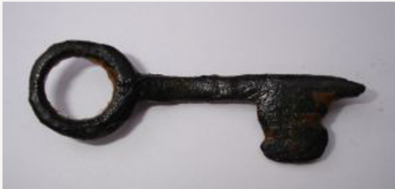
Sleutel 15e eeuw Johan Dils