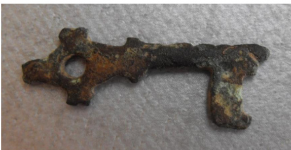
Sleutel 12e eeuw Kristof2