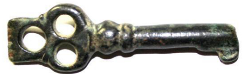
Sleutel 14/15e eeuw Abmit