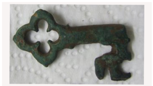
Sleutel 14/15e eeuw Dax Jr.B