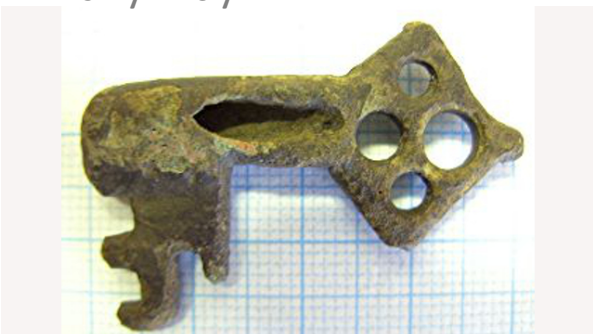
Sleutel 13e eeuw Zizi