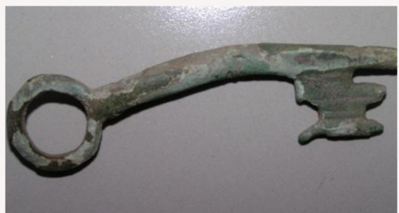
Sleutel 13e eeuw Dagobert Duck