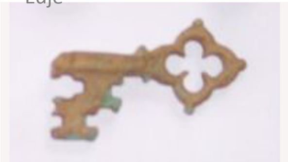
Sleutel 8 – 9e eeuw Dany mdy