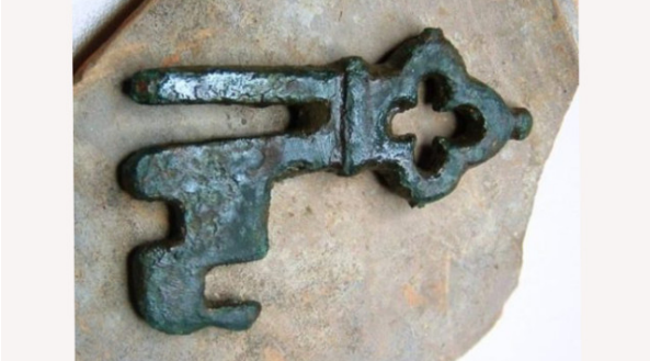
Sleutel vroeg 15e eeuw Edje