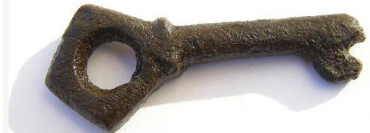
Sleutel 14e eeuw Appie