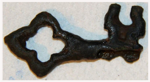
Sleutel 13/14e eeuw Edd