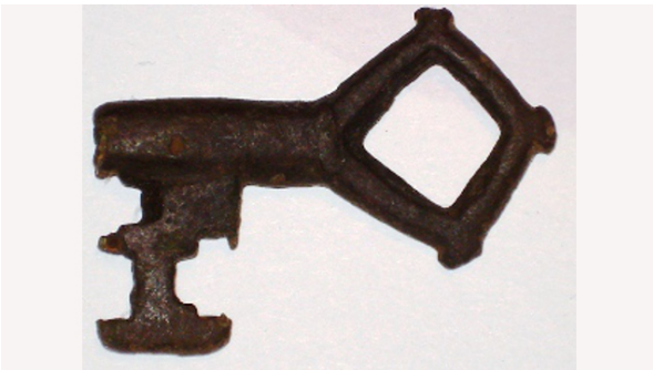
Sleutel 10 – 12e eeuw Wiking