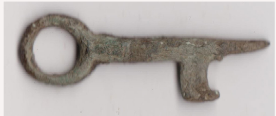
Sleutel 13e eeuw Rakker