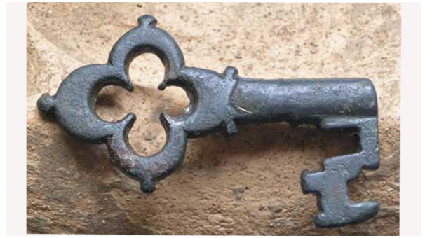
Sleutel 15e eeuw Jacce