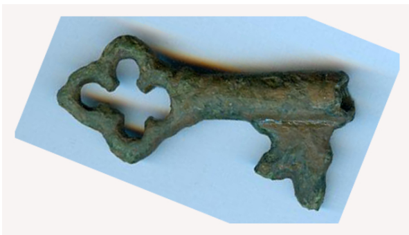
Sleutel 13e eeuw Kurt