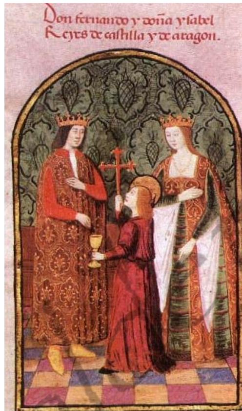
Ferdinand en Isabella

De Katholieke Koningen is de benaming die in de Nederlandstalige literatuur vaak wordt gebruikt voor het echtpaar Ferdinand II van Aragon (1452-1516) en Isabella I van Castilië (1451-1504). Het is een letterlijke vertaling van het Spaanse Los Reyes Católicos. Een juistere Nederlandse formulering zou zijn De katholieke koning en koningin of Het katholieke koningspaar. De titel werd hen toegekend door paus Alexander VI, als gevolg van de voltooiing van de Reconquista in 1492, en omwille van hun inzet om het katholieke geloof als het ene ware geloof te handhaven in hun rijk.