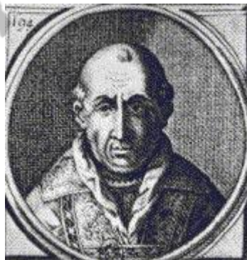
Paus Clemens V

De opvolger van Benedictus XI, Clemens V, die bisschop van Bordeaux was geweest, verhuisde in 1309 de apostolische stoel van Rome naar Avignon.