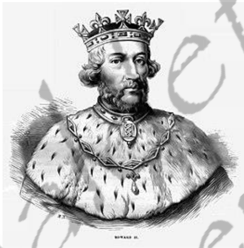
Eduard II van Engeland

Engeland verbond zich met Vlaanderen door de Engelse kroonprins Eduard II van Engeland met Filippa, de dochter van de Vlaamse graaf Gwijde van Dampierre, te laten verloven.