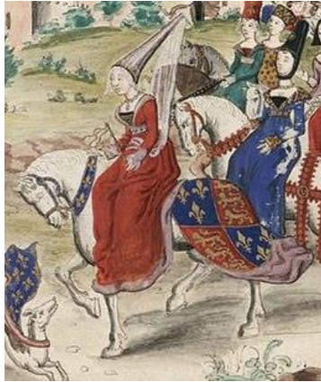
Isabella koningin van Engeland bij haar inhuldiging in Frankrijk (1308)