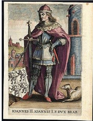
Jan II hertog van Brabant

Eduard I probeerde in de zomer van 1295 de nieuwe hertog van Brabant, Jan II, aan zijn zijde te trekken door de wolstapel van Dordrecht naar het Brabantse Mechelen te verhuizen.