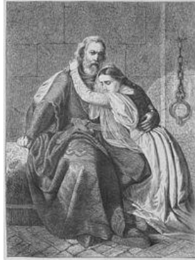
fantasieportret van Gwijde en Fillipa van Vlaanderen in gevangenschap 1294-95.