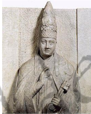
Paus Bonifatius VIII

In 1295 bezette de Franse koning het gebied.