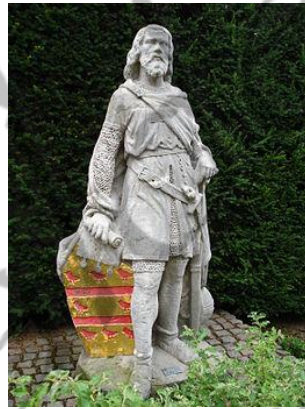
Jan I van Cuijk

Bij het uitbreken van de Frans-Engelse oorlog in 1294 stond Floris nog aan de kant van Eduard I. Er waren zelfs huwelijksverdragen met beider kinderen gesloten. Floris streed wel met Vlaanderen om het bezit van Zeeland en de Westerschelde, Vergezeld door zijn grafelijke raad (onder meer Dirk II van Brederode, Jan van Renesse), maar zonder Gijsbrecht IV van Amstel en Herman VI van Woerden, reisde Floris V naar Parijs om leenman van de Franse koning te worden. Hij zou jaarlijks 4000 pond en eenmalig 25000 pond kleine Tournoois ontvangen. Hij beloofde de medestanders van de Engelse koning te beoorlogeren en vijanden van de Franse koning uit zijn landen te weren. Floris maakte een grote ommezwaai door voor de Franse zijde te kiezen en vervreemde zich van de Engels-gezinde edelen in zijn landen. De Engelse koning gaf Jan I van Cuijk een centrale rol om een bondgenootschap te vormen van oude tegenstanders van de graaf om hem naar Engeland te ontvoeren en aan zijn zoon Jan I, die zijn opvoeding aan het Engelse hof genoot en met de koningsdochter, Elisabeth van Engeland, zou trouwen, de grafelijke macht over te dragen.