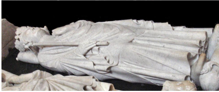
Tombe van Filips IV

Filips werd opgevolgd door zijn zoon Lodewijk X. Filips regering was het begin van het verval van de pauselijke almacht in de Europese politiek en een mijlpaal in de versterking van de macht van de Franse koning en in de centralisering van de Franse staat.