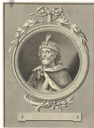
Floris V van Holland

Filips stuurde Robert II van Artesië op graaf Floris V van Holland af, om hem over te halen tot een Frans bondgenootschap. Op 9 januari 1296 bezegelde Floris het verdrag in Parijs, waarmee hij de Franse koning tegen de Engelse koning zou steunen.