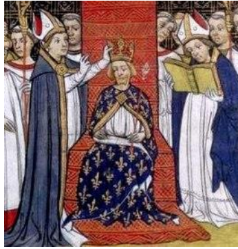
Filips III van Frankrijk