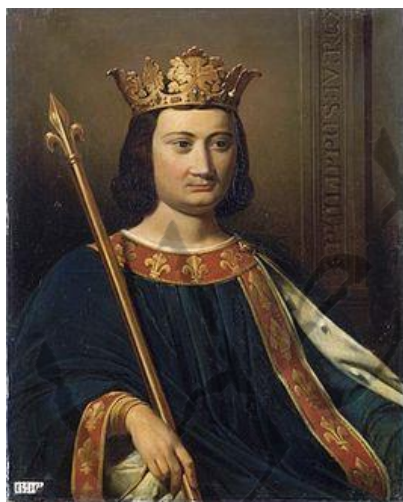
Koning van Frankrijk

Filips IV van Frankrijk, bijgenaamd de Schone (Frans: Philippe le Bel), was koning van Frankrijk van 1285 tot 1314. Hij was de machtigste vorst van zijn tijd. Zijn politiek was erop gericht om het gezag van het Franse koningshuis te versterken. Hij vocht oorlogen uit met koning Eduard I van Engeland en het graafschap Vlaanderen, en wilde de macht van de Kerk en de hoge edelen breken.