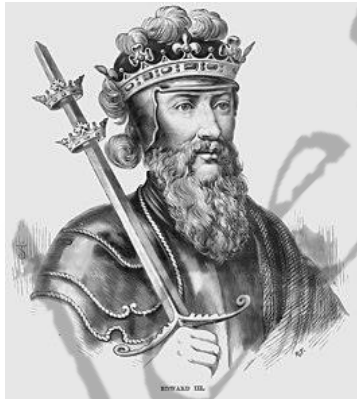
Eduard III van Engeland