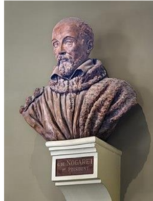
Buste van Guillaume de Nogaret in het Capitool in Toulouse.

Hij wilde de paus afzetten, waarna die op zijn beurt Filips in de ban deed. Guillaume de Nogaret, een adviseur van de Franse koning, trok naar Italië met een leger van circa 2000 man, vergezeld van Sciarra Colonna, een Italiaanse senator van een anti-pausgezinde familie.