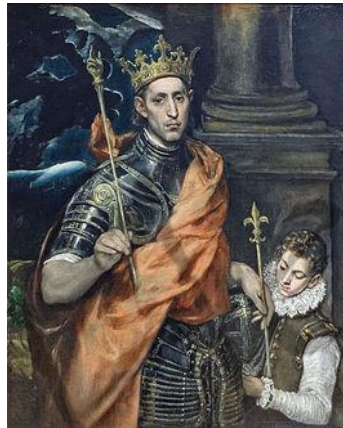
Lodewijk IX van Frankrijk