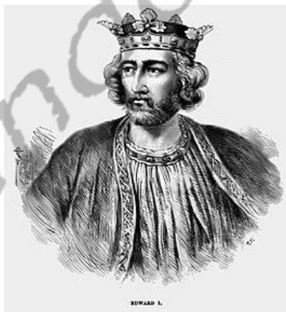
Eduard I van Engeland

Filips was de zoon van Filips III en kleinzoon van Lodewijk IX de Heilige. Hij trouwde in 1284 met Johanna I van Navarra en kreeg zeven kinderen. Hij werd de vader van drie opeenvolgende Franse koningen.