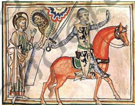
Gwijde van Dampierre op zijn paard.

Om het huwelijk te voorkomen, werden Gwijde, Eduard en Filippa gevangen genomen in hetzelfde jaar door Filips. Filippa stierf in 1306 in gevangenschap. Gwijde en Eduard kwamen in 1295 na bemiddeling van onder andere Paus Bonifatius VIII vrij.