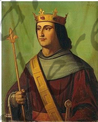
Filips VI van Frankrijk