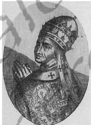
Paus Benedictus XI

Zij bedreigden de 68-jarige paus in zijn eigen paleis in Anagni met de dood. De paus werd naar verluidt door Colonna in zijn gezicht geslagen, maar dit is vermoedelijk niet historisch. De paus kwam echter al gauw weer vrij omdat de Fransen verdreven werden door de plaatselijke bevolking, maar hij overleefde het incident slechts een maand. Zijn opvolger paus Benedictus XI verzoende zich met de Franse koning en annuleerde alle sancties.