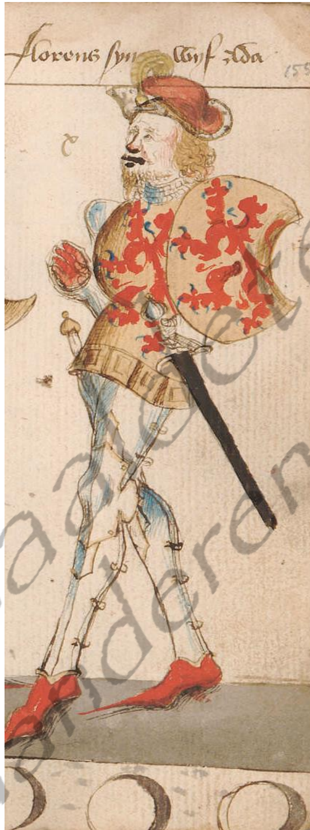
Floris III van Holland