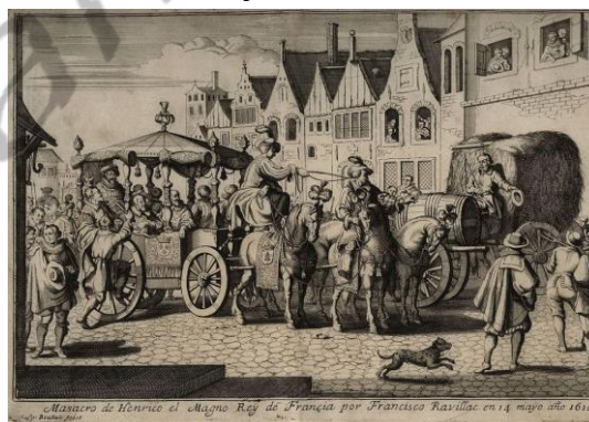
De moord op Hendrik IV