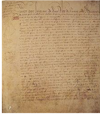
Het opgetekende Edict van Nantes

Hendrik IV staat bekend als een kundige koning, in Frankrijk wordt hij 'Hendrik de Grote' en "le bon roi Henri" genoemd. Zijn Sûrintendant des Finances, de hertog van Sully, hervormde het belastingsysteem en bestreed corruptie. Ook werden nieuwe belastingen ingevoerd.