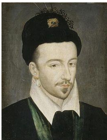
Hendrik III van Frankrijk

Bij het accepteren van de troon vond hij het verstandig om zijn calvinistisch geloof af te zweren. Toch werd zijn kroning gevolgd door een vier jaar lange oorlog tegen de Ligue om zijn legitimiteit te vestigen.