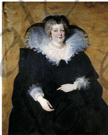
Maria de' Medici

Deze was toen acht jaar oud en zijn moeder Maria de' Medici trad tot 1617 op als regentes.