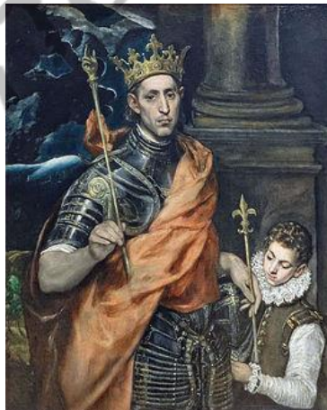
Lodewijk IX van Frankrijk

Als Franse prins van den bloede door zijn afstamming van Lodewijk IX van Frankrijk, besteeg hij de troon van Frankrijk in 1589 na de dood van zijn kinderloze neef Hendrik III.