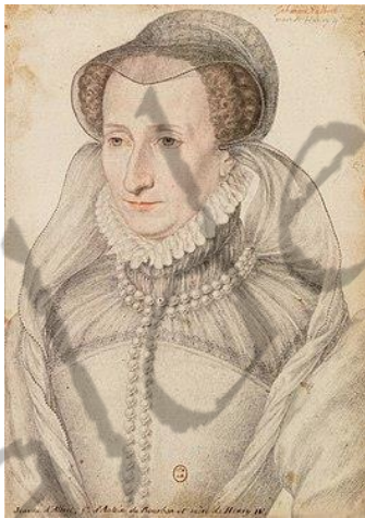
Johanna van Albret

Hendrik werd katholiek gedoopt, maar bekeerde zich tot het protestantisme samen met zijn moeder Johanna van Albret, koningin van Navarra. Hij erfde de troon van Navarra in 1572 toen zijn moeder stierf. Als een hugenoot was hij betrokken bij de Hugenotenoorlogen; hij kon maar net ontsnappen aan een moordaanslag ten tijde van de Bartholomeusnacht en leidde later de protestantse troepen tegen het koninklijk leger.