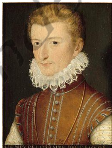
Hendrik I van Guise

Hendrik III had geen kinderen en volgens de geldende Salische Wet kon het koningschap niet over de vrouwelijke lijn overgeërfd worden. Het huis Valois stond daarom op uitsterven en volgens de regels van erfopvolging was Hendrik van Navarra, als afstammeling van de 13e-eeuwse koning Lodewijk IX, de troonopvolger. De rooms-katholieken weigerden hem te erkennen op grond van zijn protestantse geloof. De hierop volgende periode staat bekend als de 'Drie-Hendriken-oorlog' (1587-1589) naar de drie belangrijkste spelers in deze periode: koning Hendrik III van Frankrijk, Hendrik van Navarra als leider van de hugenoten en Hendrik I van Guise als leider van de radicale rooms-katholieken.