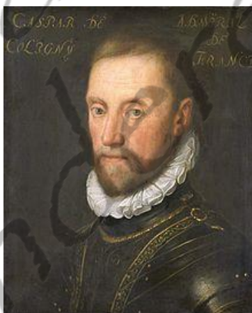
Gaspard de Coligny

Als bezegeling van de vrede die in 1570 in deze oorlog bereikt was, trouwde Hendrik op 18 augustus 1572 met katholieke Marguerite de Valois, de zuster van koning Karel IX. Enkele dagen later, op 24 augustus, werd een aantal hugenotenleiders, onder wie admiraal Gaspard de Coligny, vermoord door radicale katholieken.