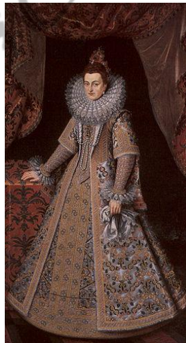
Isabella van Spanje

Hij ging zo ver zijn dochter Isabella van Spanje, die een Franse moeder had, als pretendent van de Franse troon naar voren te schuiven, maar dat wakkerde slechts de anti-Spaanse sentimenten aan.