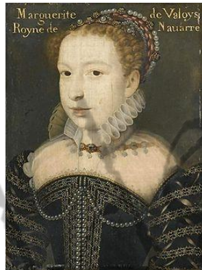
Margaretha van Valois