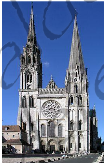
Kathedraal van Chartres

Tot 1593 duurde de strijd voort; slechts Hendriks (tweede) bekering tot het katholicisme bracht hem de eindoverwinning. Op 27 februari werd hij gekroond in de kathedraal van Chartres als koning van Frankrijk. "Parijs is wel een mis waard" ("Paris vaut bien une messe") zou hij volgens de overlevering opgemerkt hebben.