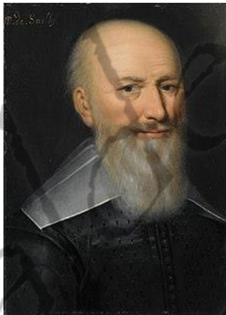
Maximilien de Béthune: hertog van Sully

Hendrik IV staat bekend als een kundige koning, in Frankrijk wordt hij 'Hendrik de Grote' en "le bon roi Henri" genoemd. Zijn Sûrintendant des Finances, de hertog van Sully, hervormde het belastingsysteem en bestreed corruptie. Ook werden nieuwe belastingen ingevoerd.