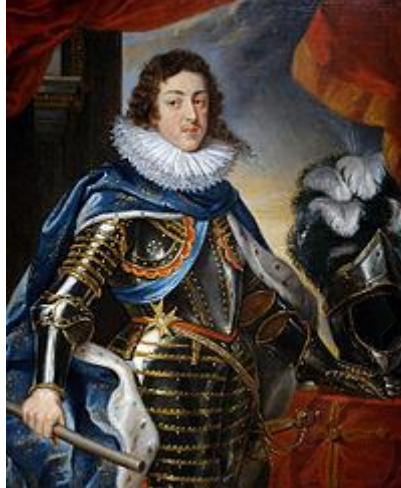
Een jonge Lodewijk XIII

Helemaal als een verrassing kwam de moord niet, want er waren van radicaal-katholieke zijde al vele moordaanslagen op hem gepleegd, onder andere in 1593, door Pierre Barrière en 1594, door Jean Châtel. Het Franse parlement had daarop de orde van de jezuiten verboden, maar Hendrik IV stond haar in 1603 toe zich weer in Frankrijk te vestigen. Hendrik IV werd opgevolgd door zijn zoon koning Lodewijk XIII.