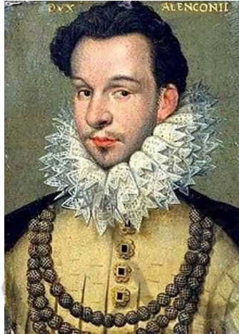
Frans van Anjou

In 1584 kreeg de strijd een belangrijke nieuwe wending. Hertog Frans van Anjou, de broer van Hendrik III, stierf.