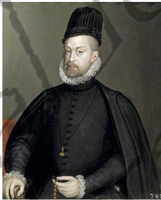
Filips II van Spanje

Uiteindelijk werd de koning in 1589 gedwongen zijn heil bij Hendrik van Navarra te zoeken, die openlijk verklaarde nog steeds de koning trouw te zijn en de rooms-katholieken volle godsdienstvrijheid te willen toekennen. Samen versloegen Hendrik III en Hendrik van Navarra de radicaal-katholieke legers en sloegen het beleg voor Parijs, waarvan de bevolking zwaar onder de honger te lijden kreeg, maar weigerde te capituleren voor de leider van de protestantse partij. Op 1 augustus dat jaar werd de koning bij een moordaanslag gedood. Hendrik van Navarra, die nu de beste rechten op de troon had, liet zich toen als Hendrik IV uitroepen tot koning van Frankrijk. Dit was reden voor de koning Filips II van Spanje zich in de strijd te mengen aan de zijde van de radicale rooms-katholieken.