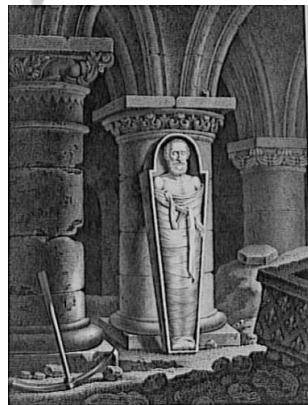
De geopende loden kist van Hendrik IV

Het lijk was in zo'n goede toestand dat men het enige tijd rechtop tegen een zuil in de benedenkapel zette.