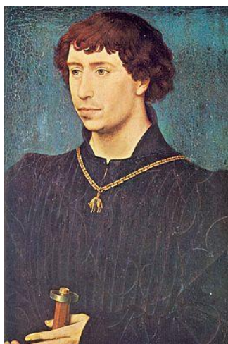
Karel de Stoute

Hij werd voor de geestelijke stand bestemd en was amper dertien toen hij in 1451 proost van het Sint-Donaaskapittel in Brugge werd, in opvolging van David van Bourgondië. Hij behield die functie tot in 1456.