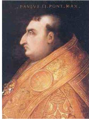
paus Paulus II

Er brak echter onmiddellijk weer revolte uit en weer trok de Bourgondische hertog ten strijde. Luik werd op 30 oktober 1468 grondig verwoest en het stedelijk symbool, het 'Perron' werd naar Brugge gevoerd. Ten koste van deze hoge prijs heroverde Lodewijk zijn zetel.