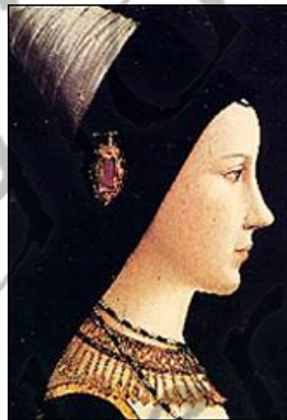
Maria van Bourgondië

In 1477 zag het er, nadat Karel de Stoute was gesneuveld, weer niet gunstig uit voor Lodewijk. Hij slaagde er nochtans in zich te handhaven en de ondersteuning te verkrijgen van Maria van Bourgondië en Maximiliaan van Oostenrijk.