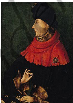
Jan zonder Vrees

Lodewijk was een kleinzoon van Jan zonder Vrees, een zoon van Karel I van Bourbon en Agnes van Bourgondië, een neef van Filips de Goede, hertog van Bourgondië en een zwager van Karel de Stoute.