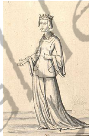
Agnes van Bourgondië