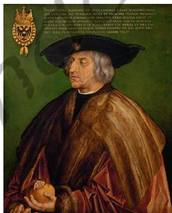
Maximiliaan van Oostenrijk

De nieuwe voorman van de oppositie werd Willem van der Marck, 'le sanglier des Ardennes', die er in 1482 in slaagde Luik in te nemen, de bisschop te vermoorden en zijn eigen zoon Jan van der Marck kortstondig op de bisschopstroon te plaatsen.