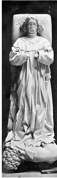
Graftombe van Karel I van Bourbon.