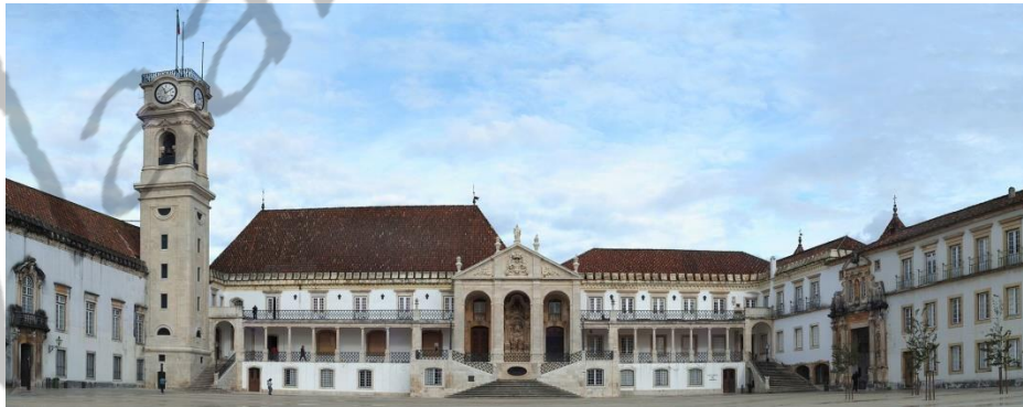
Universiteit van Coimbra

Dionysius stichtte de Universiteit van Coimbra en schreef zelf boeken over administratie, jacht, wetenschap en ook poëzie, waaraan hij zijn bijnaam de Poëet te danken heeft.