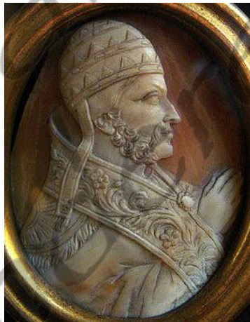
Paus Nicolaas III

Dionysius probeerde een oplossing te vinden voor de conflicten tussen de geestelijke en de wereldlijke macht door een verdrag met paus Nicolaas III (1277-1280).