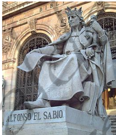
Standbeeld van Alfons X van Castilië in Madrid

Vanaf 1279 tot aan 1297 was Dionysius in oorlog verwickeld met Castilië. Zijn jongere broer, Alfons, koos voor een bondgenootschap met Alfons X van Castilië, terwijl Dionysius een verbond sloot met diens tegenstander Sancho IV van Castilië.