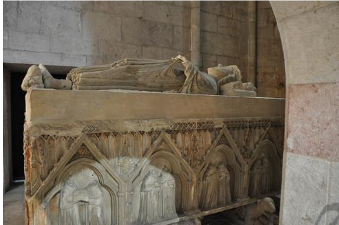
Tombe van Dom Dinis I