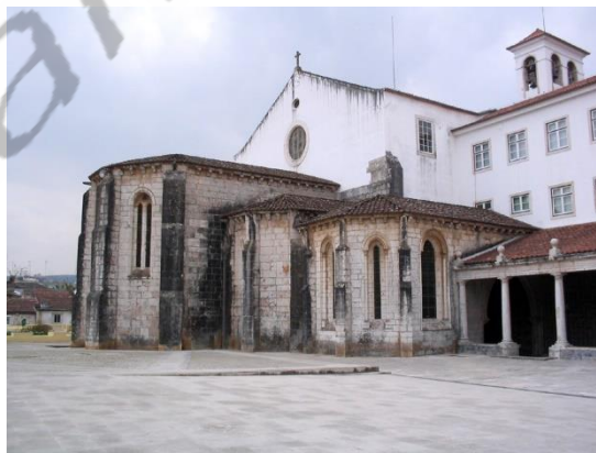
Overblijfselen van het middeleeuwse klooster van Saint Denis in Odivelas

Koning Dionysius of Dinis I overleed op 7 januari 1325 in Santarém en werd begraven in het klooster van Saint Denis in Odivelas, in de buurt van Lissabon.