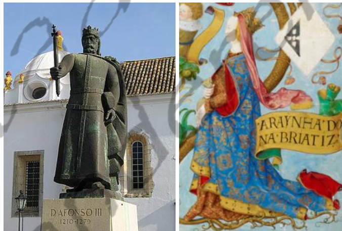
Alfons III van Portugal en Beatrix van Castilië

Dionysius was de oudste zoon van koning Alfons III van Portugal en diens vrouw Beatrix van Castilië. Hij werd vanaf zijn jeugd door zijn vader betrokken bij regeringszaken om hem zo voor te bereiden op de troonopvolging.