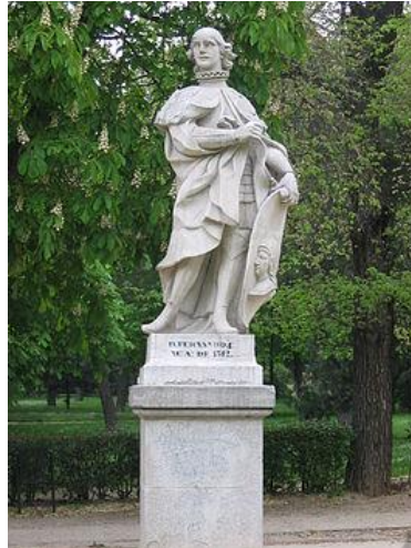
Ferdinand IV van Castilië

De grens zoals die destijds volgens dit verdrag is vastgesteld vormt nog steeds de huidige grenslijn tussen Spanje en Portugal. Om het nieuwe verbond tussen de twee koninkrijken te bevestigen huwelijkte Dionysius zijn dochter Constance uit aan Ferdinand IV, terwijl zoon Alfons IV met Beatrix van Castilië trouwde.