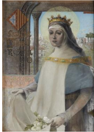
Elisabeth van Portugal

Vanaf 1279 tot aan 1297 was Dionysius in oorlog verwickeld met Castilië. Zijn jongere broer, Alfons, koos voor een bondgenootschap met Alfons X van Castilië, terwijl Dionysius een verbond sloot met diens tegenstander Sancho IV van Castilië.