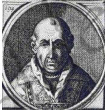
Paus Clemens V

Onder Dionysius vond een belangrijke ontwikkeling plaats in het civiele recht, het strafrecht en de administratie van het land. De koning reisde door het land, liet kastelen en steden bouwen en probeerde een machtsevenwicht tussen feodale adel en de opkomende burgerij van de steden te creëren. Er werden koper-, tin-, ijzer- en zilvermijnen gebouwd en het overschot van gewonnen grondstoffen vond een weg naar andere Europese landen. In 1308 werd een eerste Engels-Portugees handelsverdrag gesloten. De koning probeerde de landbouw te bevorderen, land werd herverkaveld en de koning gaf vergunningen af voor markten in steden.