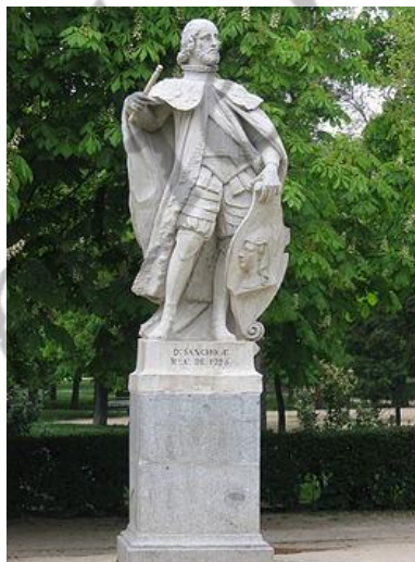
Sancho IV van Castilië

In 1297 werd ten slotte het Verdrag van Alcañices gesloten, tussen Dionysius en de nieuwe koning van Castilië, Ferdinand IV, (de oudste zoon van Sancho) waarbij de grens tussen Castilië en Portugal werd vastgesteld.