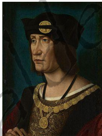
Lodewijk XII van Frankrijk

Frederik trachtte krachtig op te treden maar alle partijstrijd werd hem ten slotte te veel. Toen hij in 1514 van plan bleek te zijn zijn zetel af te staan aan een kandidaat van koning Lodewijk XII van Frankrijk, de ervijand van de Habsburgers, verloor hij het vertrouwen van keizer Karel V, die hem op 9 mei 1517 tot aftreden dwong.