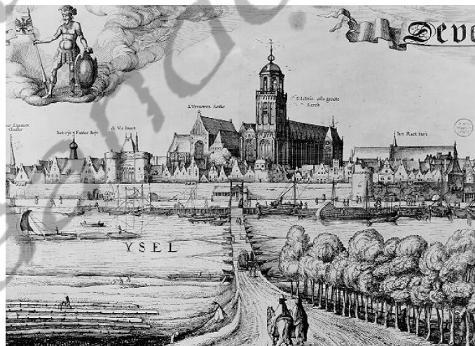
Lebuïnuskerk rond 1600