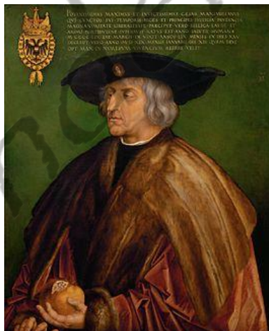
Keizer Maximiliaan I

Hij was domkanunnik in Keulen voordat hij onder zware druk van keizer Maximiliaan I tot bisschop van Utrecht gekozen werd.