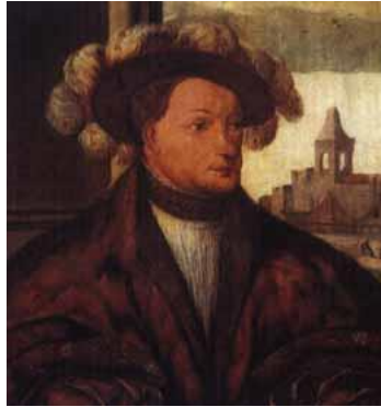
Karel van Gelre

Frederik trachtte krachtig op te treden maar alle partijstrijd werd hem ten slotte te veel. Toen hij in 1514 van plan bleek te zijn zijn zetel af te staan aan een kandidaat van koning Lodewijk XII van Frankrijk, de ervijand van de Habsburgers, verloor hij het vertrouwen van keizer Karel V, die hem op 9 mei 1517 tot aftreden dwong.