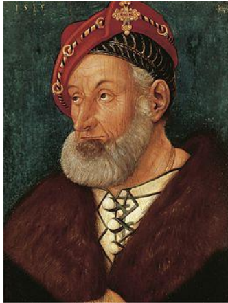
Christoffel I van Baden

Neef Jacobus werd kanunnik van de Dom van Utrecht, neef Christopher werd in 1499 door het domkapittel benoemd als chorepiscopus en kreeg in 1500 een prebende die in 1504 overging op weer een andere neef Rudolf.