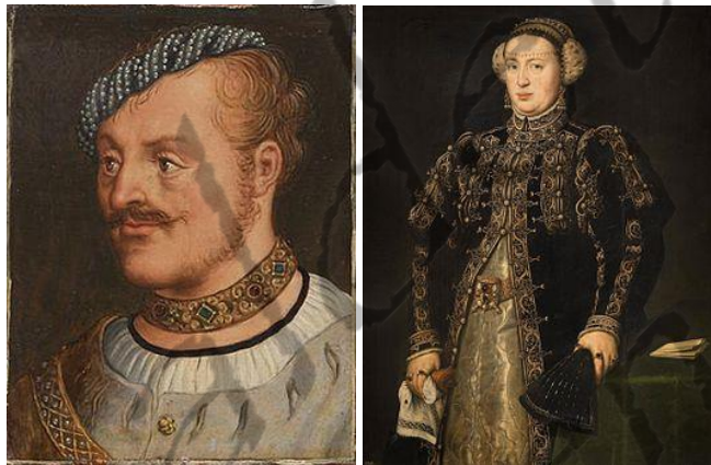
Karel I van Baden en Catharina van Habsburg

Frederik van Baden was de zoon van markgraaf Karel I van Baden en Catharina van Habsburg .