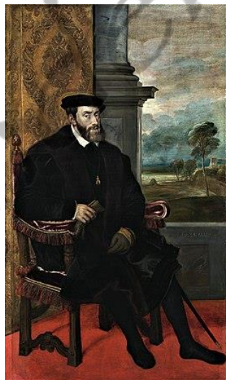
Keizer Karel V

Karel V wist vervolgens Filips van Bourgondië te laten benoemen.