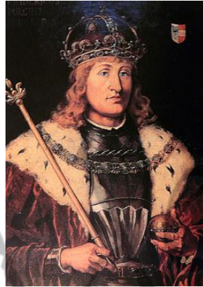
Frederik de Schone

Buitenlandse conflicten Vanaf 1312 was zijn aartsbisdom betrokken bij verschillende vetes tegen naburige gebieden. In de Rooms-Duitse troonstrijd tussen Frederik van Habsburg en Lodewijk IV van Beieren nam Lodewijk II, ondanks dat hij eigenlijk Frederik de Schone steunde, een afwachtende houding aan.