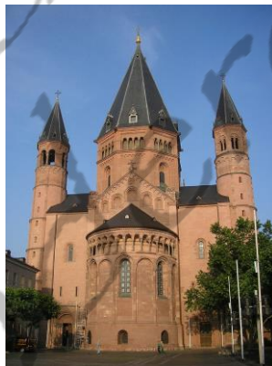
Dom van Mainz

In 1309 werd hij in opdracht van keizer Hendrik VII kanunnik in Münster en een jaar later volgde dankzij de bemoeienissen van zijn oom, graaf Otto van Kleef, zijn benoeming tot bisschop van Münster door paus Clemens V. Lodewijk werd zonder probleem erkend, zowel door de Landsstaten als door de bevolking van Münster.