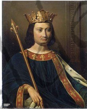
Filips IV van Frankrijk

Niet in het minst op aandringen van koning Filips IV van Frankrijk verkreeg Lodewijk vervolgens ook de functie van kanunnik van de Dom van Mainz.