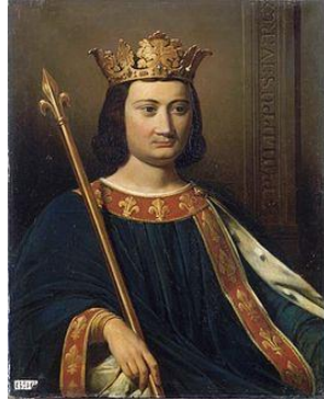
Filips IV van Frankrijk

Toen het bij de Guldensporenslag op 11 juli 1302 tot een confrontatie kwam tussen Gwijde en koning Filips IV van Frankrijk, was hij niet aanwezig met zijn strijdmacht.