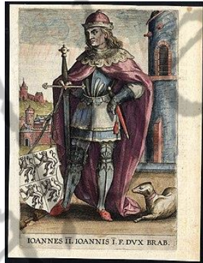
Jan II van Brabant

Zoals zovele anderen geloofde hij waarschijnlijk niet in de overwinning en maakte hij een omweg en bracht een bezoek aan Jan II, hertog van Brabant.