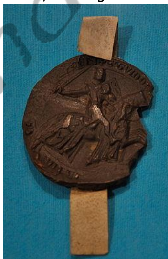
Ruiterzegel van Gwijde van Dampierre in het museum Kortrijk 1302