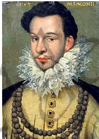
Hertog van Alençon

Frans Hercules (of François-Hercule) van Valois, hertog van Anjou, was de jongste zoon van koning Hendrik II van Frankrijk en Catharina de' Medici. Hij was de jongere broer van de Franse koningen Frans II, Karel IX en Hendrik III en groeide als katholiek op tijdens de escalerende Hugenotenoorlogen waarin Spanje en Engeland zich nog zouden mengen. Bij zijn geboorte kreeg hij de titel hertog van Alençon, maar bij de troonsbestijging van zijn broer Hendrik in 1575 nam hij diens oorspronkelijke titel hertog van Anjou over en werd beoogd erfgenaam van de Franse troon. Het gegeven dat hij de kroonprins was van de grootste mogendheid in Europa die tegenwicht kon bieden aan Spanje, zou zijn verdere leven bepalen.