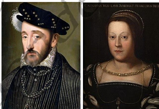
Hendrik II van Frankrijk en Catharina de' Medici