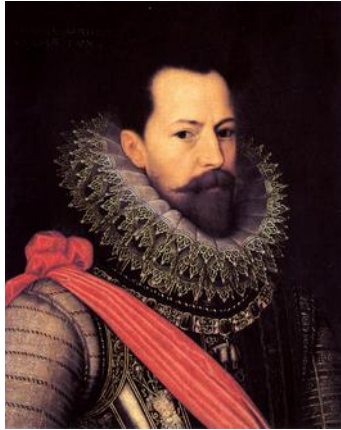
hertog van Parma: Alexander Farnese

De gefrustreerde Anjou beraamde een samenzwering en trachtte met een coup de macht te grijpen in Vlaanderen en Brabant. In januari 1583 werden Duinkerke, Aalst en enkele andere steden in Vlaanderen en Brabant voorzien van een Frans garnizoen. De grootste Nederlandse stad, Antwerpen, wilde hij bij verrassing innemen, met een glorieuze intocht nog wel. De inwoners, met de Spaanse Furie van 1576 nog vers in het geheugen, hadden echter niet veel op met buitenlandse troepen. Ze vreesden een "Franse furie". De 1500 man sterke strijdmacht werd in een hinderlaag gelokt en grotendeels afgeslacht. De positie van Anjou was nu onhoudbaar geworden en ook Oranje kreeg felle kritiek te verduren. Hij was het immers die de Fransman had binnengehaald en zelfs toen nog aandrang op verzoening. Maar zowel Anjou als de Brabanders hadden er genoeg van, en de hertog verliet de Nederlanden in juni 1583. Toen hij op 10 juni 1584 (een maand voor Willem van Oranje) overleed in het Château-Thierry aan tuberculose, was het afgelopen met de Franse steun voor de opstand. Een poging dat jaar om de soevereiniteit aan te bieden aan Anjou's broer, koning Hendrik III van Frankrijk, liep op niets uit.