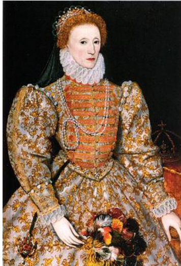
Elizabeth I van Engeland

Zij mocht hem wel, maar hij was 22 jaar jonger dan zij en bovendien katholiek, wat niet goed viel bij het Engelse volk. Het was bovendien algemeen bekend dat zijn moeder Catharina een hoofdverantwoordelijke was geweest voor de beruchte Bartholomeusnacht in 1572, een dieptepunt in de godsdiensttwisten op het continent waarvan de Engelsen nu juist verschoond wilden blijven. Catharina werd daarom uitgemaakt voor de 'Izebel van deze tijd'. De verloving leverde hem wel de bijnaam 'mijn kikkertje' op, en zelfs een door Elizabeth persoonlijk geschreven gedicht "On Monsieur's Departure" maar deze verloving liep, zoals alle andere verlovingen met deze koningin, op niets uit.