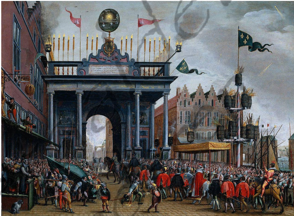
Blijde Inkomst van hertog Frans van Anjou in Antwerpen op 19 februari 1582

Deze provinciën wilden de soevereiniteit overdragen aan Frans van Anjou, de jongere broer van de Franse koning. Frans van Anjou eiste dat de Nederlanden zich onafhankelijk van Spanje zouden verklaren. Dat was ook logisch omdat hij immers was binnengehaald om soeverein vorst te worden. Om hem snel aanvaard te krijgen door de onderdanen werden een reeks blijde intredes georganiseerd in Antwerpen, Brugge en Gent.