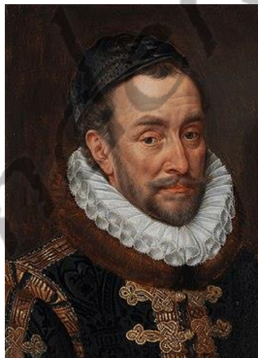
Willem van Oranje

De Staten-Generaal stelden hem bij het Verdrag van Plessis-lès-Tours in 1580 aan als soeverein vorst ("vorst en heer der Nederlanden"). Dit gebeurde op aandringen van Willem van Oranje, die hiermee de opstand wilde doen overhellen naar een meer gematigde godsdienstpolitiek, naar de Staten-Generaal en naar Brabant.