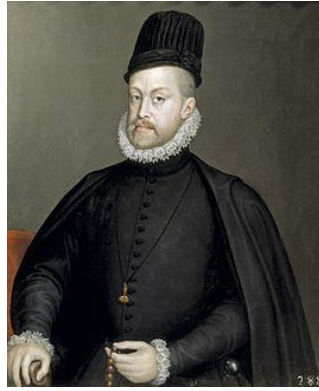
Filips II van Spanje

Deze provinciën wilden de soevereiniteit overdragen aan Frans van Anjou, de jongere broer van de Franse koning. Frans van Anjou eiste dat de Nederlanden zich onafhankelijk van Spanje zouden verklaren. Dat was ook logisch omdat hij immers was binnengehaald om soeverein vorst te worden. Om hem snel aanvaard te krijgen door de onderdanen werden een reeks blijde intredes georganiseerd in Antwerpen, Brugge en Gent.