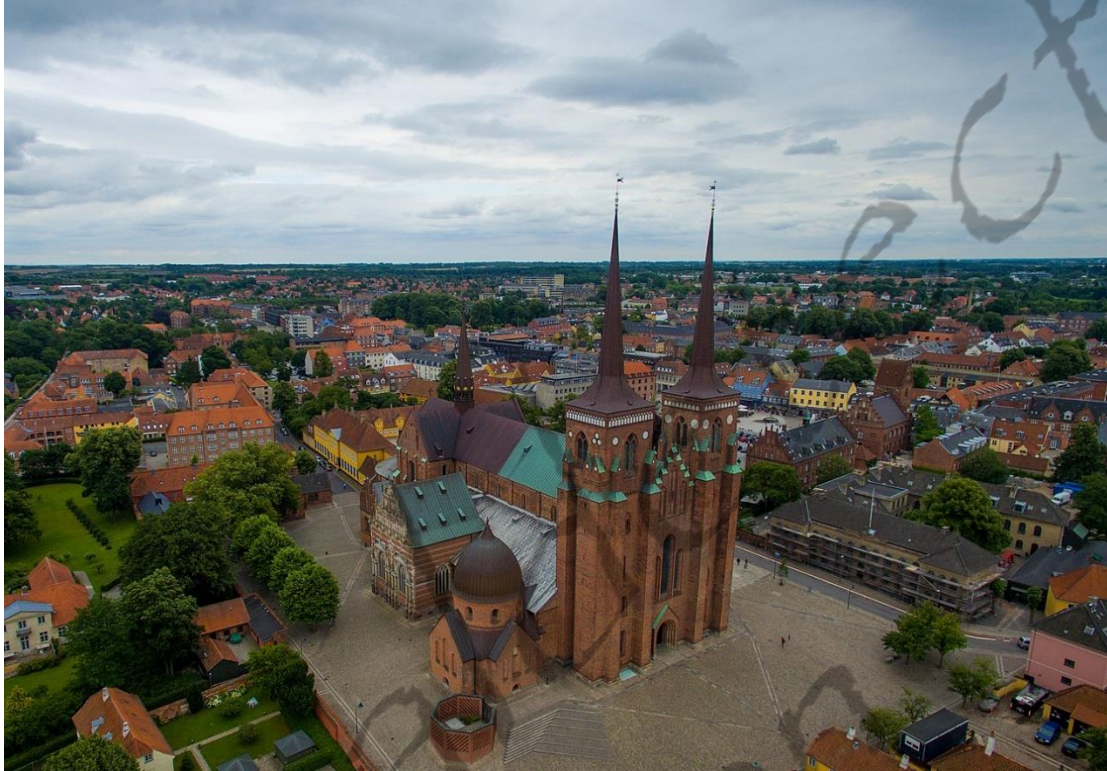
Roskilde-kathedraal: Uitzicht vanuit het noordwesten

Bij zijn dood in Paleis Amalienborg , Kopenhagen, in 1947, werd Christian X samen met andere leden van de Deense koninklijke familie begraven in de Roskilde-kathedraal nabij Kopenhagen.