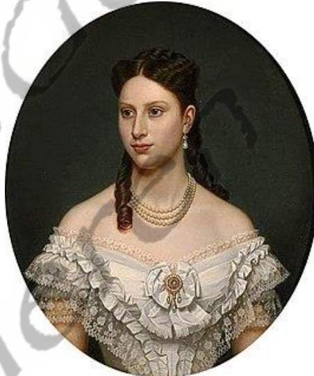
Frederik VIII van Denemarken en Louise van Zweden