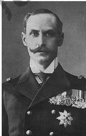
Haakon VII van Noorwegen