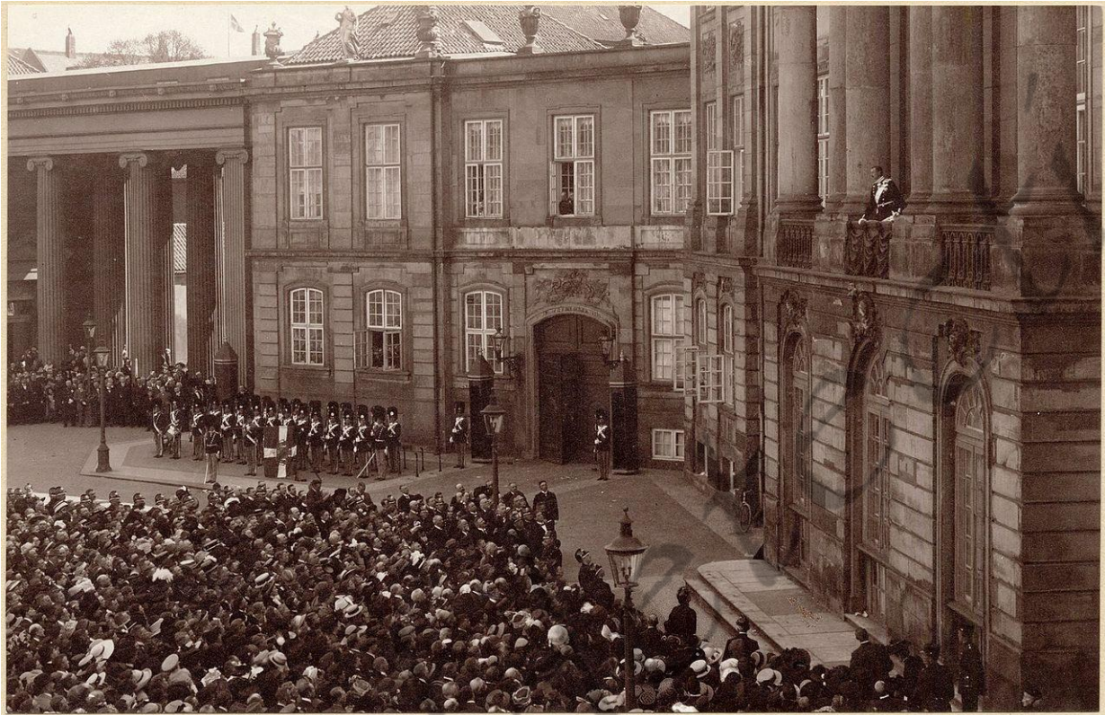
Kong Christian X. taler til Folket ved sin Tronbestigelse -1912.

Christiaan X spreekt het volk toe bij zijn troonsbestijging in 1912.