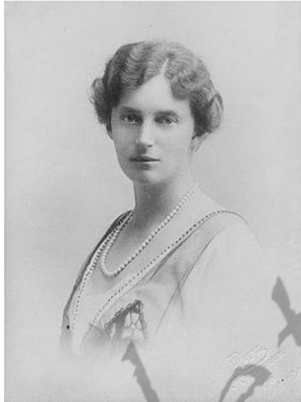
Alexandrine Augusta van Mecklenburg-Schwerin

Christiaan X was getrouwd met Alexandrine Augusta van Mecklenburg-Schwerin, dochter van groothertog Friedrich Franz III von Mecklenburg.