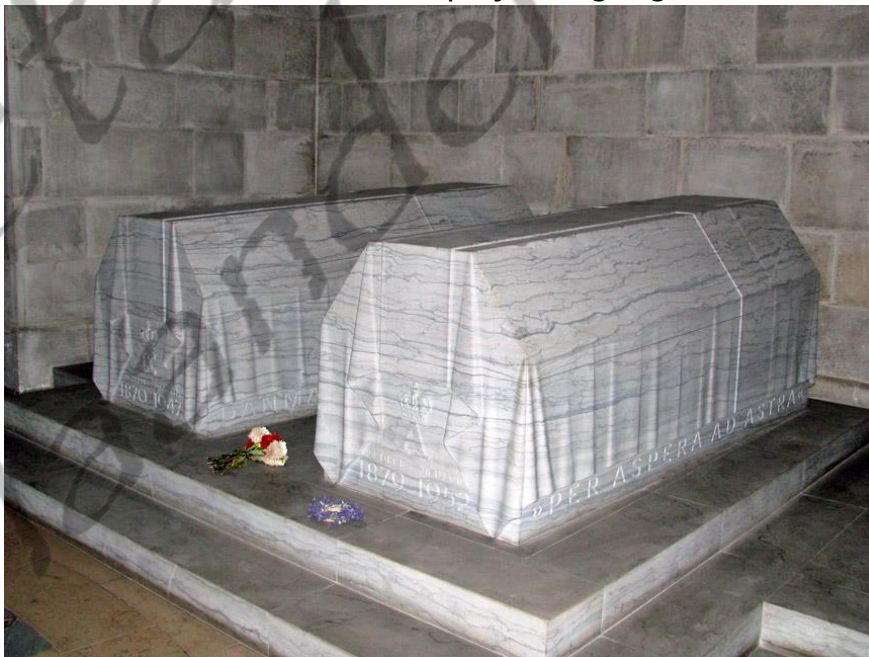
Tombes van Christiaan X was getrouwd met Alexandrine Augusta van Mecklenburg-Schwerin

Een stoffen armband van het type dat leden van de Deense verzetsbeweging droegen, werd onder een castrum doloris op zijn kist gelegd.