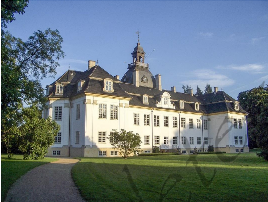
Geboorteplaats: Paleis Charlottenlund