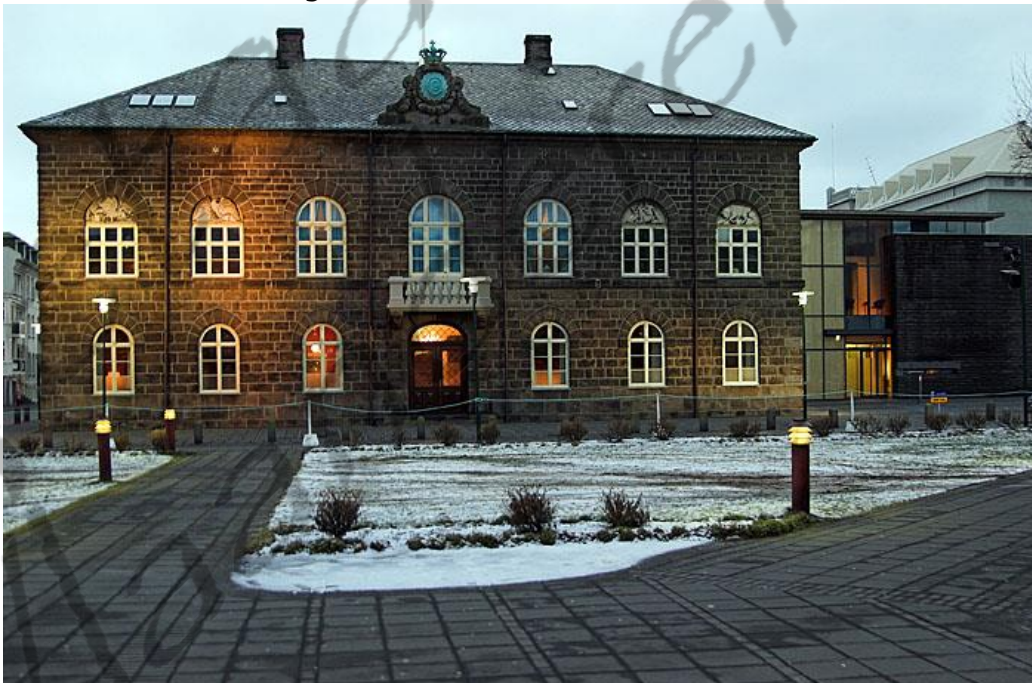
Het IJslandse parlamentsgebouw

De bezetting van Denemarken maakte communicatie met IJsland onmogelijk. Het IJslandse parlement nam op 10 april 1940 het heft in eigen handen. Een maand later bezetten de Britten IJsland en op 17 juni 1944 stemde het IJslandse volk in een referendum vóór afscheiding van Denemarken.