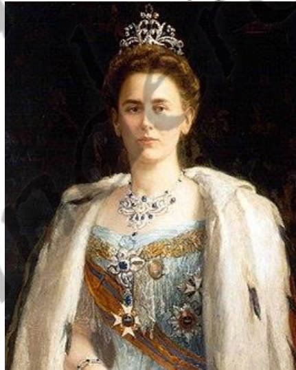
Wilhelmina der Nederlanden

Tijdens Christiaans bewind vonden beide wereldoorlogen plaats. In tegenstelling tot bijvoorbeeld Haakon VII van Noorwegen en de Nederlandse koningin Wilhelmina ontvluchtte hij tijdens de Tweede Wereldoorlog zijn land niet.