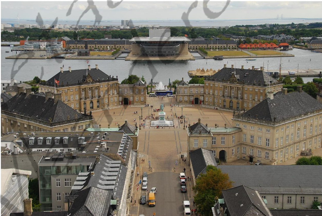
De paleizen (of herenhuizen) van Amalienborg, rondom de binnenplaats (gezien vanaf de Frederikskerk )

Het echtpaar kreeg het paleis van Christian VIII in Paleis Amalienborg in Kopenhagen als hun residentie en het Sorgenfri-paleis ten noorden van Kopenhagen als zomerresidentie.