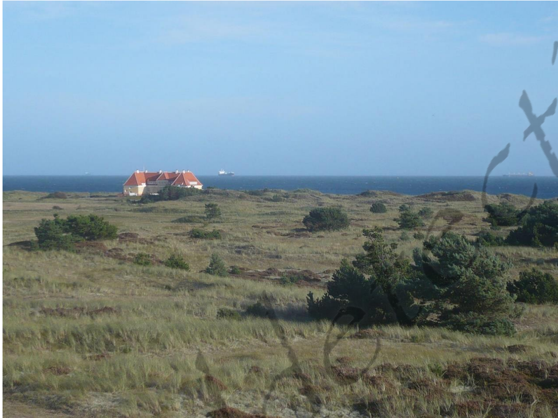
Klitgaarden met de zee als achtergrond

Op 14 mei 1912 stierf koning Frederik VIII op 68-jarige leeftijd nadat hij door kortademigheid was ingestort tijdens een avondwandeling in Hamburg , Duitsland. Hij was teruggekeerd van een herstelverblijf in Nice , Frankrijk, en verbleef anoniem in de stad voordat hij doorging naar Kopenhagen. Christian was in Kopenhagen toen hij hoorde over de dood van zijn vader en volgde op 41-jarige leeftijd de troon op. Hij werd door premier Klaus Berntsen tot koning uitgeroepen vanaf het balkon van het paleis van Christian VII in Amalienborg als koning Christian X.