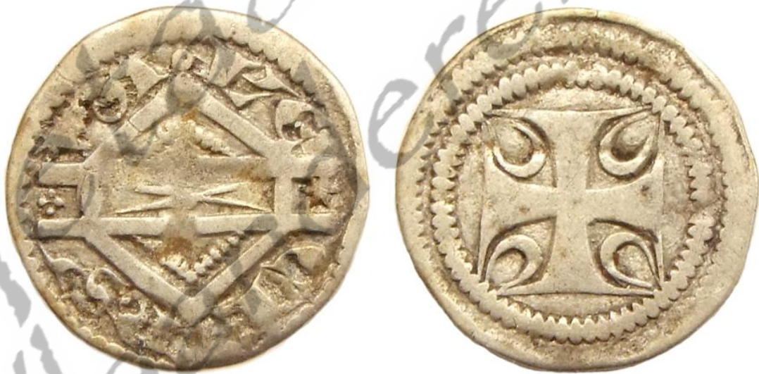
Zilver denier, geslagen onder Johanna van Constantinopel.