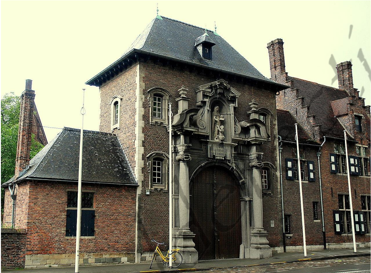
Groot Begijnhof Sint-Elisabeth in Gent. Standbeeld in een nis boven de ingang van de Dr. Decrolyschool in de Begijnhofdries.