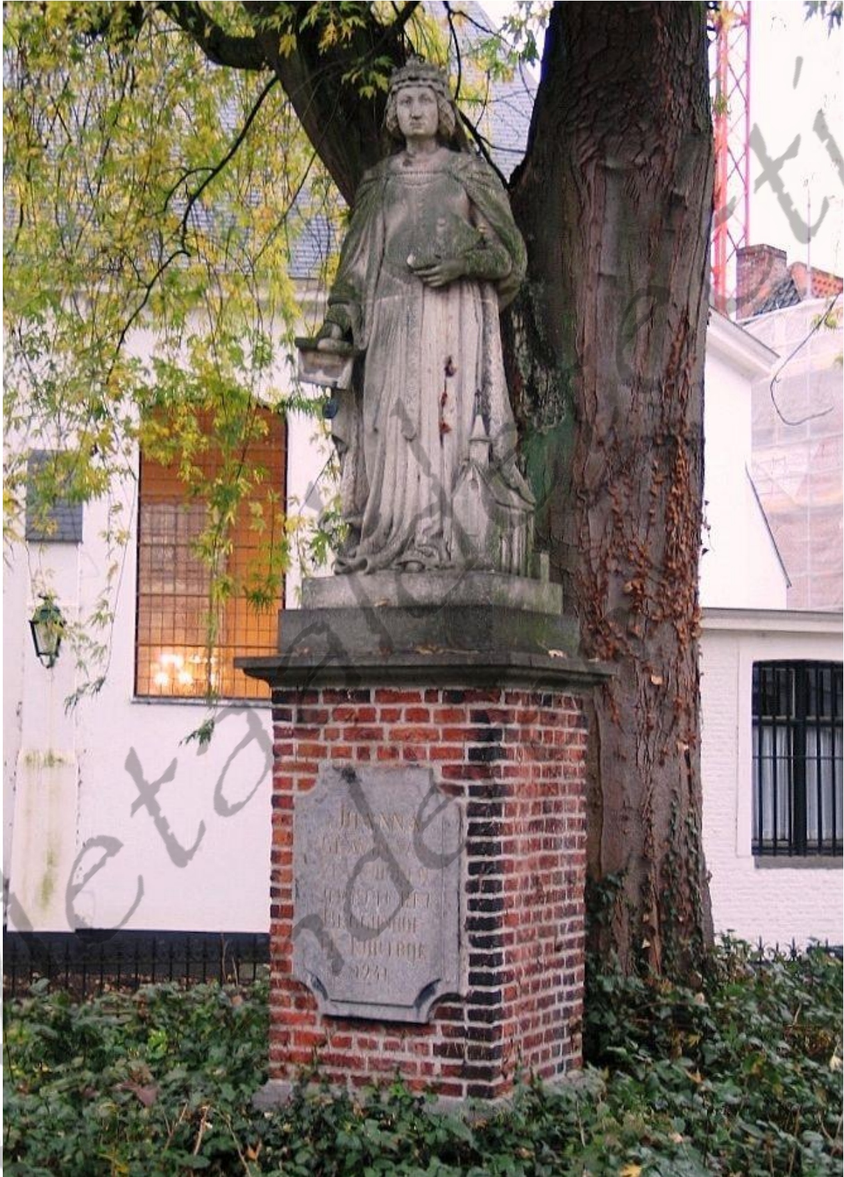
Johanna van Constantinopel in het begijnhof van Kortrijk