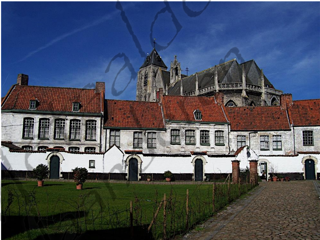
Het Begijnhof in Kortrijk werd in 1238 door Johanna van Constantinopel gesticht.

Johanna ging de geschiedenis in als een wilskrachtige en vrome vrouw. Zij begunstigde het kloosterleven en onder haar impuls ontstonden vele kloosters en abdijen. Ze steunde de bestaande hospitalen en leprozerieën en stichtte er nieuwe (onder meer de Hospice Comtesse in Rijsel). Onder haar bewind namen de economische macht en welvaart van de Vlaamse steden aanzienlijk toe. Haar standbeeld staat in de tuin van het begijnhof in Kortrijk, alsook in het Groot Begijnhof Sint-Elisabeth in Gent, in een nis boven de ingang van de Dr. Decrolyschool in de Begijnhofdries.