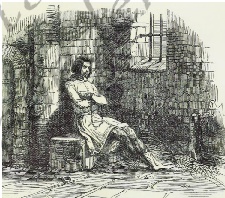
Ferrand van Portugal in de gevangenis na de Slag bij Bouvines

Nadat hij tijdens de Slag bij Bouvines (27 juli 1214) in Franse handen was gevallen moest de jonge gravin gedurende dertien jaar alleen regeren. Haar troon kwam even in gevaar toen de kluisenaar Bertrand van Rains zich ten onrechte uitgaf voor de teruggekeerde Boudewijn IX. Ook had zij af te rekenen met haar zwager Burchard van Avesnes, de eerste echtgenoot van haar zuster Margaretha, maar zij slaagde erin dit huwelijk in 1221 te laten verbreken. Na het sluiten van de vernederende Vrede van Melun mocht Ferrand in januari 1227 eindelijk na lange jaren de gevangenis verlaten.