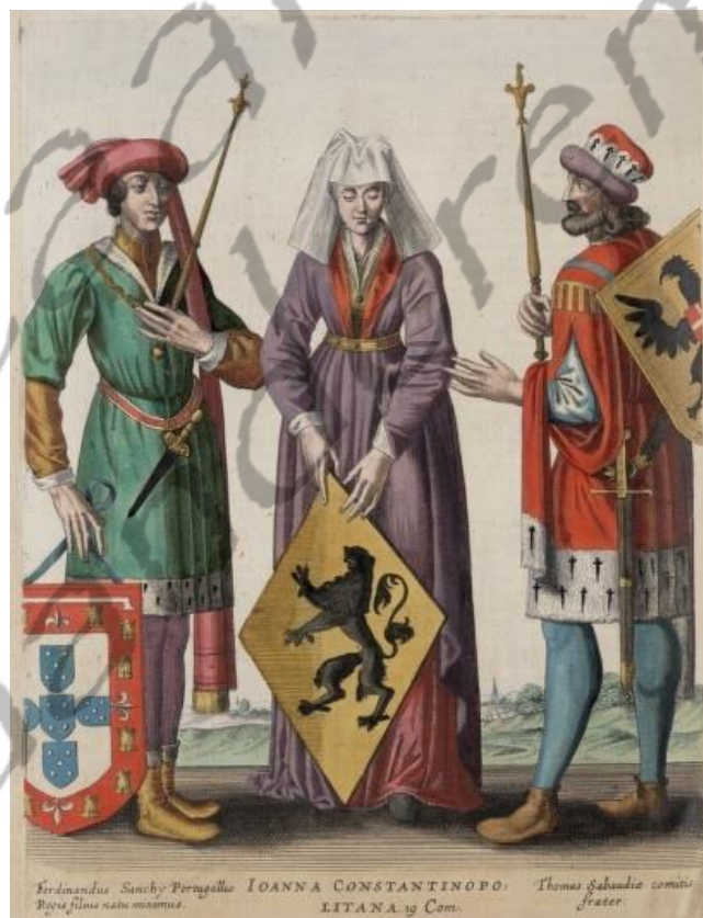
Gravin Johanna met links haar eerste echtgenoot Ferrand van Portugal en rechts haar tweede echtgenoot Thomas van Savoye - Afbeelding uit Flandria Illustrata (1641)