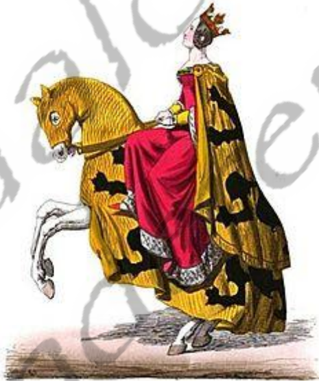
Margaretha II van Vlaanderen

Antonius Sanderus vermeldt in zijn Flandria Illustrata dat de Franse vorst wilde voorkomen dat Johanna zou huwen met een Engelse prins. Boudewijns broer markgraaf Filips I van Namen werd regent over Vlaanderen en Henegouwen en voogd van de minderjarige Johanna.