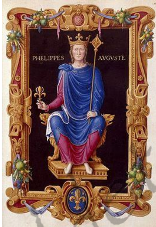
Filips II, bijgenaamd August(us)