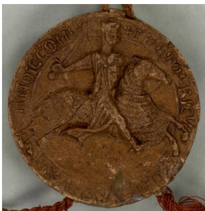
Zegel van Dirk VII uit het jaar 1200