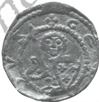
Penning met wapenschild Otto I van Gelre (1190)

Willem ontsnapte echter en vluchtte naar Otto I van Gelre. Dirk VII was als beheerder van het bisdom Utrecht namelijk in conflict gekomen met Otto van Gelre omdat deze het Oversticht (Overijssel en Drenthe) wilde bemachtigen van het bisdom. Dirk VII versloeg Otto bij de Grebbeberg.