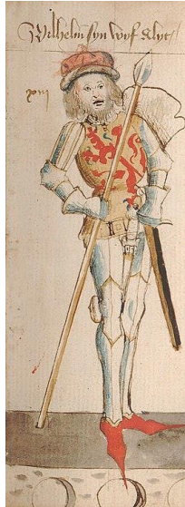
Willem I van Holland

Omdat Dirk op dat moment niet weg kon uit Zeeland stuurde hij zijn vrouw Aleida met een leger naar West-Friesland. In november 1195 kwam het tot een treffen tussen Aleida en haar zwager Willem. Aleida wist het treffen naar haar hand te zetten door de leiders van Oude Niedorp en Winkel om te kopen.