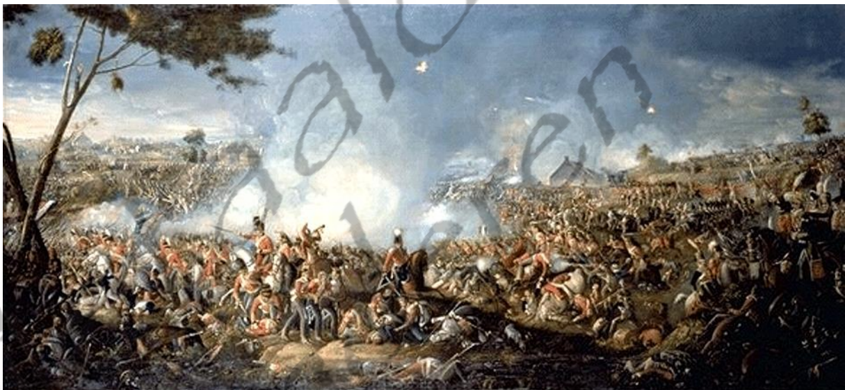
Slag bij Waterloo

Lodewijk XVIII kwam pas goed in het zadel na de Slag bij Waterloo.