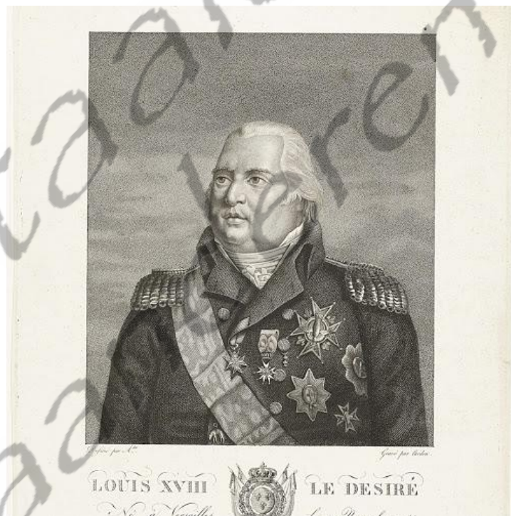
Koning van Frankrijk Co-vorst van Andorra