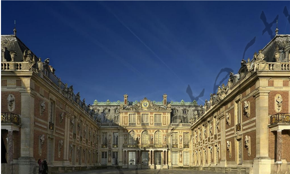
Kasteel van Versailles