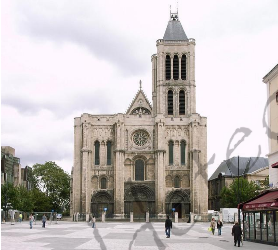
Kathedraal van Saint-Denis