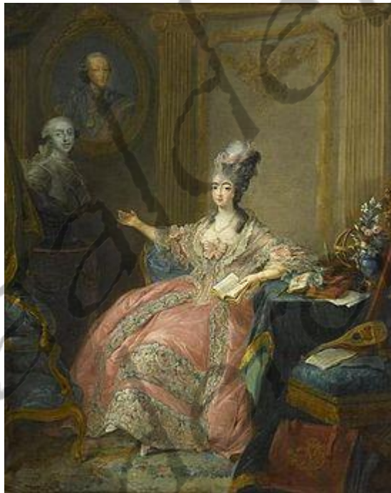
Marie Josephine Louise van Savoye

Op 14 mei 1771 trad Lodewijk in het huwelijk met Marie Josephine Louise van Savoye, prinses van Sardinië en van Piëmont (1753-1810), derde kind en tweede dochter van koning Victor Amadeus III van Sardinië en koningin Maria Antonia van Bourbon, infante van Spanje. Haar grootouders aan moederskant waren koning Filips V van Spanje en koningin Elisabetta Farnese.