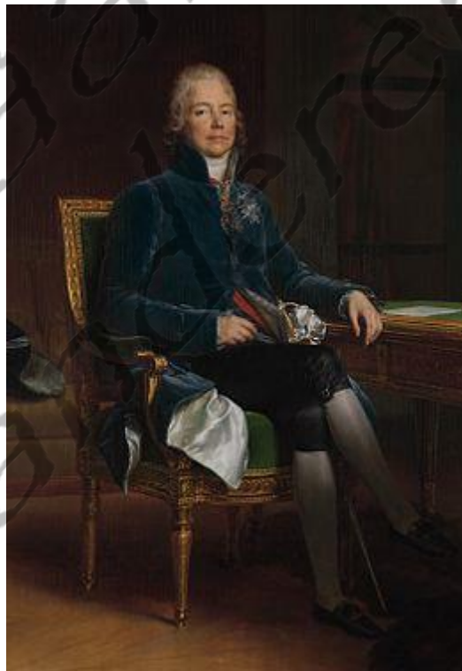
Charles-Maurice de Talleyrand-Périgord

Met de hulp van Charles-Maurice de Talleyrand ( een Franse diplomaat die nog onder zijn broer én onder Napoleon had gediend ) en Joseph Fouché kwam Lodewijk XVIII weer aan de macht in 1814.