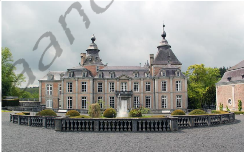
Kasteel van Modave

Hij was een zoon van hertog Albrecht VI van Beieren en Mechtilde van Leuchtenburg en kwam als coadjutor naar Keulen om zijn oom Ferdinand van Beieren bij te staan en volgde hem na diens dood in 1650 op als aartsbisschop-keurvorst van Keulen tevens prins-bisschop van prinsbisdom Luik, bisschop van prinsbisdom Hildesheim en prins-abt van het Abdijvorstendom Stavelot-Malmedy. Hij was eigenaar van het kasteel van Modave.