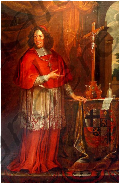
Maximiliaan Hendrik van Beieren in Het Stadsmus te Hasselt

De bisschop vluchtte in 1673 van Bonn naar Keulen, waar hij intrek nam het karthuizerklooster Sankt Pantaleon, en hield zich bezig met scheikundige proefnemingen. Op 11 mei 1674 tekende hij het vredesverdrag met de Republiek. In 1683 werd hij bisschop van Münster; de hulpbisschop Niels Stensen vertrok naar Hamburg, nadat hij kritiek had geleverd op de benoeming van Maximiliaan.