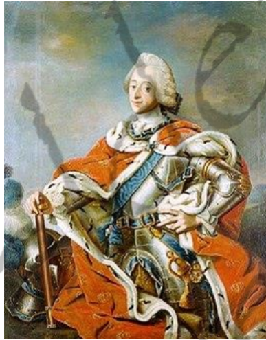
Frederik V van Denemarken