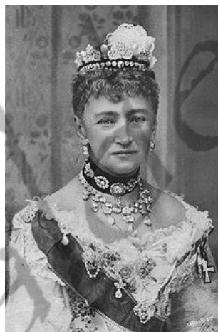
Louise van Hessen-Kassel

Vervolgens trouwde hij met een nicht van de Deense koning Christiaan VIII; Louise van Hessen-Kassel.