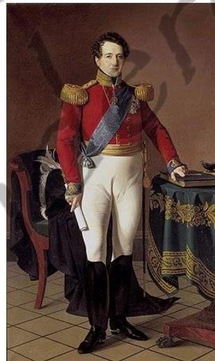
Christiaan VIII van Denemarken

De koning voorzag dat zijn enige zoon Frederik (VII) geen kinderen zou krijgen. Daarom bewerkstelligde hij dat Christiaan werd opgenomen in de lijn van troonopvolging. Op 15 november 1863 volgde hij Frederik VII op als koning van Denemarken. Meteen al kreeg hij te maken met een conflict met Pruisen over het grondgebied van Sleeswijk-Holstein (Sleeswijk-Holsteinse kwestie). Dit leidde in 1864 tot de Tweede Duits-Deense Oorlog. Voor