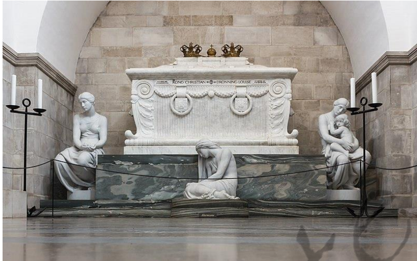
Tombe van Christaan IX en zijn vrouw