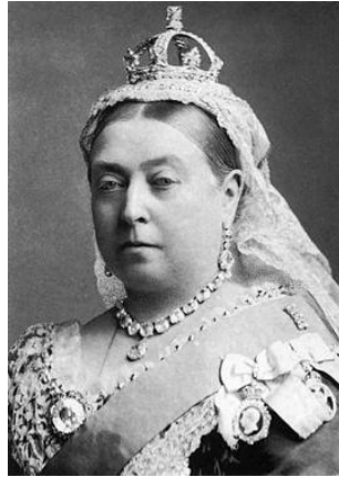
Victoria van het Verenigd Koninkrijk

Vervolgens trouwde hij met een nicht van de Deense koning Christiaan VIII; Louise van Hessen-Kassel.