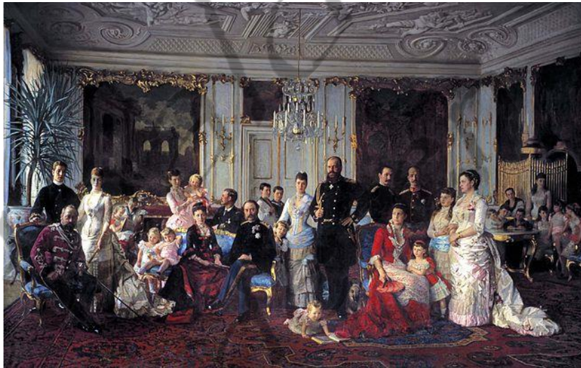
Christiaan IX met familie in de tuinzaal van paleis Fredensborg in 1883 door Laurits Tuxen Koningin Louise stierf op 29 september 1898 in het Slot Bernstorff in de buurt van Kopenhagen.

Vanwege zijn succesvolle huwelijkspolitiek werd Christiaan ook wel de "schoonvader van Europa" genoemd. Tot zijn nakomelingen horen de huidige regerende vorsten Elizabeth II van het Verenigd Koninkrijk, Margrethe II van Denemarken, Harald V van Noorwegen, Hendrik van Luxemburg, Filip van België en Felipe VI van Spanje, en de voormalige vorsten Michaël I van Roemenië en Constantijn II van Griekenland.