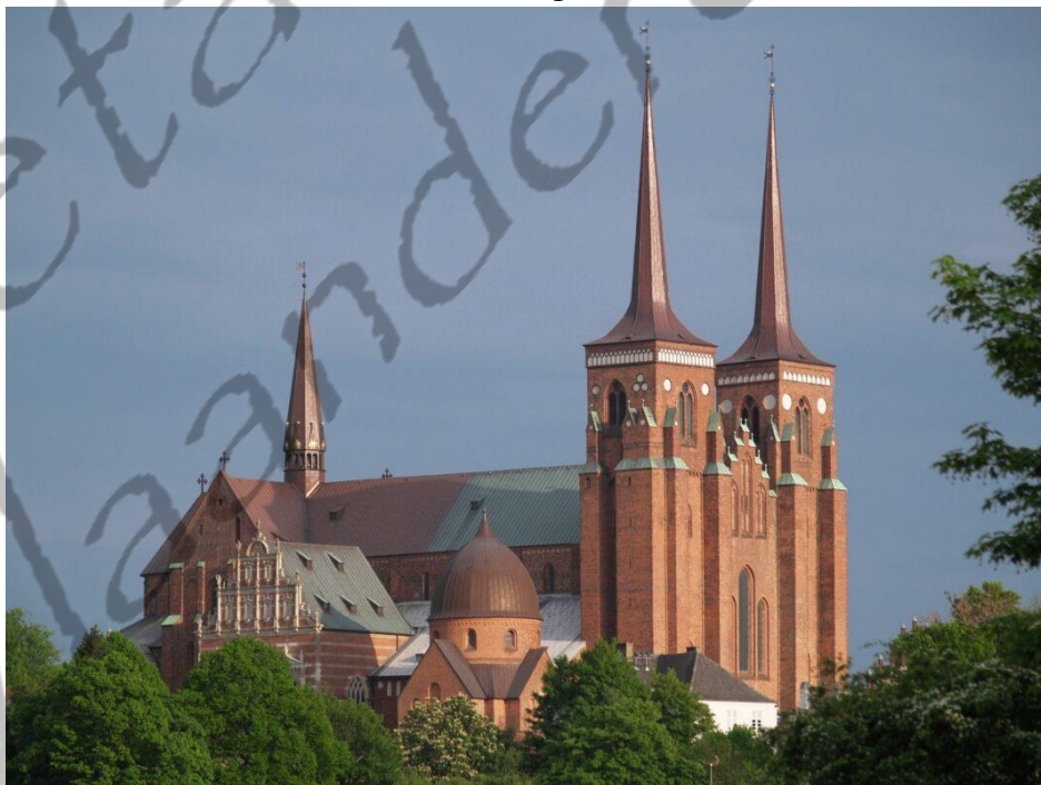
Kathedraal van Roskilde