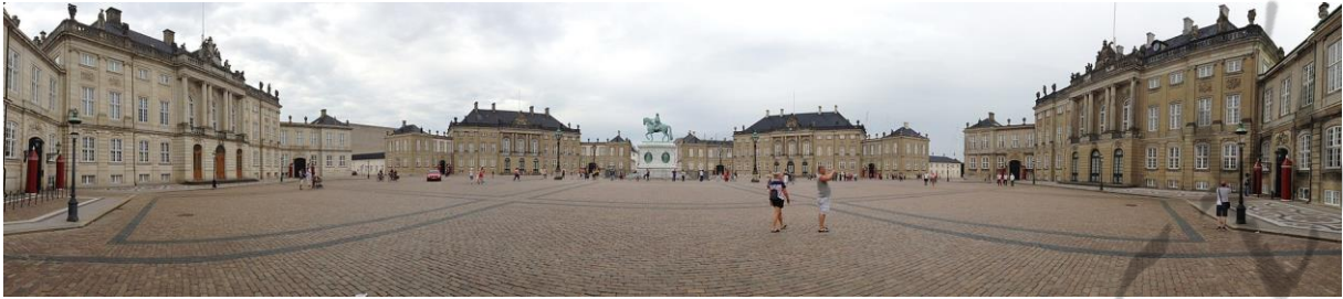
Panoramafoto van Amalienborg (juli 2013)

Christiaan stierf op 87-jarige leeftijd, op 29 januari 1906 in het Amalienborg-paleis in Kopenhagen na een regeerperiode van 42 jaar en 75 dagen.