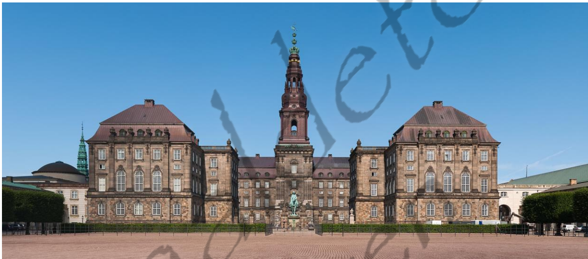
Christiansborg in 2014

Nadat hij opgebaard was in de kapel van het Christiansborg-paleis, werd hij begraven naast koningin Louise in de kapel van Christian IX in de kathedraal van Roskilde, de traditionele begraafplaats voor Deense monarchen sinds de 15e eeuw.