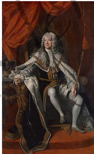
George II van Groot-Brittannië

Als jongeman trachtte hij naar de hand te dingen van koningin Victoria, maar dit had geen succes.