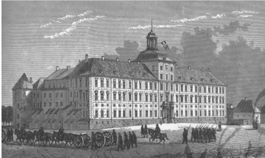
Slot Gottorp in 1864