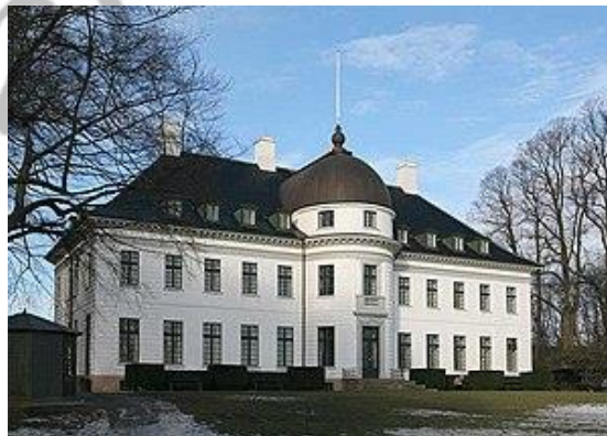
Slot Bernstorff ( 2006 )