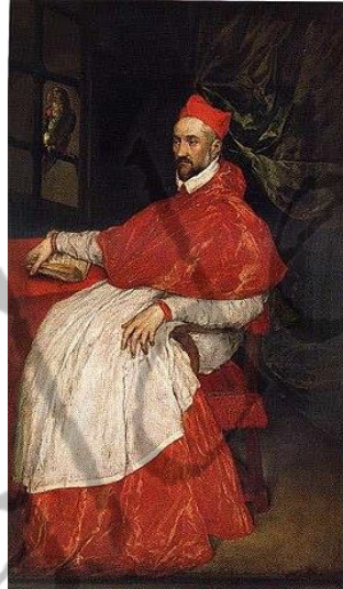
Karel van Lotharingen

Karel III steunde, als katholieke vorst, de katholieke strekking in de strijd tegen de hugenoten. Zijn neef, de machtige kardinaal Karel van Lotharingen (en naamgenoot) was een sleutelfiguur in de katholieke groepering rond de hertog de Guise.