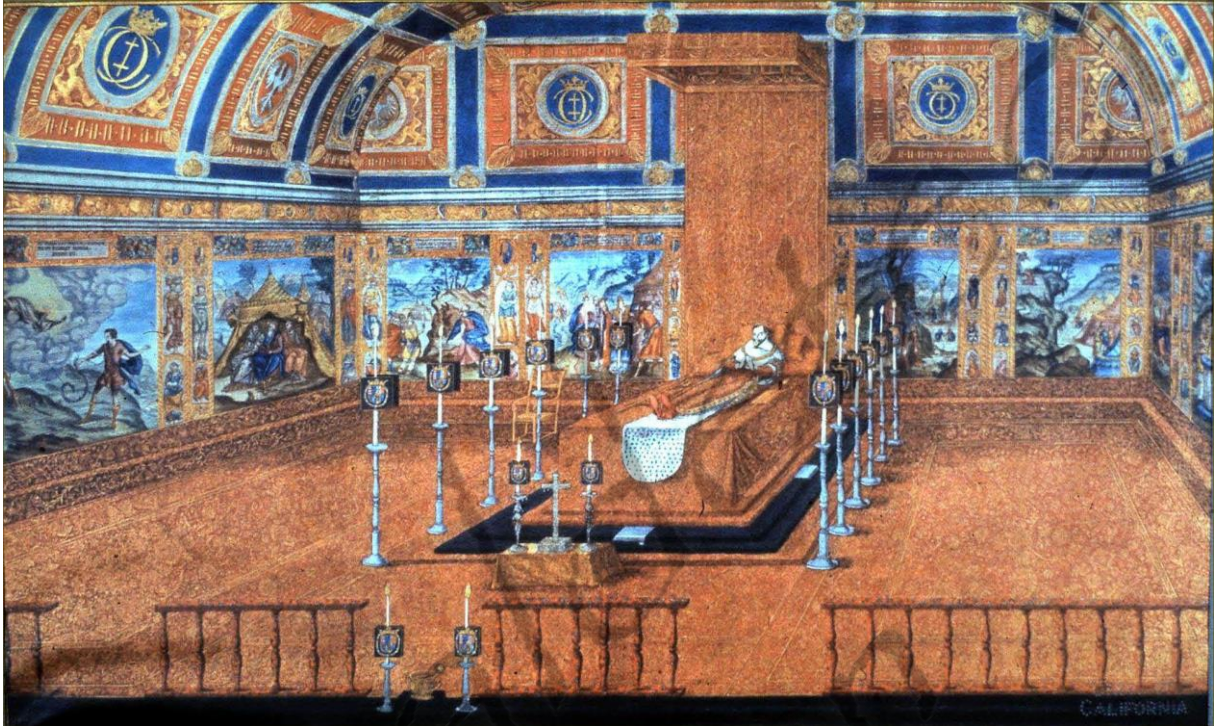
Charles III, hertog van Lotharingen, tentoongesteld op zijn staatsbed in de erezaal van het hertogelijk paleis van Nancy, ter gelegenheid van zijn begrafenis in 1608