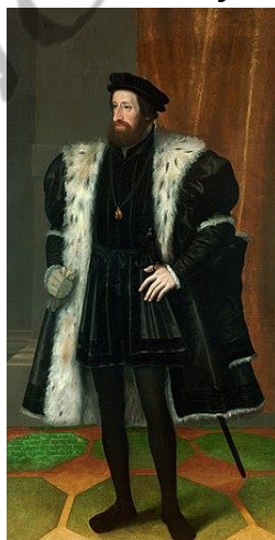
Keizer Ferdinand I

De relaties tussen Karel III en keizer Ferdinand en zijn opvolgers verliepen goed. Karel III kon zelfs kleine gebiedsuitbreidingen doen in oostelijke richting.