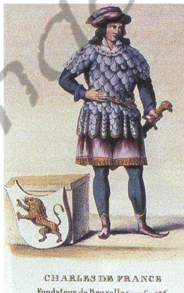
Karel van Neder-Lotharingen

Karel III leidde het hertogdom Lotharingen, gelegen in het Heilige Roomse Rijk, tot een hoogtepunt en regeerde meer dan 60 jaren. Hij zocht, als katholieke Rooms-Duitse vorst, naar een politiek-religieus vergelijk met het buurland koninkrijk Frankrijk verscheurd door godsdienstoorlogen. Zijn bijnaam is soms Karel III de Grote. De nummering zou eigenlijk Karel II moeten zijn, geteld volgens zijn afstamming van de Capetingers. Doch tijdgenoten gaven hem de nummering III omdat ze hertog Karel van Neder-Lotharingen (dus, van het andere Lotharingen) uit de 11e eeuw ook meetelden voor Opper-Lotharingen.