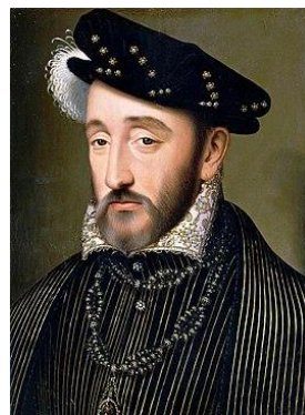
Hendrik II van Frankrijk

Formeel werd Karel hertog van Lotharingen en Bar. Aanvankelijk waren zowel zijn moeder Christina als zijn nonkel-bisschop Nicolaas van Lotharingen co-regenten doch er ontstond snel ruzie tussen beiden. Hertogin-weduwe Christina voerde een pro-Habsburgse politiek in Lotharingen, terwijl Karels nonkel resoluut pro-Frans was. Binnen het jaar was Christina de enige regentes en voedde zij haar kinderen alleen op in het hertogelijk paleis te Nancy. Met militair machtsvertoon in Nancy keerde de Franse koning Hendrik II de rollen om (1552): zijn nonkel en ex-bisschop Nicolaas werd regent van Lotharingen en de negenjarige Karel werd afgevoerd naar Parijs.