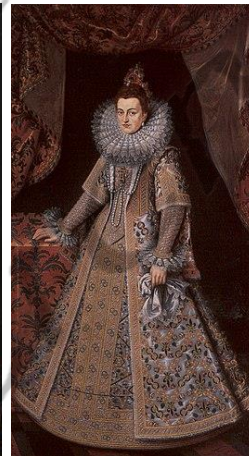
Albrecht van Oostenrijk en Isabella van Spanje

Hiermee bleef het grondgebied van het hertogdom Luxemburg intact.