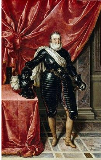
Hendrik IV van Frankrijk

Koning Hendrik IV werd katholiek en zijn zus Catharina van Bourbon huwde met Karels zoon Hendrik. Karel III legde zich neer bij de nieuwe Bourbondynastie in Parijs en hield belangrijke diplomatieke betrekkingen aan.