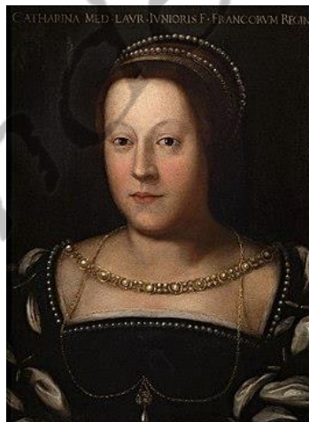
Catharina de' Medici

Karel weigerde evenwel toe te treden tot de Katholieke Liga. Karel trad pas toe in 1589 en dit om twee redenen: 1° er waren protestantse strooptochten in Lotharingen en 2° in Frankrijk barstte er een dynastieke kwestie uit toen het koninklijk Huis Valois op het punt stond uit te sterven. De drie zonen van Catharina de' Medici waren kinderloos.