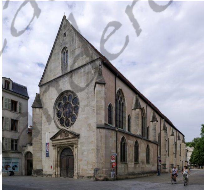
Cordelierskerk in Nancy