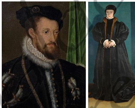
Frans I van Lotharingen en Christina van Denemarken

Hij was de zoon van hertog Frans I van Lotharingen en hertogin Christina van Denemarken. Aangezien Karels vader stierf toen Karel twee jaar oud was, werd er een regentschap voor het hertogdom Lotharingen ingesteld.