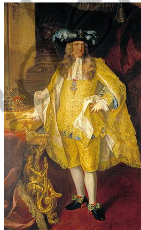
Keizer Karel VI