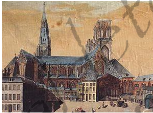
Sint-Lambertuskathedraal in 1780

Hij werd in 1101 proost van het Sint-Bartholomeuskapittel te Luik en hij was daarna nog proost van het Sint-Martinus- en Sint-Pauluskapittel in dezelfde stad. In 1111 werd Alexander schatbewaarder en aartsdiaken van de Sint-Lambertuskathedraal.