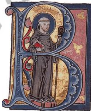
Bernardus in een middeleeuws verlucht handschrift (1267/76), miniatuur uit manuscript Keble MS 49, University of Oxford