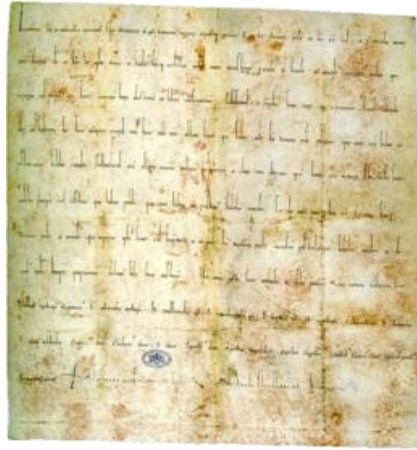
Oorkonde van het concordaat van Worms.