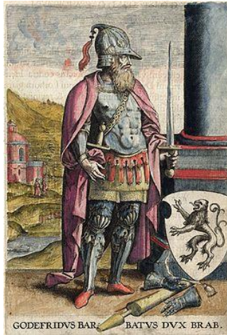
Godfried I van Leuven

Alexander kreeg hierbij de steun van een leger, bestaande uit inwoners van Hoei, onder leiding van Arnold II van Loon. Op 7 augustus 1129 vond er een veldslag plaats te Wilderen in het graafschap Duras waarbij de troepen van Alexander als winnaar uit de strijd kwamen en waarbij de troepen van het hertogdom Brabant moesten vluchten. Aan beide zijden waren vele doden gevallen.