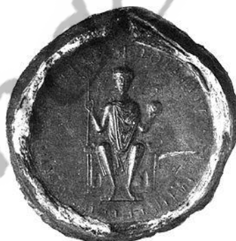
Zegel van Lotharius III op een oorkonde van 1131

Na de dood van Alberon werd Alexander in 1128 unaniem verkozen tot bisschop. Op 18 maart 1128 ontving hij zijn bisschopswijding. Alexander was een medestander van koning Lotharius III.