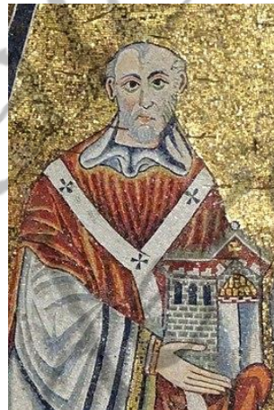
Paus Innocentius II

Op 22 maart 1131 vond er een ontmoeting plaats in de Sint-Lambertuskathedraal tussen paus Innocentius II, die Alexander wilde eren vanwege zijn overwinning op Godfried I van Leuven, koning Lotharius III, Bernard van Clairvaux en 32 bisschoppen.