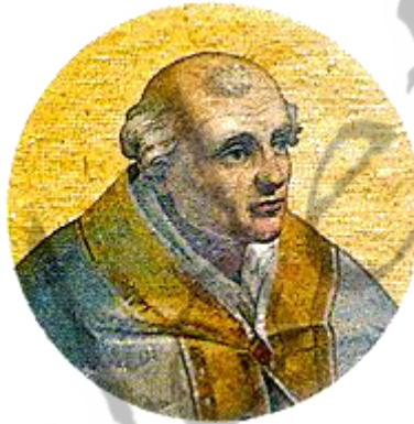
Paus Calixtus II

Nadat de bisschopzetel gedurende twee jaar vacant was geweest werd Alberon I van Leuven benoemd tot rijksbisschop.