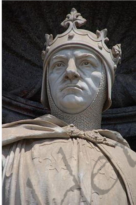
Karel van Anjou

Willem steunde zijn zwager Jan van Avesnes tegen Karel en kwam uiteindelijk in 1254 met Lodewijk IX van Frankrijk tot een regeling die Jan het graafschap Henegouwen liet behouden.