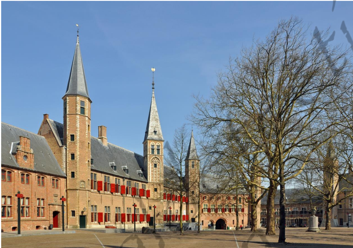
Abdi van Middelburg

voor een groot deel uitgemoord door de Hollanders. Willem II werd begraven in de Abdi van Middelburg.