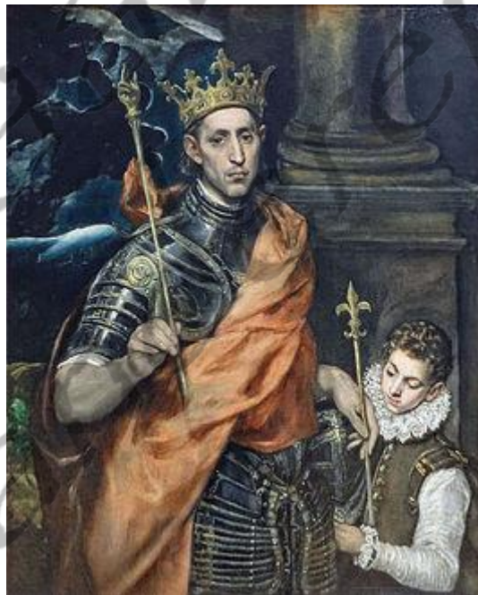
Lodewijk IX van Frankrijk

Willem steunde zijn zwager Jan van Avesnes tegen Karel en kwam uiteindelijk in 1254 met Lodewijk IX van Frankrijk tot een regeling die Jan het graafschap Henegouwen liet behouden.