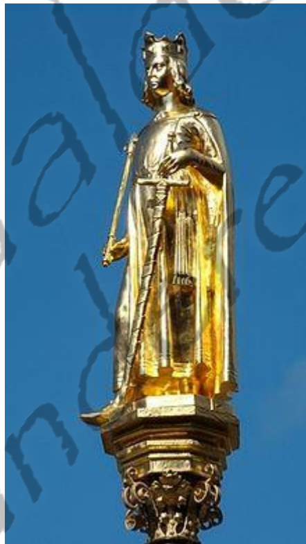
Beeld van Willem II van Holland op het Binnenhof in Den Haag

Willem II voerde verschillende oorlogen tegen de Westfriezen. Tijdens de veldtocht tegen de Westfriezen zakte hij op 28 januari 1256 bij Hoogwoud door het ijs van het Berkmeer. De Westfriezen vonden hem in machteloze positie en doodden hem. Toen ze doorhadden dat ze de koning hadden gedood, werd Willem begraven onder de hardplaat van een boerderij in Hoogwoud. Pas in 1282 wist zijn zoon, graaf Floris V, zijn stoffelijk overschot terug te vinden, maar niet zonder slag of stoot: Hoogwoud werd geplunderd en de bevolking werd