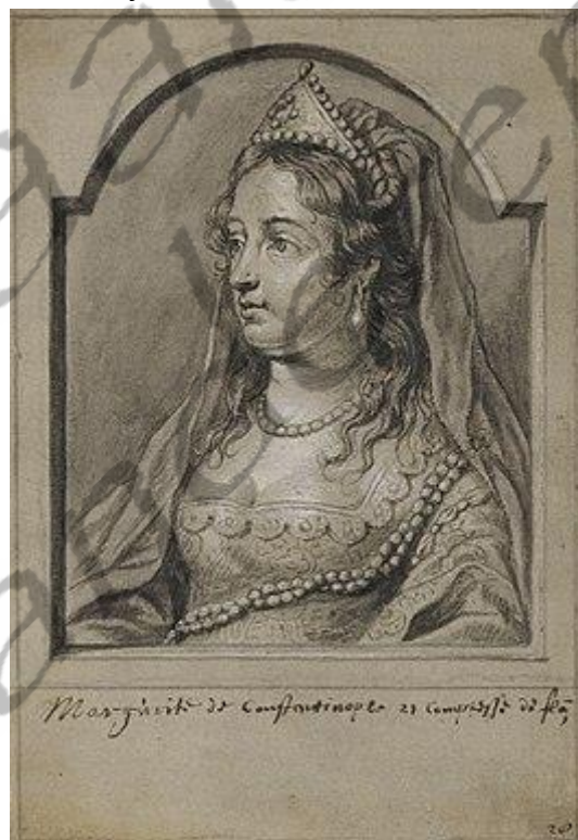
Margaretha II van Vlaanderen

Als gevolg van deze ontwikkelingen deed Margaretha II van Vlaanderen haar aanspraken op Henegouwen over op Karel van Anjou.