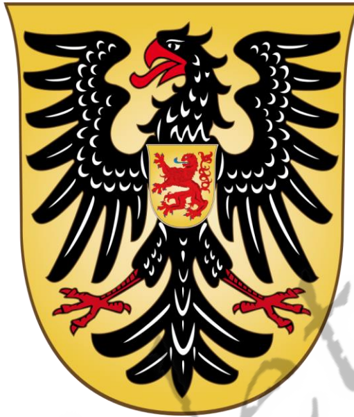
Wapen van Willem II als Rooms-koning

Daarnaast had Willem bij een minnares nog een zoon: Dirk (ovl. 1312).