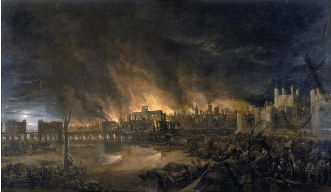
De grote brand in Blackfriars en Ludgate Hill vanuit het zuiden vanaf een boot aan de Tower Wharf op de avond van dinsdag 4 september 1666. De oude St Paul's Cathedral is te zien tegen een achtergrond van vlammen, met de Tower of London rechts en London Bridge links.

Deze episode werd uitgebreid beschreven in het unieke dagboek van Samuel Pepys. In datzelfde jaar werd een belangrijk deel van de Britse vloot vernietigd door de Nederlandse vloot, onder leiding van Michiel de Ruyter en Cornelis de Witt tijdens de Tocht naar Chatham, die een sinds 1066 ongekende invasie vanaf het continent op Engels grondgebied betekende.