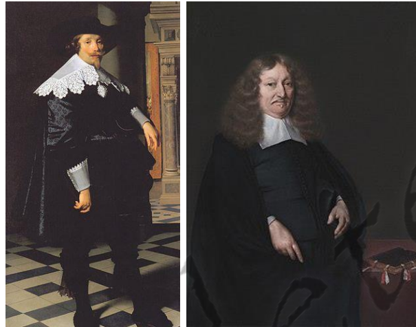
Cornelis en Andries de Graeff

Dutch Gift: Gastmaal voor de Engelse koning Karel II in het Mauritshuis op 30 mei 1660. De koning zit rechts tussen zijn tante Elisabeth, koningin van Bohemen in (Haagse) ballingschap, en zijn zuster Maria Henrietta Stuart, prinses van Oranje. Op de voorgrond een jonge prins Willem III van Oranje, de latere stadhouder van de Nederlanden en koning van Engeland, Schotland en Ierland.