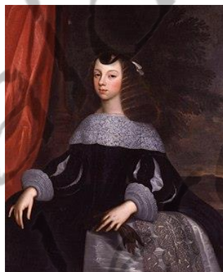
Catharina van Bragança

Karel trouwde op 21 mei 1662 met de Portugese Catharina van Bragança, die hem trouw was, maar alleen miskramen had.