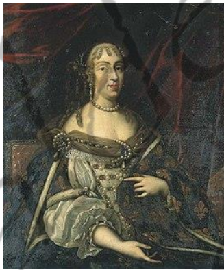
Anne Marie Louise van Orléans