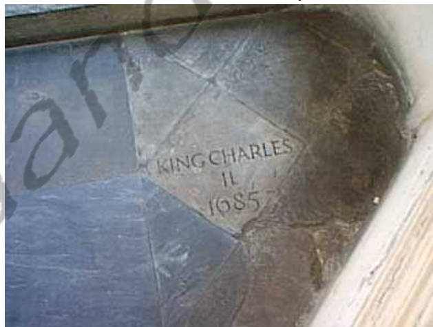
Inscriptie in de vloer van Westminster Abbey die het graf markeert van Karel II