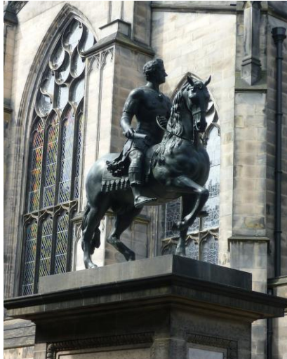
Standbeeld van Karel II als Julius Caesar in Edinburgh