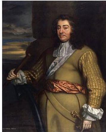
Generaal George Monck

In 1660, na de dood van Cromwell, trok de militaire bevelhebber van Schotland, generaal Monck, op naar Londen, waar hij het Rump Parlement bijeenriep.