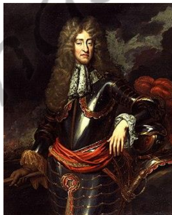
Jacobus II van Engeland

Hij werd opgevolgd door zijn katholieke broer Jacobus II.