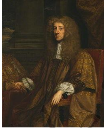
Lord Shaftesbury: Anthony Ashley Cooper

parlement, aangezien Karel geen wettige kinderen had en de hertog derhalve voorbestemd was hem op te volgen. Dit leidde tot de opvolgingscrisis circa 1680. Lord Shaftesbury, die deel van de CABAL had uitgemaakt, werd eind jaren 70 een gezworen vijand van de koning, toen hij in het parlement de Exclusion Bill indiende, waarmee Karels zoon Monmouth als troonopvolger erkend moest worden.