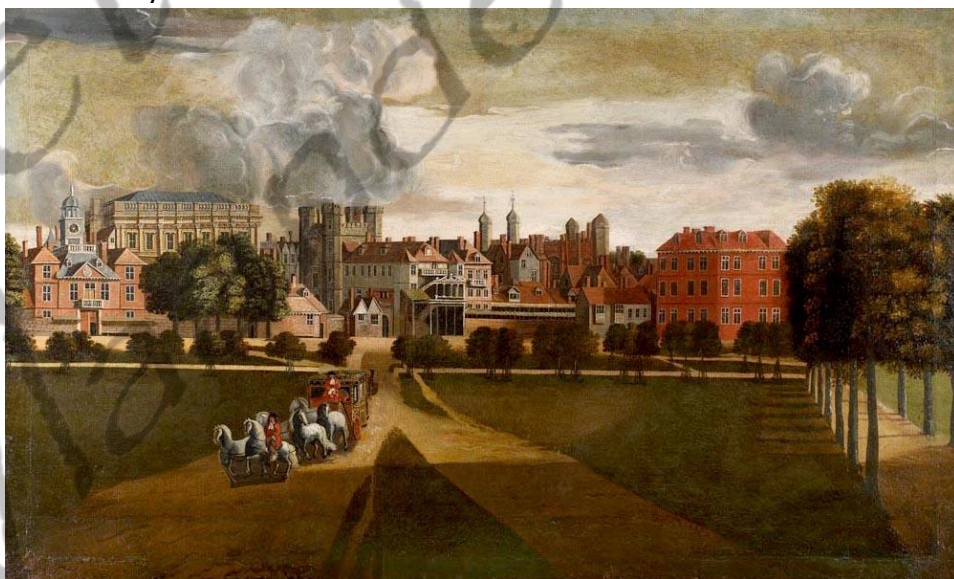
Plaats waar Karel II stierf: Palace of Whitehall

Hij stierf op 6 februari 1685 na een lang ziekbed waarin zijn incompetenten artsen hem aan bizarre en pijnlijke kuren onderworpen hadden. De aanvankelijke aanleiding kan een beroerte of hartinfarct geweest zijn; ook mogelijk is dat hij zichzelf in de loop der jaren geleidelijk vergiftigd had met chemische experimenten, waardoor nierfalen was opgetreden. Voor zijn geliefde Nell Gwyn liet hij op zijn sterfbed zijn broer beloven dat zij 'niet zou verhongeren', maar een royaal pensioen zou ontvangen. Bij zijn artsen verontschuldigde hij zich dat hij zo lang nodig had om te sterven. Hij werd begraven in de kapel van Hendrik VII in Westminster Abbey.