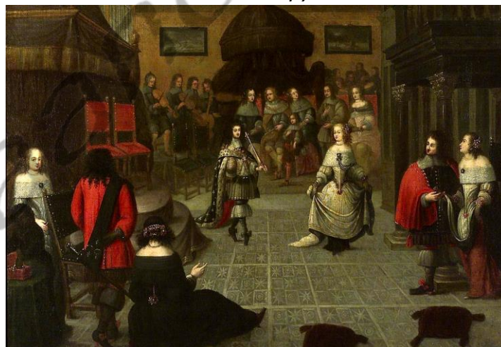
Karel II op een bal in Den Haag