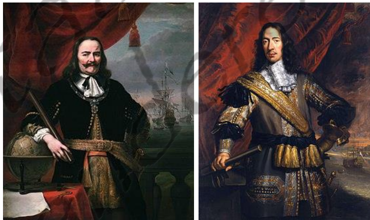
Michiel de Ruyter & Cornelis de Witt

Deze episode werd uitgebreid beschreven in het unieke dagboek van Samuel Pepys. In datzelfde jaar werd een belangrijk deel van de Britse vloot vernietigd door de Nederlandse vloot, onder leiding van Michiel de Ruyter en Cornelis de Witt tijdens de Tocht naar Chatham, die een sinds 1066 ongekende invasie vanaf het continent op Engels grondgebied betekende.