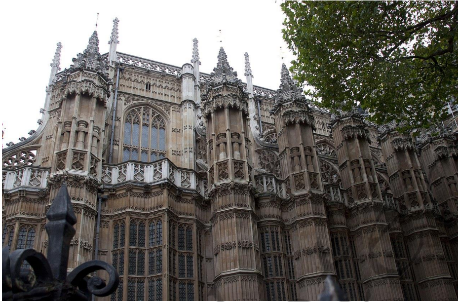
kapel van Hendrik VII