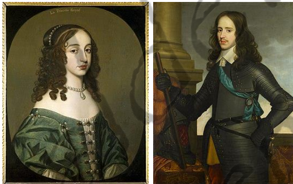
Maria Henriëtte Stuart & stadhouder Willem II

Op deze rondreizen vertoefde een spion van Cromwell in hun midden, die de regering in Engeland informeerde over de precare toestand van Karel II. Hij woonde, dankzij zijn zuster Maria Henriëtte Stuart die gehuwd was met stadhouder Willem II, enige tijd met zijn gezin in Den Haag.