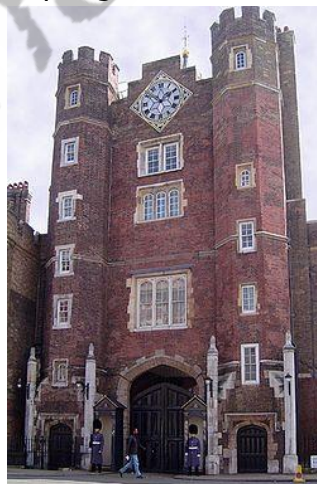
Geboorteplaats: St. James's Palace