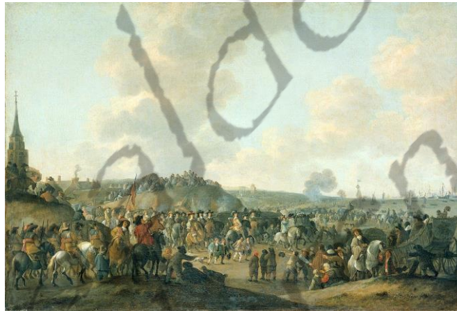
Karel II vertrekt vanaf het strand bij Scheveningen, geschilderd door Hendrick de Meijer.

In deze vergadering werd Karel teruggeroepen om de regering over te nemen, waarvoor hij ruime volmachten kreeg. Vanuit Scheveningen keerde hij naar Engeland terug; hij landde op 25 mei 1660 te Dover en bereikte Londen op 29 mei, zijn 30e verjaardag.