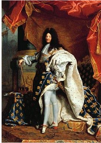
Lodewijk XIV van Frankrijk

Kort voor zijn dood bekeerde hij zich tot het katholicisme. Hij had reeds lang sympathie voor het katholicisme gehad; toen hij na de slag bij Worcester was ondergedoken, was John Huddleston een van diegenen geweest die hem verborgen hadden. Deze Huddleston was pastoor en had een uitzondering op de restricties voor katholieke geestelijken verkregen. Op zijn sterfbed weigerde Karel de anglicaanse sacramenten te ontvangen; zijn broer ontbood in plaats daarvan Huddleston, door wie hij zich in extremis liet bekeren. Overigens had hij deze bekering anno 1670 in het geheime Verdrag van Dover aan zijn neef Lodewijk XIV beloofd, en dat zijn invloedrijke minnares Louise de K rouaille hem tot deze stap had bewogen, valt evenmin uit te sluiten.