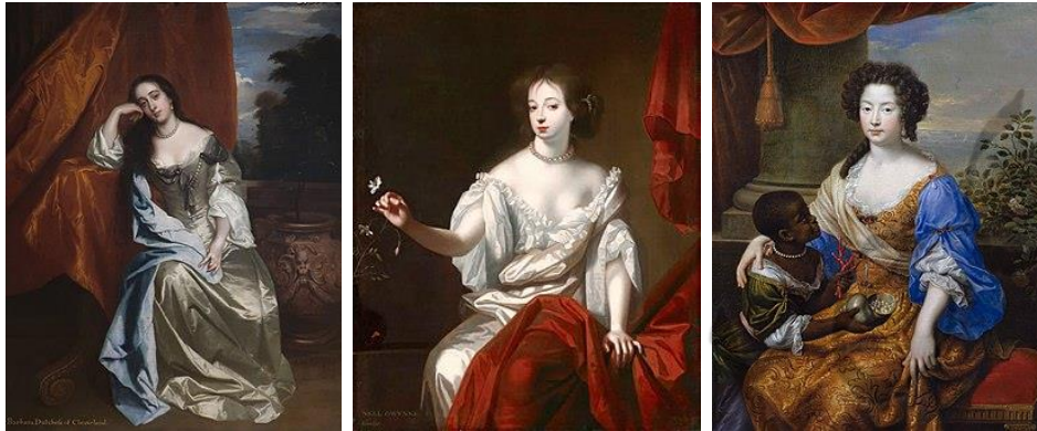
Barbara Palmer, Nell Gwyn & Louise de K rouaille

Hij verwierf door zijn levensstijl dan ook de bijnaam 'de Vrolijke Koning'. Zijn favoriete minnaressen waren Barbara Palmer, hertogin van Cleveland, de actrice Nell Gwyn en een hofdame van zijn jongste zuster, Louise de K rouaille. Palmer, ook bekend als lady Castlemaine, was zelf zeer promiscue en kreeg kinderen van verschillende mannen, waar Karel echter geen probleem mee leek te hebben.