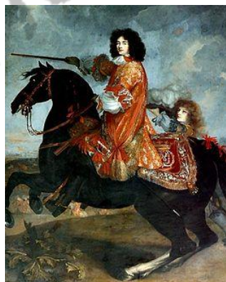
James Scott, 1e Hertog van Monmouth

Catharina was in 1663 bijna gestorven, wellicht aan peritonitis. Karel verwekte echter talloze onwettige kinderen van wie hij er veertien erkende, onder wie James Scott, hertog van Monmouth.