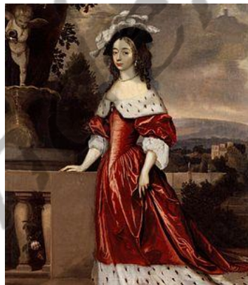
Henriëtte Catharina van Nassau

Daar liet hij zijn oog vallen op Henriëtte Catharina van Oranje, maar zijn verzoek om haar hand werd door haar moeder afgewezen.