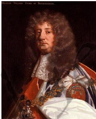
George Villiers: Lord Buckingham

Ouders: Karel I van Engeland & Henriëtta Maria van Frankrijk Karel, zijn broer Jacobus en Lord Buckingham werden samen opgevoed.