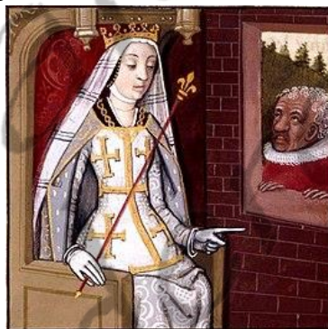
Johanna I van Napels

Toen Robert in 1343 overleed, werd hij door zijn 16-jarige kleindochter, Johanna I van Napels, opgevolgd, aangezien zijn zoon Karel reeds in 1328 was overleden.