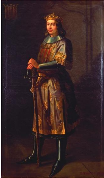
Peter III van Aragón

Karel I behield enkel nog het koninkrijk Napels. Toen drie jaar later (1285) zijn grootvader op 59-jarige leeftijd kwam te sterven bij Foggia in Italië werd zijn vader (die toentertijd een gijzelaar was) Karel II koning van Napels. Zijn vader Karel II werd in 1288 vrijgelaten, na het betalen van losgeld. Roberts broer, Karel Martel van Anjou stierf in 1295 aan de pest.