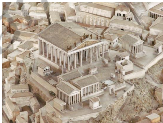
Maquette van de Capitolijn (Campidoglio) in de oudheid