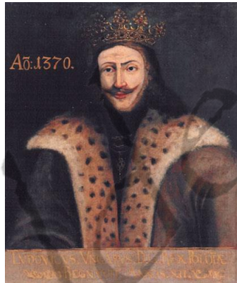
Lodewijk I van Hongarije