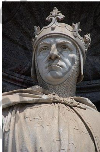
Standbeeld van Karel I bij het Koninklijk Paleis van Napels

Zijn grootvader Karel I van Anjou, werd na de Slag bij Benevento (1266) koning van Zuid-Italië.