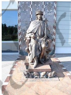
Standbeeld van koning Karel I Robert van Hongarije in Gyöngyös.

Zijn vader stierf in 1309. Roberts neef Karel I Robert van Hongarije, zoon van zijn broer Karel Martel, had evenveel recht om opvolger te worden, maar hij was te veel in beslag genomen met zijn poging om de Hongaarse kroon te bemachtigen (waarin hij in 1310 slaagde) en zou daarom zijn aanspraken op de troon van Napels niet doen gelden. Robert werd erfgenaam als naaste bloedverwant.