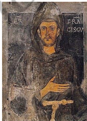
Franciscus van Assisi

Zijn andere broer Lodewijk zag van zijn aanspraken op de troon af (hij had zich aangesloten bij de spirituelen, de radicale stroming binnen de Orde van de Franciscanen die de armoederegel van Franciscus van Assisi strikt wilde navolgen), en stierf in 1297 als bisschop van Toulouse.