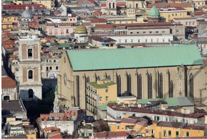
Basiliek van Santa Chiara (Napels)