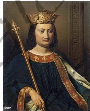
Filips IV van Frankrijk

In 1311 liet hij zich in Milaan tot koning van Italië kronen en een jaar later in Rome tot keizer. Koning Filips IV van Frankrijk zag dit met lede ogen aan en stelde Robert aan als leider van de Welfen.