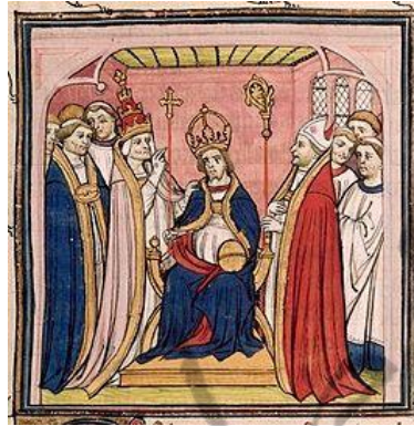
Keizerskroning van Hendrik VII

Sinds 1254 was er geen koning van Italië meer en was het land verdeeld in Welfen (anti-keizer) en Ghibellijnen (pro-keizer). De Duitse koning Hendrik VII had de ambitie om het Heilige Roomse Rijk te herstellen.