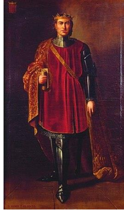
Jacobus I van Sicilië

In 1295 werd Robert vrijgelaten. Teneinde ook de kroon van het naburige koninkrijk Sicilië te verwerven, trouwde Robert hetzelfde jaar met Jolanda, de zus van koning Jacobus I van Sicilië, en beloofde Jacobus om af te zien van zijn aanspraken op Sicilië.