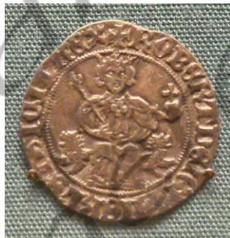
Zilveren gigliato van Robert I van Anjou, koning van Napels (1309-1343).