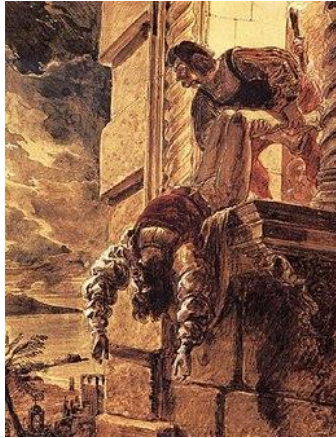
Moord op Andreas van Calabrië, door Karl Brjoellov