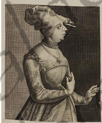
Gravure van koningin Johanna II van Napels.

De laatste wettelijke afstammeling was koningin Johanna II van Napels.