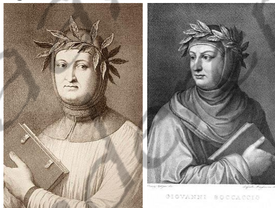
Francesco Petrarca en Giovanni Boccaccio

Hij werd door Francesco Petrarca en Giovanni Boccaccio – die aan het begin van zijn carrière als kamerheer diende aan het hof van Robert – herinnerd als een gecultiveerd man en een genereus patroon van de kunsten, "uniek onder de koningen van onze tijd," beweerde Boccaccio na Roberts dood, "een vriend van kennis en deugd." Petrarca vroeg te worden ondervraagd door Robert vooraleer hij tot dichter werd gekroond in de Campidoglio in Rome (1341); zijn Latijns epos Africa is opgedragen aan Robert, hoewel het tot in 1397 niet voor lezers beschikbaar was, lang nadat zowel Petrarca als Robert waren overleden.