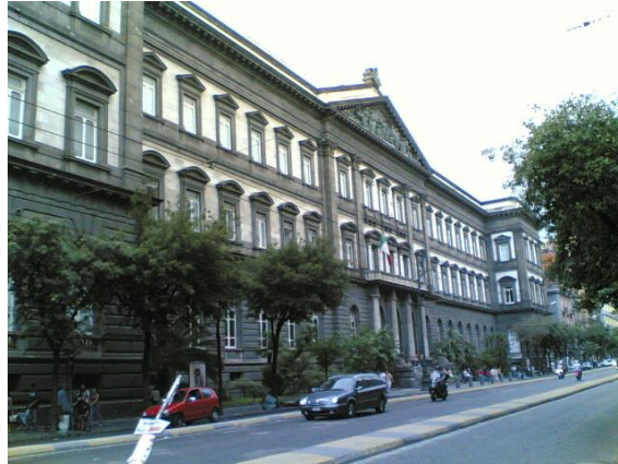
Universiteit van Napels Federico II

Er was haast geen middenklasse in het zuiden om een tegenwicht te vormen voor de lokale interesses en centrumzoekende macht van de argwanende aristocratie, die de feodale onafhankelijkheid wensten te behouden die ze hadden verkregen van de Normandische voorgangers van het huis Anjou-Sicilië.