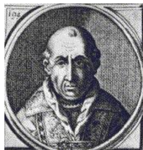
Paus Clemens V

Intussen had de Franse paus Clemens V zich gevestigd in Roberts graafschap Provence, in Avignon.