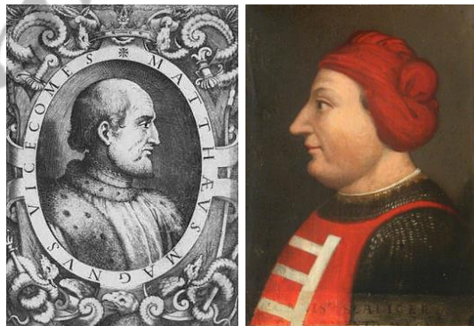
Matteo Visconti en Cangrande della Scala

Reactie bleef niet uit en keizer Hendrik organiseerde een strafexpeditie richting Napels. Gelukkig voor Robert stierf keizer Hendrik aan malaria en ging de expeditie niet door. Na Hendriks dood leek het er door de reactie van de Welfen tegen de leiders van de Ghibellijnen in Noord-Italië, Matteo Visconti en Cangrande della Scala, er even op dat Robert zou uitgroeien tot arbiter van Italië.