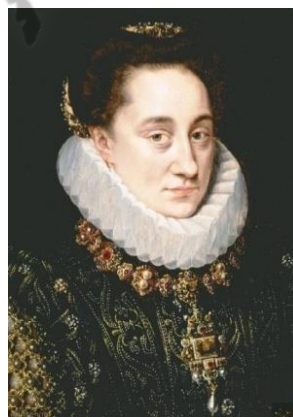
Maria van Nassau

In 1563 werd hij peetoom van Elisabeth van den Bergh, het zesde kind van zijn broer Willem en Maria van Nassau.