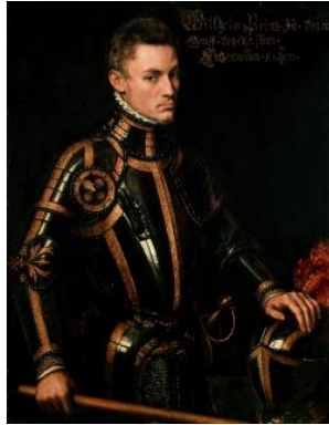
Willem van Oranje

In 1568 brak de Tachtigjarige Oorlog uit. In deze onrustige tijd gebruikten Frederik en Willem wederzijds elke kans om elkaar dwars te zitten. Willem had de kant van Willem van Oranje gekozen en moest met hem naar Duitsland vluchten, waarna zijn goederen door de Spanjaarden in beslag werden genomen.