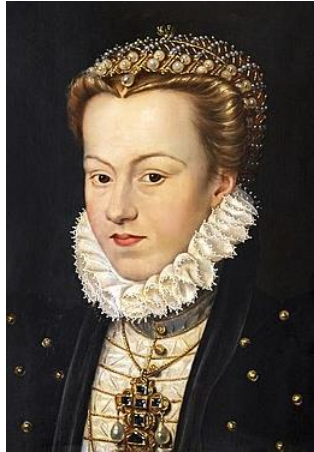
Elisabeth van Oostenrijk