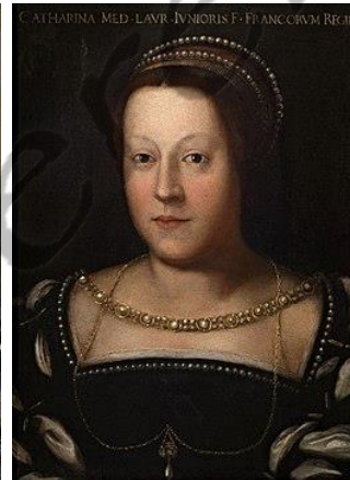
Hendrik II van Frankrijk & Catharina de' Medici

Hij volgde zijn ziekelijke broer Frans II op, werd daartoe in 1563 meerderjarig verklaard, maar bleef tot 1570 onder het regentschap van zijn moeder. Hij trouwde in datzelfde jaar met Elisabeth van Habsburg, de dochter van keizer Maximiliaan II.