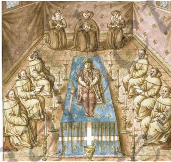
Begravenis van Karel IX. Verlichting uit het manuscript Carmen de tristibus Galliae, 1577, gemeentelijke bibliotheek van Lyon