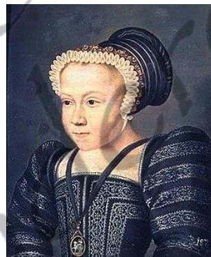
Maria-Elisabeth van Frankrijk

Hun enige dochtertje Maria Elisabeth (of Maria-Isabella) overleed op 2 april 1578, op 5-jarige leeftijd.