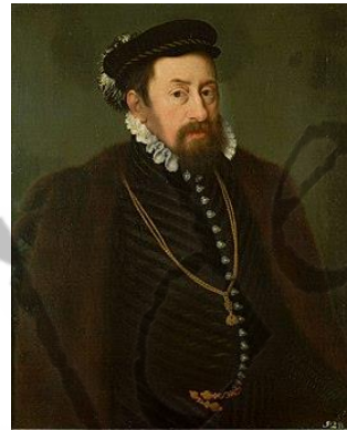
Keizer Maximiliaan II

Hun enige dochtertje Maria Elisabeth (of Maria-Isabella) overleed op 2 april 1578, op 5-jarige leeftijd.