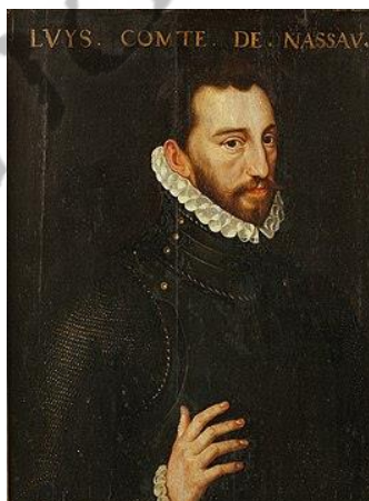
Lodewijk van Nassau

Hij gaf zijn goedkeuring aan een hugenotenleger onder leiding van Jean de Hangest, heer van Genlis om het in Bergen belegerde calvinistische garnizoen van Lodewijk van Nassau te ontzetten; deze hugenoten werden evenwel vernietigend verslagen in de Slag bij Saint-Ghislain (juli 1572).