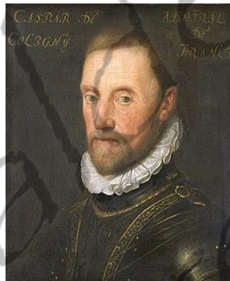
Gaspard de Coligny

In zijn streven naar godsdienstvrede kwam hij onder de invloed van admiraal Gaspard de Coligny, die in de strijd tegen Spanje de mogelijkheid zag om een nieuwe nationale eenheid in Frankrijk te realiseren.