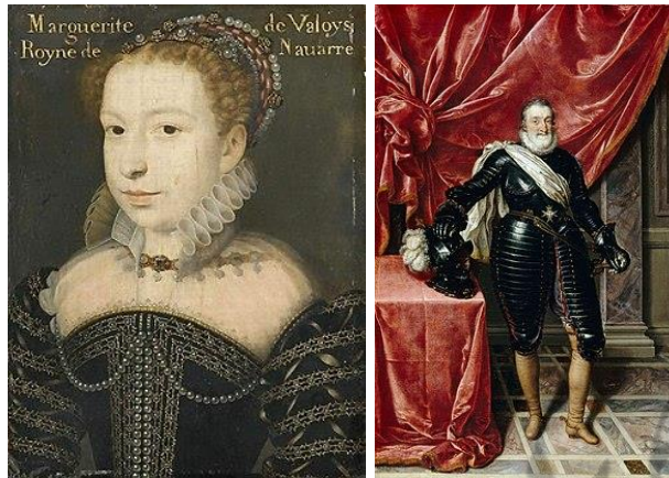
Margaretha van Valois & Hendrik IV van Frankrijk

toekomstige Franse koning), een belangrijke protestantse edelman die in lijn van de troonopvolging stond, dit was een laatste poging van Karel om zijn onderdanen te verenigen.