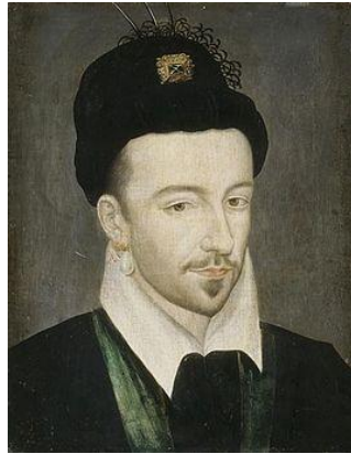
Hendrik III van Frankrijk

zou bezorgen. Karel IX overleed op 23-jarige leeftijd aan tuberculose en werd begraven in de Basiliek van St Denis. Hij werd opgevolgd door zijn jongere broer Hendrik, hertog van Anjou.