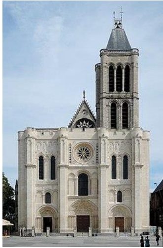
Basiliek van Saint-Denis