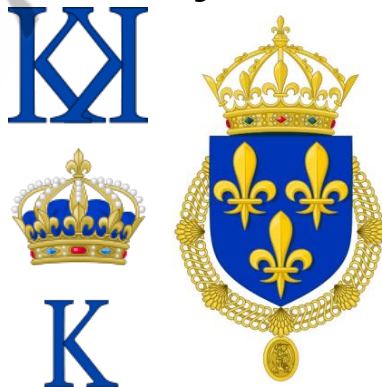
Koninklijk monogram & wapen van Karel IX