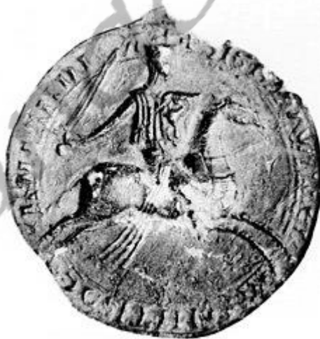
Corpus Sigillorum Neerlandicorum (Den Haag 1937-40) nr. 509