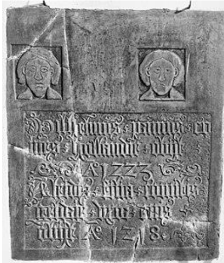
Foto uit 1943 van de grafsteen van Willem I van Holland en Aleid van Gelre, in het koor van de Hervormde Kerk in Rijnsburg.

Willem huwde voor een tweede maal in juli 1220 met Maria van Leuven. Dit huwelijk is kinderloos gebleven.