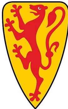
Wapen graven van Holland uit het Hollandse huis ca. 1200

Lodewijk VIII van Frankrijk naar Engeland. In reactie daarop erkende de Engelse koning Jan kort voor zijn dood (1216) Lodewijk van Loon weer als graaf van Holland, maar deze overleed voor hij daar wat mee kon doen (1218). Het lukte Jan wel om Willem te laten excommuniceren.