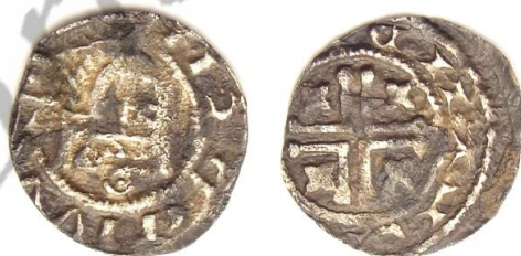
Holland, Penning, geslagen door Willem I als Graaf van Holland tussen 1212 en 1222.

Het bestuur van Willem is van belang geweest voor de ontwikkeling van Holland als handelsland. Zijn broer Dirk VII was begonnen met het regelen van invoerrechten voor buitenlandse kooplieden via de kring van tolleren die hij langs de rivieren die Holland binnenstroomden. Daarbij bevoordeelde hij handelssteden als Dordrecht. Graaf Willem erkende de door Dirk gegeven stadsrechten aan Geertruidenberg (1213), Middelburg (1217), Zierikzee (1219?) en Dordrecht (1220) en Leiden en breidde ze uit, waarbij Dordrecht (dat al kort na 1195 en even voor 1200 keuren had ontvangen) het keurrecht kreeg. De stad kon zo als dat nodig was haar eigen rechten uitbreiden zonder dat er toestemming van de graaf nodig was. Het was voor het eerst dat een Hollandse stad zulk recht kreeg. Daarnaast bevorderde graaf Willem de interne organisatie van ingepolderde delen van Holland, waaronder de Grote Waard.