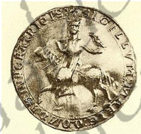
Maria van Leuven, ook wel bekend als Maria van Brabant

Willem huwde voor een tweede maal in juli 1220 met Maria van Leuven. Dit huwelijk is kinderloos gebleven.