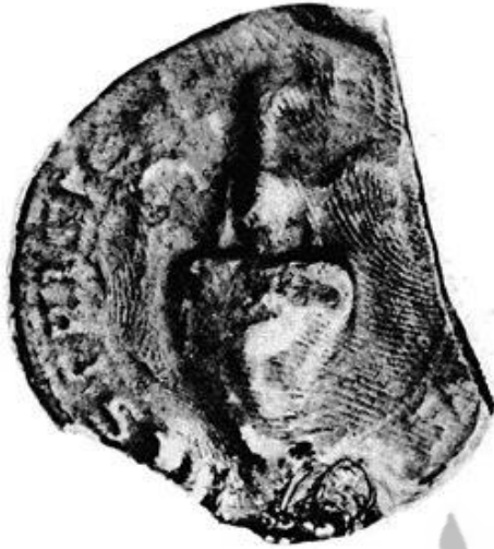
Corpus Sigillorum Neerlandicorum (Den Haag 1937-40) nr. 510