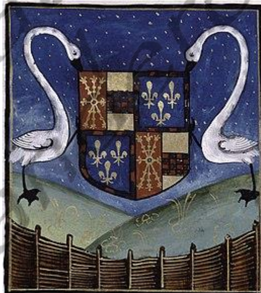
Wapen van Engelbert van Kleef, graaf van Nevers