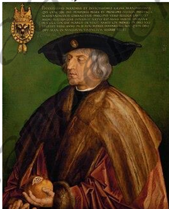
Keizer Maximiliaan I

De toen 19-jarige Engelbert kwam op de avond voor Kerstmis aan bij de stad Utrecht, toen hij gelijktijdig kerkklokken hoorde luidde en de Slag bij Westbroek aanschouwde. De politieke steun werd gedaan om Engelbrecht op de bisschopszetel van Utrecht te krijgen. In 1482 werd hij uiteindelijk tot ruwaard benoemd, maar werd het jaar erna verjaagd door Maximiliaan van Oostenrijk.