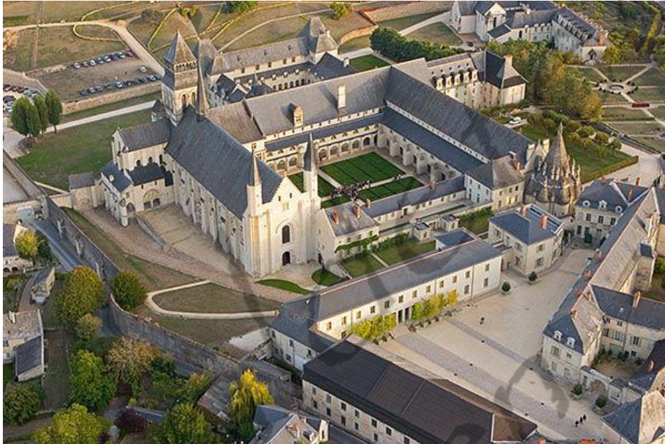
Abdij van Fontevraud