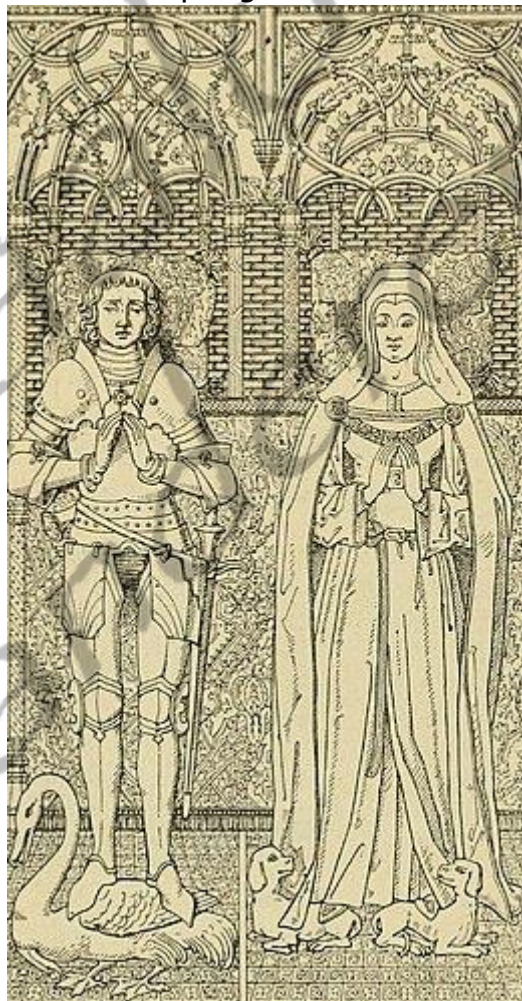
Tekening van de grafplaat van Johan I van Kleef en Elisabeth van Bourgondië in de Stiftskerk in Kleef.