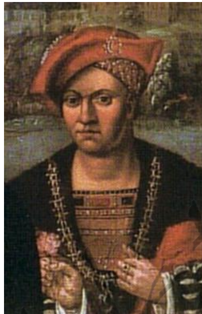
Johan II van Kleef

Engelbrecht werd door zijn broer Johan II van Kleef in 1481 met een grote legermacht, naar Utrecht gestuurd.