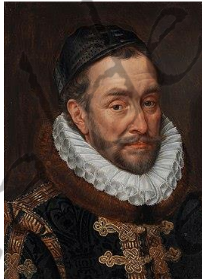
Willem van Oranje in 1580 door Adriaen Thomasz Key