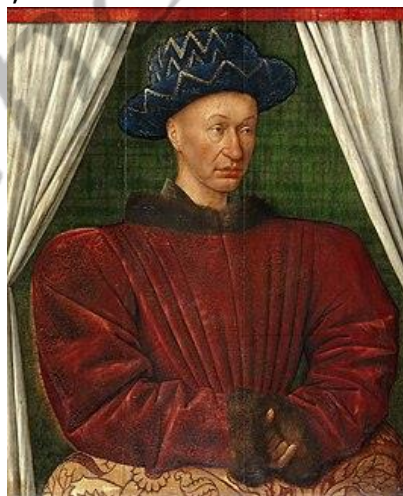
Karel VII van Frankrijk

Jan trachtte nog hulp te krijgen van koning Karel VII van Frankrijk, maar zijn eigen kapittel keerde zich tegen hem en stuurden gezanten naar Rome om de paus ertoe te bewegen hem af te zetten, wat in november 1455 lukte.