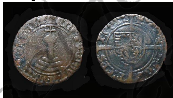
Luikse munt met perroen en wapen Jan van Heinsberg

Jan van Heinsberg overleed op 18 oktober 1459 in Kuringen bij Hasselt terwijl hij op doorreis was naar Brussel. Als telg van de laatste heren van Heinsberg werd hij in de familiegrafkelder in de Sint-Gangulfuskerk te Heinsberg begraven.