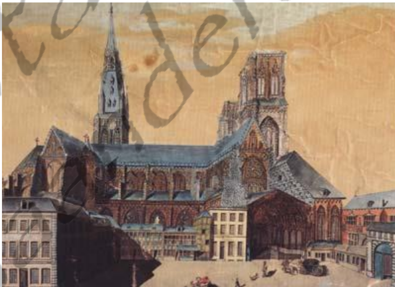
Sint-Lambertuskathedraal in 1780

Op 16 Juni 1419, op 23-jarige leeftijd, werd hij gekozen tot bisschop van Luik, waarna hij het proostschap in Aken en Maastricht moest neerleggen. In december van datzelfde jaar vond de plechtige installatie plaats in de Sint-Lambertuskathedraal van Luik. In 1422 nam hij als bisschop van Luik deel aan een veldtocht tegen de Hussieten. In 1423 vond een kerkelijke synode plaats in Keulen. Een poging de daar genomen besluiten over de kerkelijke tucht door te zetten in zijn bisdom, mislukte.