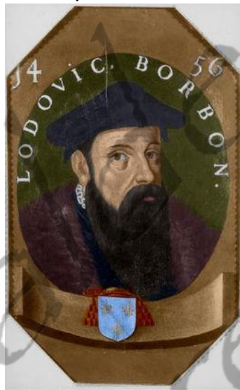
Lodewijk van Bourbon

Jan trachtte nog hulp te krijgen van koning Karel VII van Frankrijk, maar zijn eigen kapittel keerde zich tegen hem en stuurden gezanten naar Rome om de paus ertoe te bewegen hem af te zetten, wat in november 1455 lukte.