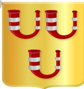
Wapen van het huis Horne