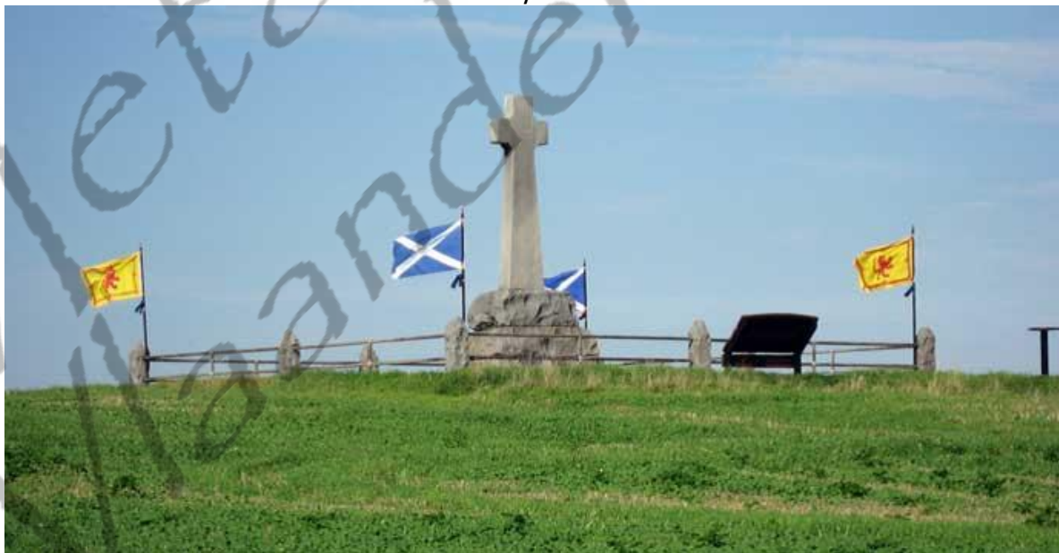
Monument van De slag bij Fodden