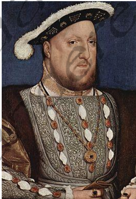
Hendrik VIII van Engeland

Als gevolg van de Oorlog van de Liga van Kamerijk, onderdeel van de Italiaanse Oorlogen, viel Engeland in 1513 Frankrijk binnen. Ook jegens Schotland had de nieuwe koning van Engeland Hendrik VIII een enigszins vijandige houding aangenomen, vanwege de opkomende macht van Schotland.