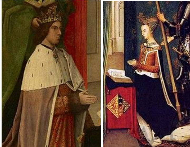
De ouders van Jacobus IV: Jacobus III en Margaretha van Denemarken

De regering van Jacobus IV wordt gekenmerkt door relatieve rust in Schotland. Hij vestigde een krachtig koninklijk gezag en breidde de Schotse vloot enorm uit. Als beschermer van de kunst en de wetenschap bleek hij een typische renaissance-vorst. Hij was erg ontwikkeld en er werd gezegd dat hij tien talen vloeiend sprak: Scots, Engels, Gaelic (hij was de laatste koning die deze taal vloeiend sprak!), Latijn, Frans, Duits, Italiaans, Vlaams, Spaans en Deens. Tijdens zijn bewind ging Schotland in Europa voor het eerst meetellen.