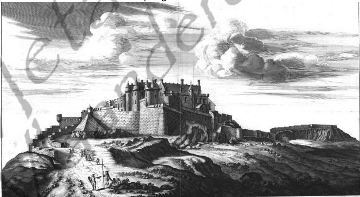
Stirling Castle, geboorteplaats van Jacobus IV van Schotland