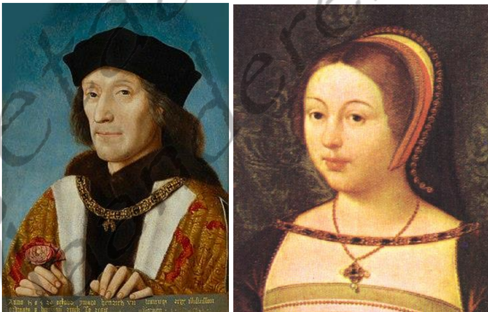
Hendrik VII van Engeland en Margaret Tudor

In 1502 sloot hij een vredesverdrag met koning Hendrik VII van Engeland (het eerste verdrag tussen Schotland en Engeland sinds 1328) en huwde met diens dochter Margaret Tudor.