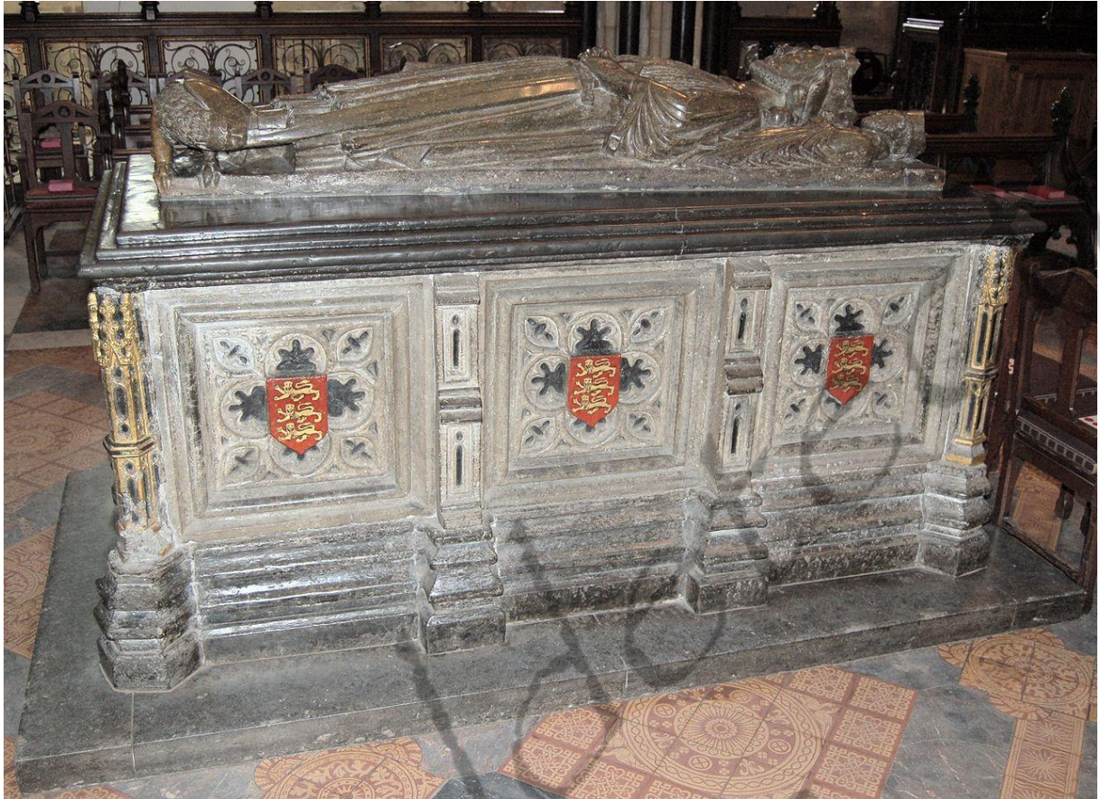
Tombe in de Kathedraal van Worcester