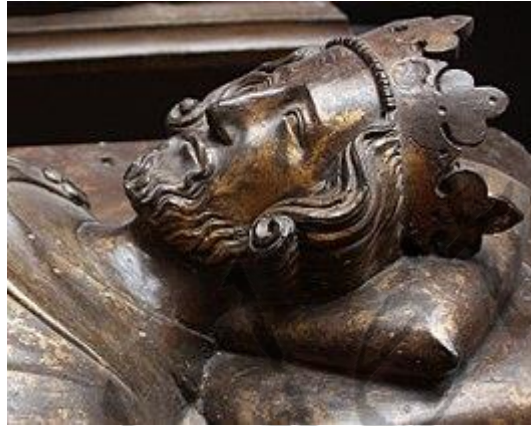
Effigie van Hendrik III in Westminster Abbey, ca. 1272.

De opstandelingen wilden de kroon overdragen aan de Franse kroonprins Lodewijk (de latere Franse koning Lodewijk VIII). Deze trok in juni 1216 Londen binnen. Jan trok zich terug naar het noorden. Terwijl hij The Wash doorkruiste werd zijn bagagestoet verrast door het opkomend tij. Jan raakte kostbare bezittingen kwijt, waaronder de kroonjuwelen. Door het verlies raakte zijn lichamelijke en geestelijke gezondheid aangetast. Hij overleed op 18 of 19 oktober 1216 aan dysenterie en werd begraven in de kathedraal van Worcester. Zijn negenjarige zoon volgde hem op als Hendrik III.