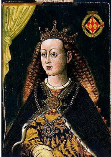
Isabella van Angoulême

Ze was verloofd geweest met Hugo de Bruine van Lusignan, de broer van Ralf van Lusignan, maar haar ouders prefereerden een koning als schoonzoon. Jan zonder Land kreeg daardoor de gebroeders Hugo en Godfried van Lusignan als geduchte vijanden tegenover zich. Jan en Isabella kregen vijf kinderen, de zoons: