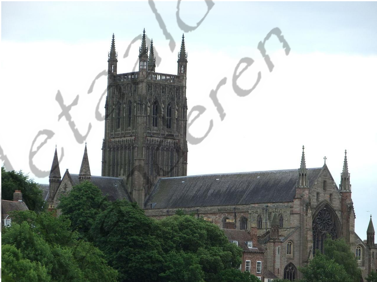
Kathedraal van Worcester