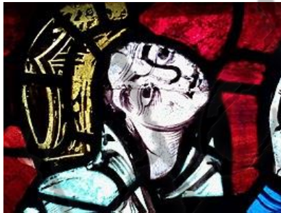
Eleonora van Aquitanië