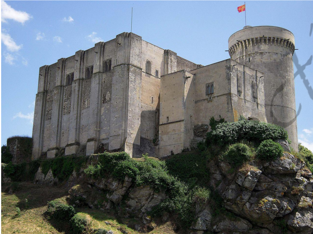
Kasteel van Falaise

Jan had zijn moeder bezworen Arthur geen haar te krenken. Arthur wenste na een half jaar eenzame opsluiting echter geen vrede met Jan te sluiten, maar eiste dat Jan Engeland en Richards gebieden op het vasteland aan hém overdroeg. Jan gaf daarop opdracht Arthur in het geheim van zijn gezichtsvermogen en testikels te ontdoen, maar door zijn gekrijs werd de slotbewaarder Hubert van Burgh gealarmeerd, waardoor de verminking Arthur bespaard bleef. Hubert van Burgh verzong een list en deed uitgaan dat Arthur was overleden. Daarna ontkende hij het bericht. Dat leidde alom tot geruchten, waardoor niemand wist of Arthur nog leefde. Jan bracht Arthur over naar de donjon van het kasteel van Rouen. Uiteindelijk ontdeed hij zich definitief van Arthur door hem in 1203 te wurgen. Echter volgens de kronieken van de abdij van Margam in Wales en van Willem de Breton voer Jan in de nacht van Goede Vrijdag van Molineaux met een kleine boot naar de donjon van Rouen, bracht Arthur op het schip, doorstak hem met zijn zwaard, liet zijn lichaam met een grote steen verzwaren en wierp hem in de Seine. Vissers vonden het lichaam en daarna werd Arthur zonder ruchtbaarheid in het klooster Notre Dame-des-Prés begraven.