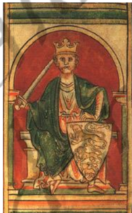
Richard I Leeuwenhart

Al voor zijn troonsbestijging had Jan een kwalijke naam opgebouwd als verrader en samenzweerder, soms met, soms tegen zijn oudere broers. Al in 1184 betwistten Jan en Richard elkaar de erfopvolging van Aquitanië, wat leidde tot veel onderlinge onmin. In 1177 echter kreeg Jan het bestuur over Ierland, waar hij zich binnen zes maanden zo impopulair wist te maken, dat hij het land moest verlaten.