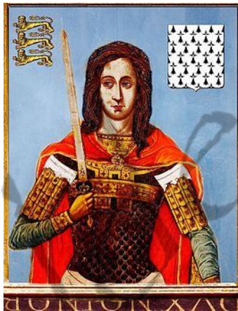
Arthur I van Bretagne

achtergelaten gouverneur voor de Franse bezittingen. Toen Richard uiteindelijk in 1194 terugkeerde, vergaf hij Jan diens misstap. Deze episode is breed bekend geworden via de verhalen rond Robin Hood en in de roman Ivanhoe van sir Walter Scott, waarin (niet geheel waarheidsgetrouw) Richard wordt afgeschilderd als de held en Jan als de slechterik. Tijdens het beleg van het kasteel Châlus in Limousin werd Richard door een pijl in zijn schouder getroffen en raakte hij daardoor dodelijk gewond. Aangezien Richard op aandringen van zijn moeder Eleonore uiteindelijk Jan in plaats van neef Arthur als opvolger had aangewezen, werd deze in Engeland algemeen als koning geaccepteerd. De Franse gebieden (afgezien van Normandië) schoven echter een andere troonpretendent naar voren: Arthur I van Bretagne, de zoon van Godfried, de derde zoon van Hendrik II.