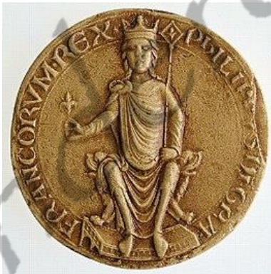
Zegel van Filips II, bijgenaamd August(us)

Dit leidde tot een oorlog, waaraan in mei 1200 een einde kwam met het verdrag van Le Goulet. Hierbij moest Jan wel een aantal veren laten op het vasteland. De rust was van korte duur, want de Franse koning Filips II August hervatte samen met Arthur de strijd.