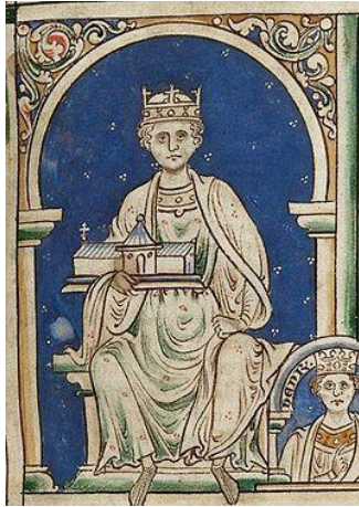
Hendrik II van Engeland