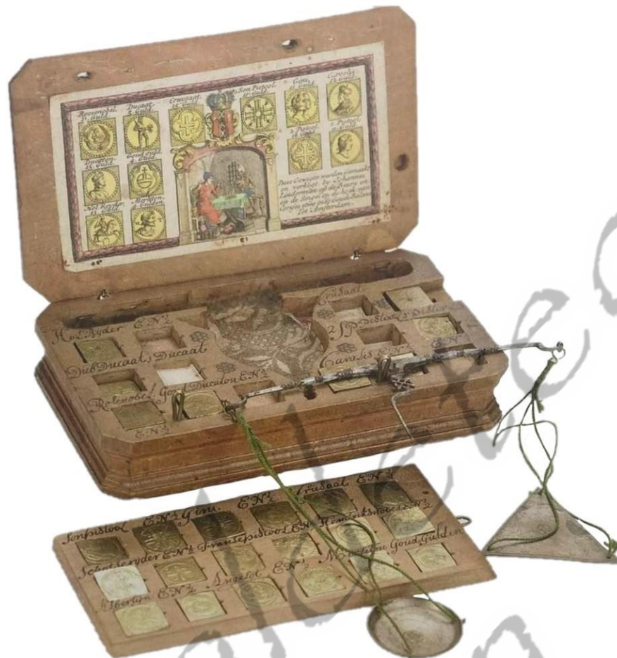
↑ Een muntbalansweegschaal en een muntgewichtdoos met muntgewichten

Het aantal gewichten in een doos was afhankelijk van de wensen van de gebruiker en van de monetaire situatie van die tijd. Die gebruikers konden variëren van boeren tot bankiers. De vroegste muntgewichtdozen die in Nederland werden gebruikt, dateren uit de 16 e eeuw en waren hoofdzakelijk in Antwerpen en Keulen vervaardigd. Deze dozen konden tot wel 40 uitsparingen voor muntgewichten bevatten, terwijl jongere exemplaren, uit de 18 e eeuw, soms slechts negen vakjes hadden. Vaak kon er meer dan één muntgewicht in een vakje worden bewaard, waardoor een eigenaar van een muntgewichtdoos wel over niet minder dan 60 muntgewichten kon beschikken. Het merendeel van de muntgewichtdozen stamt uit de eerste helft van de 17 e eeuw en uit de tweede helft van de 18 e eeuw. In die perioden was er veel goudgeld in omloop in de Nederlanden; in het tijdvak 1650-1750 was de circulatie van gouden munten juist relatief laag. In de loop van de 19 e eeuw zijn de gouden munten grotendeels van de markt verdwenen, en daarmee ook de muntgewichten.