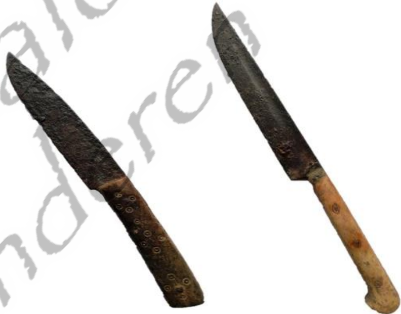
↑ Enkele messen met benen heft: 15 e eeuw- 16 e eeuw