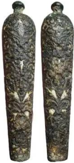
↑ Mesheft: 17e eeuw Materiaal: koperlegering met emaille Afmetingen: 18 mm / 87 mm Gewicht: 34,9 gr