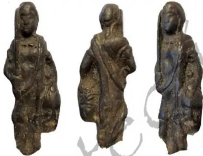
↑ Mesheft: 16e eeuw – 17e eeuw Voorstelling van David en het afgehakte hoofd van Goliath in zijn linkerhand.