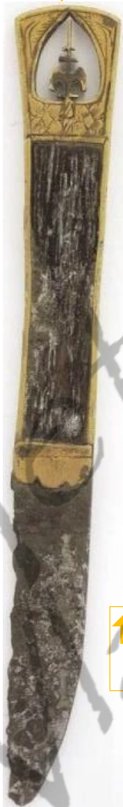
↑ Mesheftversiering: 15e eeuw Materiaal: koperlegering