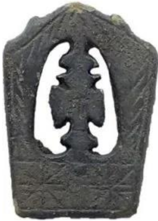
↑ Mesheftbekroning: type hellebaard ca. 1500