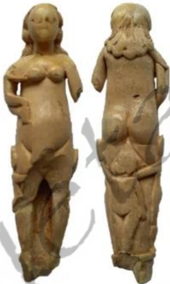
↑ Mesheft: 17e eeuw Materiaal: been Lengte: 90 mm Gewicht: 20 gr