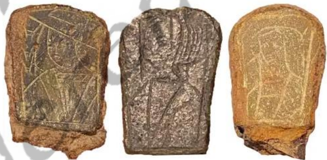
↑ Mesheftbekroningen: 1450 – 1550 Materiaal: koperlegering