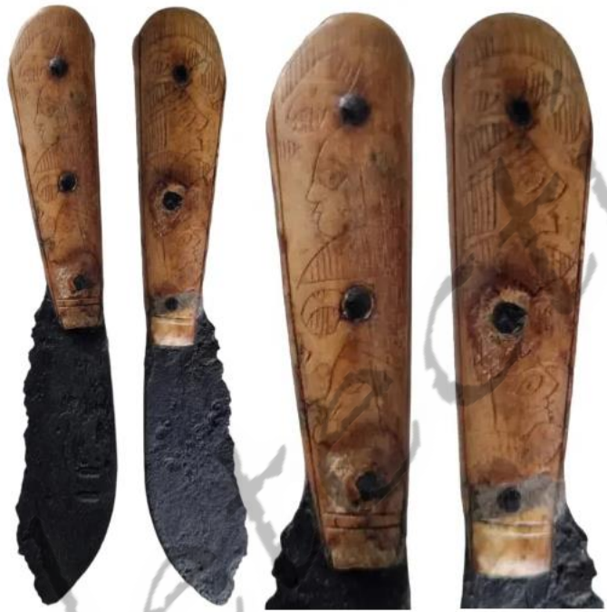
↑ Mes: 17e eeuw, Spaanse Nederlanden Materiaal mesheft: been Materiaal mes: ijzer