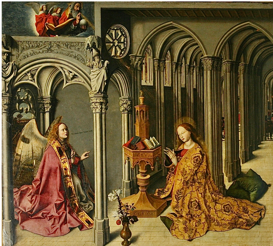
Annunciatie, Olieverf op hout, Barthélemy d'Eyck ca.1443-1445

Op het bovenste deel van het linkerluik van de triptiek wordt de annunciatie uitgebeeld. In een sierlijke gotische nis verschijnt de aartsengel Gabriël aan de Heilige Maagd Maria, om haar de boodschap te brengen dat zij de moeder zal worden van de Zoon van God. Rechts van deze scène ontmoet Maria haar moeder, de Heilige Anna wat hun ontmoeting bijzonder symbolisch maakt.