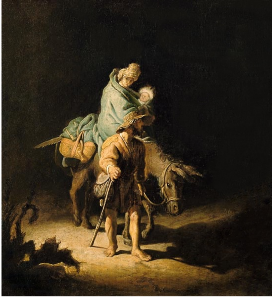
De Vlucht naar Egypte, Olieverf op paneel, Rembrandt. ca.1627.

Het rechterluik van de triptiek ontbreekt, maar vermoedelijk bevatte het scènes zoals de geboorte van Jezus rechts bovenaan, in het midden de Heilige Maria met het Kind Jezus in haar armen, en rechts onderaan de vlucht naar Egypte. Deze ontbrekende taferelen zouden de cyclus van Christus' vroege leven hebben voltooid.