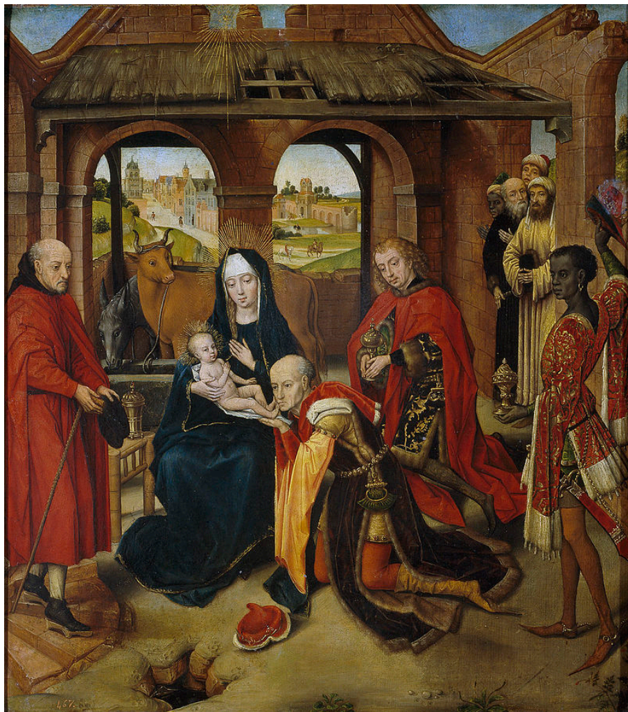
Aanbedding der koningen, Olieverf op canvas, Rogier van der Weyden ca. 1460-1470

In het midden van het linkerluik, onder een reeks gotische bogen, wordt de aanbedding van de drie wijzen weergegeven. De drie koningen – Melchior, Balthazar en Gaspard – brengen hun geschenken aan het pasgeboren Christuskind. Deze scène straalt devotie en verwondering uit.