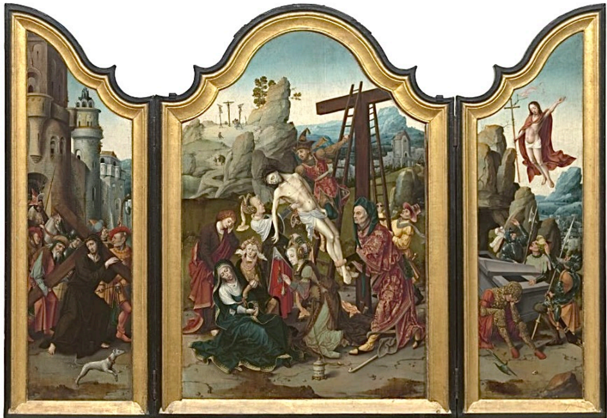
Drieluik met Kruisafneming, Kruisdraging en Verrijzenis. Anoniem, Museum Onze-Lieve-Vrouw-ter-Potterie Brugge.

Drieluikjes, ook wel triptiekjes genoemd, vervaardigd uit een tinlegering, vormen een bijzonder onderdeel van middeleeuwse privédevotie. Deze kleine kunstwerken dienden als spirituele focuspunten en hulpmiddelen bij het gebed. Ze waren ontworpen om eenvoudig te worden opgesteld in huiselijke privéruimtes, maar dankzij hun compacte formaat konden ze ook gemakkelijk worden meegenomen op reis.