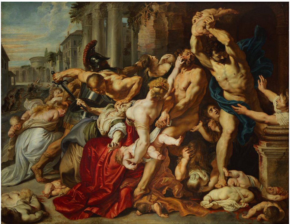
De Kindermoord van Bethlehem, Olieverf. Pieter Paul Rubens ca. 1611-1612.

Onderaan het linkerluik zien we een dramatisch tafereel: de kindermoord te Bethlehem. Koning Herodes, gezeten op een troon en getooid met een kroon in een gotische nis, lijkt onbewogen terwijl aan zijn rechterzijde twee soldaten onschuldige kinderen doden met zwaarden. Het bloedbad voltrekt zich onder dubbele gotische bogen, een schrijnende illustratie van het geweld dat volgde op de geboorte van Christus.