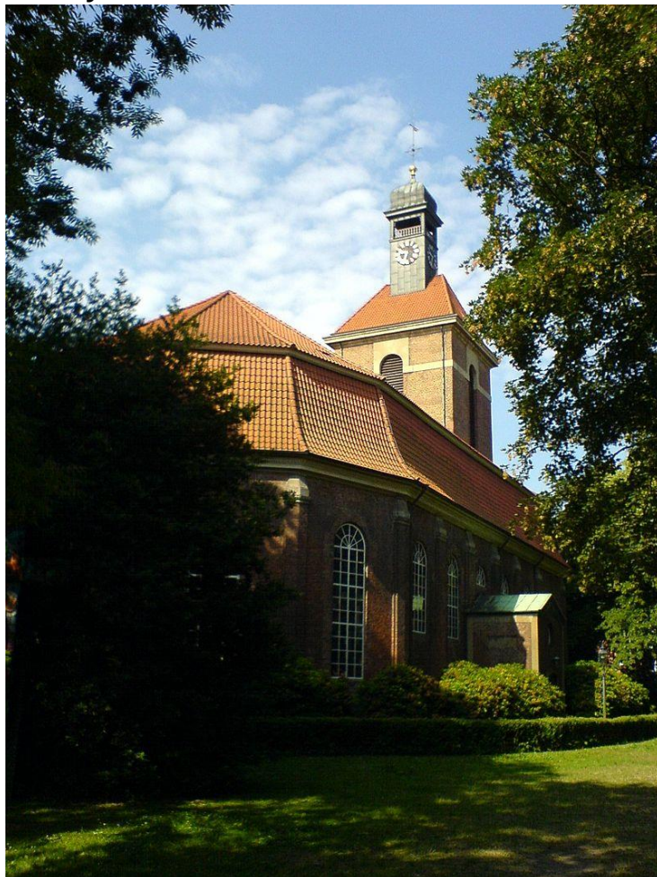
Christianskirche in Ottensen

Het lichaam van de hertog werd in 1806 voorlopig begraven in de Christianskirche in Ottensen. Later werd het op 6 november 1819 overgebracht voor herbegrafenis in de kathedraal van Brunswijk.