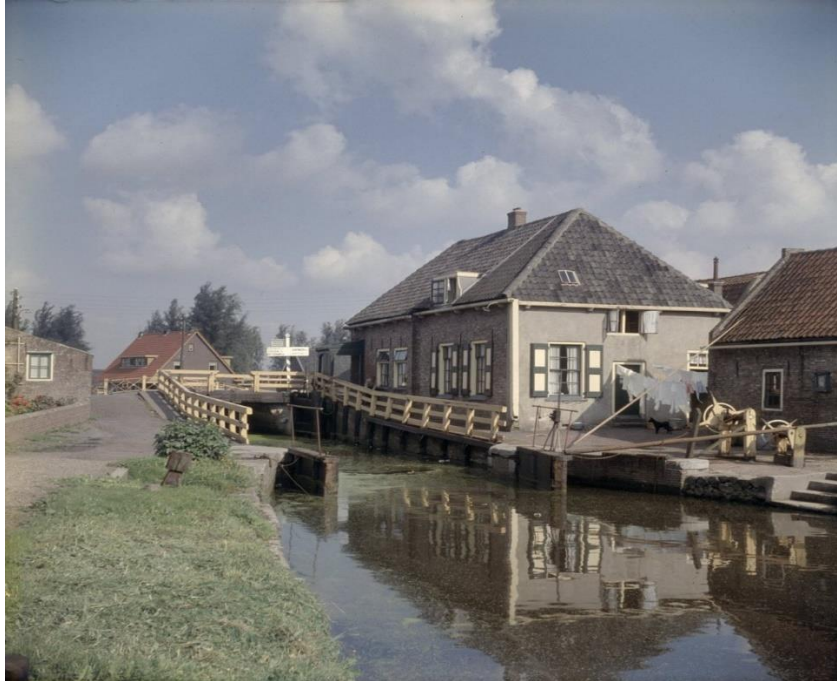
Goejanverwellesluis in 1958

Hij werd in 1787 Pruisisch veldmaarschalk en leidde in datzelfde jaar de veldtocht tegen de Nederlanden naar aanleiding van de aanhouding bij Goejanverwellesluis, en herstelde de macht van stadhouder Willem V.