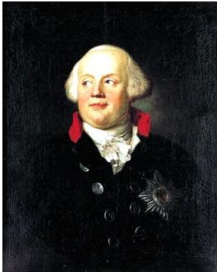
Frederik Willem II van Pruisen

Als zodanig maakte hij de Beierse Successieoorlog (1778-1779) mee. Zijn eigenzinnige zuster Elisabeth van Brunswijk-Wolfenbüttel was, na enkele jaren huwelijk met de latere koning Frederik Willem II van Pruisen en diverse schandalen, verbannen naar Stettin en zou hem nooit meer zien.