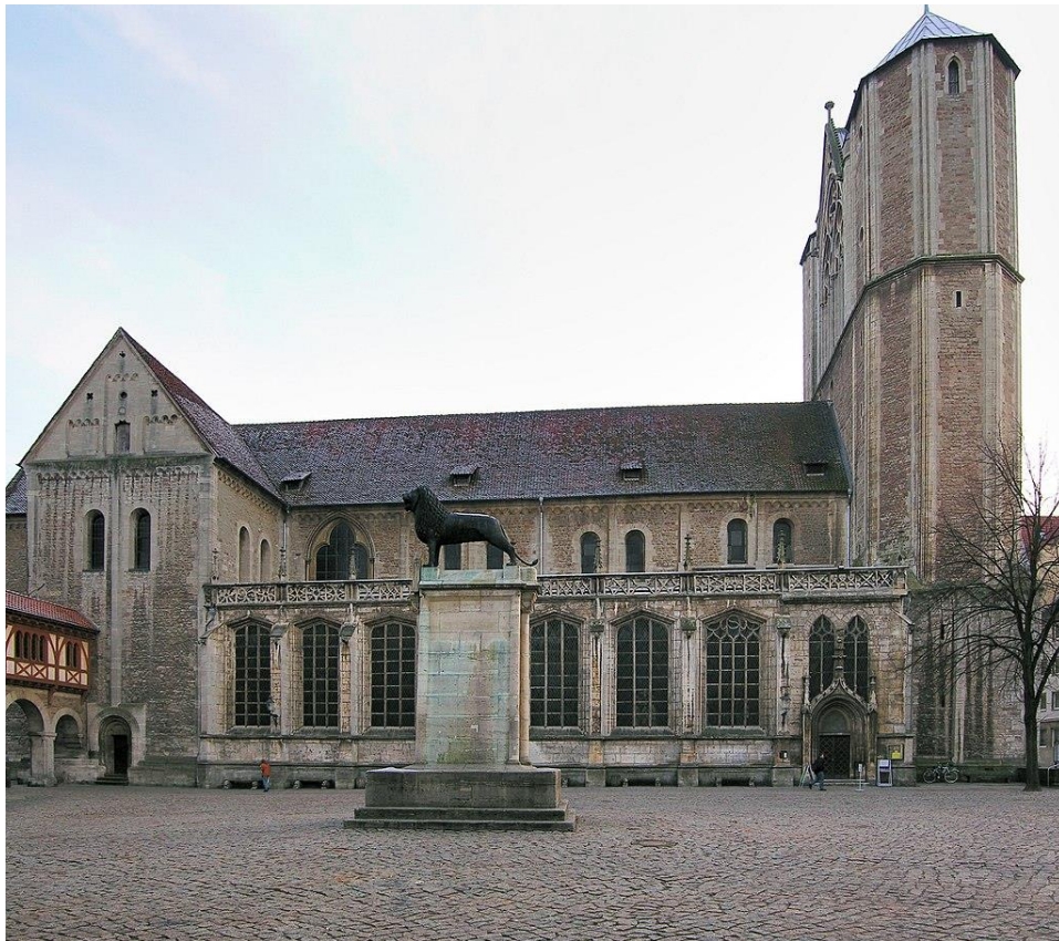
Dom van Braunschweig, de belangrijkste kerk in de Duitse stad Brunswijk.