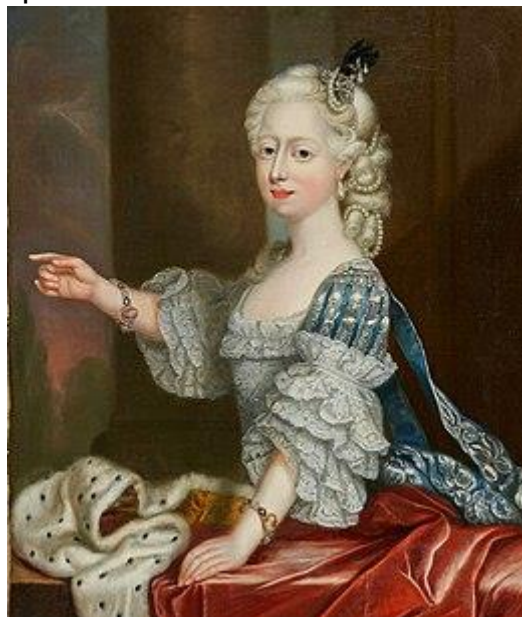
Augusta Frederika van Hannover

Karel Willem Ferdinand huwde in 1764 Augusta Frederika van Hannover (1737-1813), dochter van kroonprins Frederik.