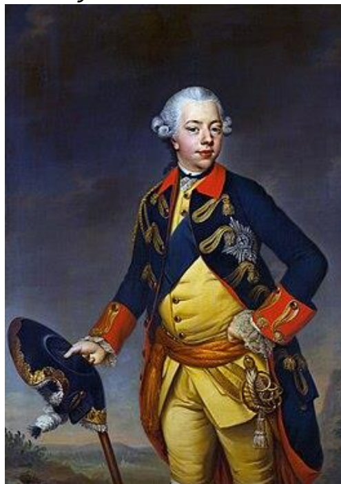
Willem V van Oranje-Nassau

Het optreden van het Pruisische leger was een groot succes. De kosten van de militaire operatie (een half miljoen gulden) werden door Holland betaald. Koning Frederik Willem II van Pruisen vierde de vrede die met zijn hulp door de