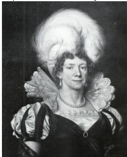
Louise van Oranje-Nassau

Als persoonlijke beloning voor Brunswijk voor het herstel van de stadhouderlijke macht gaf stadhouder Willem V toestemming voor het huwelijk van de erfprins van Brunswijk met zijn dochter prinses Louise van Oranje-Nassau.