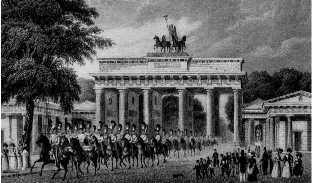
De Brandenburger Tor in 1832

machtsgreep in de Nederlanden was afgedwongen, met de bouw van de Brandenburger Tor in Berlijn.