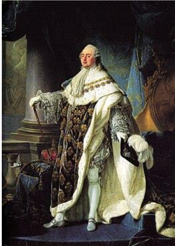
Lodewijk XVI van Frankrijk

Hij veroverde Longwy en Verdun en drong door tot in de Champagne, maar moest na de Slag bij Valmy (20 september 1792) met Charles-François Dumouriez een wapenstilstand sluiten en werd kort daarop tot terugtrekken gedwongen.