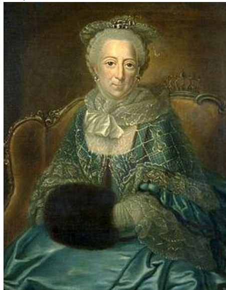
Karel I van Brunswijk-Wolfenbüttel en Philippina Charlotte van Pruisen