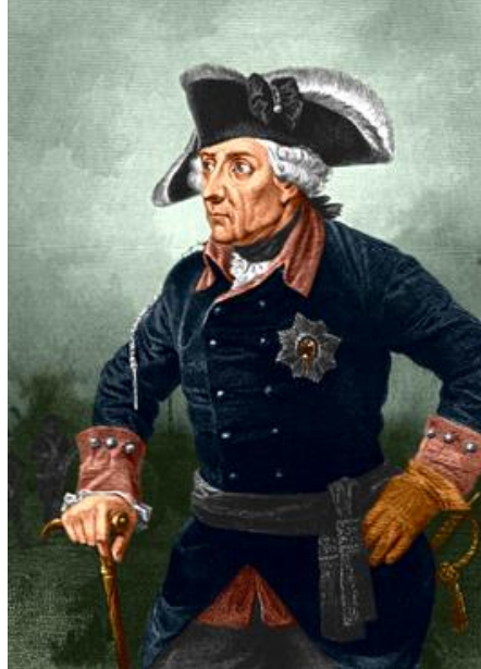
Frederik II of Frederik de Grote

Na een opvoeding in de klassieke, rationalistische traditie door de theoloog Johann Friedrich Wilhelm Jerusalem nam hij al vroeg dienst in het leger. Hij onderscheidde zich in de Zevenjarige Oorlog (1756-1763) in de slagen bij Hastenbeck en Krefeld en nam aan alle krijgsverrichtingen van zijn oom Ferdinand van Brunswijk deel. In 1773 werd hij, bij zijn oom Frederik de Grote als veldheer in hoog aanzien, benoemd tot generaal van de infanterie in het leger van Pruisen.