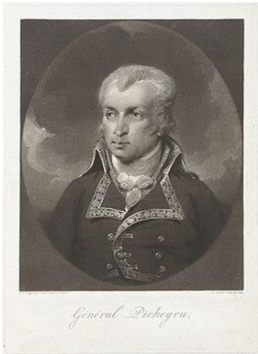
Lazare Hoche en Jean-Charles Pichegru

Hij voerde in de Vierde Coalitieoorlog (1806-1807) wederom het Pruisische opperbevel. Na de desastreuze Slag bij Jena en Auerstedt, waarin hij door een schot beide ogen verloor, vluchtte hij naar Denemarken. Een kleine maand later stierf hij aan zijn verwondingen. Zijn land werd bezet door Franse troepen en ging in 1807 deel uitmaken van het Koninkrijk Westfalen.